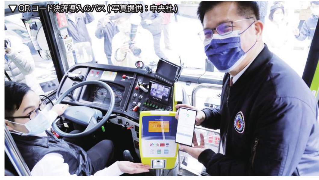
QRコード決済導入のバス

常であれば、業者への補助措置を講じ、すべての路線のバスに設置してあるICカード読み取り機を取り換え、QRコード決済に対応したものに順次取り換える。そうすることで公共交通機関の乗車システムの統一化を図り、MaaS(モビリティ・アズ・ア・サービス)の付加価値を上げる」とした。また「交通機関での支払いがすべてスマートフォン一つで完結することになる」とその利便性を説明した。さらに「当面は3つの業者の電子決済システムを導入するが、将来的にはその他の業者の参加も調整・奨励する。これにより市民に、より多様で便利な支払い方法を提供し、公共交通機関の全体的な発展を促してい