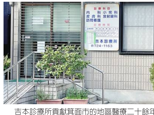
吉本診療所貢獻箕面市的地區醫療二十餘年