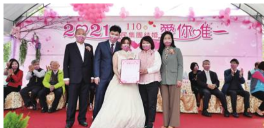
結婚年齢の基準は18歳となる

台湾立法院は2020年12月25日、成人年齢を現行の20歳より18歳に引き下げると発表した。三回目の民法修正案が2020年12月25日に可決し、決定したものの。施行は2023年1月1日からとなる。 台湾立法院は、台湾民法の一部の条項を