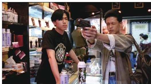
青春神話

台湾のニューシネマの原点から最近作までを網羅した「台湾巨匠傑作選2020」が2021年1月2日より横浜シネマリンで同22日まで開催した。台湾映画の魅力を伝える22本が一挙に上映されるもので、目玉は劇場初公開の「ワン・トン(王童)」監督作品『バナナパラダイス』だ。江口洋子スペシャルセレクトとして、未公開6作品『停車』『盗命師』『古代ロボットの秘密』『血観音』『天龍一座がゆく』『河豚』も上映された。 日本映画大学学長で映画評論家の佐藤