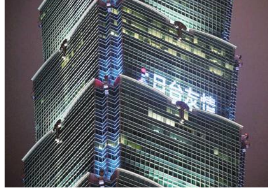
台日友情のライトアップ

がままならない中、科学技術の力を借りたバーチャル公演などを実施する」などの構想を明かにし、さらなる交流深化に意欲を見せた。 点灯式当日は、「2020東京五輪・パラリンピック」開幕の半年前の日に当たるため、東京大会に向けた応援メッセージも合わせて表示された。翌日の24日には、同協会が事前に行った一般公募で選ばれた10人による日台友情メッセージが午後6時から10時まで表示された。