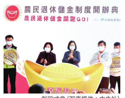
農民退休儲金制度開辦典 農民退休儲金開辦典 GO!

蔡英文總統は1月4日、台湾高雄市で「農民退休儲金制度開辦典」(農業従事者退職貯金制度創設式典)に出席し、「同制度の法的根拠である『農民退休儲金条例』は定年退職制度の全面的な整備完了を意味するだけでなく、農業を定年まで働き、安心した老後を過ごせる職業にするものだ」と述べ、「より多くの若者が帰省して農業に携わり、地元の農業に新たな活力を注入してくれることに期待する」と述べた。また、蔡總統は挨拶で、「農民退休儲金」創設の重要な意義を二つ挙げた。