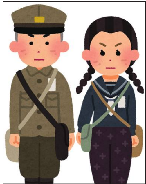
太平洋戦争頃の日本学生

※第二次世界大戦での死者は世界で5000万人以上、(民間人は3400万人)。太平洋戦争の死者数：軍人で日本230万人(特攻による死者数5845人)、台湾18万人、朝鮮22万人；民間一般で日本80万人、台湾3万人、朝鮮2万人、中国1000万人、インド350万人、ベトナム200万人。