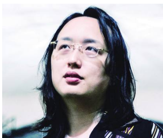
唐鳳 meets 福島 futures

東日本大震災から10年の節目となる今年の3月11日午後2時46分、台湾デジタル担当政務委員大臣の唐鳳(オードリー・タン)氏が「オンライン」で、福島の若者と未来について語らう動画を配信する。「自らの手で新しい福島・新しい社会を造るヒ