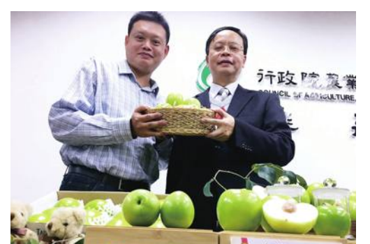
インドナツメの新品種「台農13号—雪麗」

台湾行政院の農業委員会農業試験所は1月20日、約13年をかけて開発したインドナツメの新品種「台農13号—雪麗」の販売を、今冬から開始したことを台北市内で開いた記者会見で発表した。新品種は早生種で、旧正月(春節)前に収穫のピークを迎えるのが特徴。長期輸送にも耐えられるため、将来は日本など海外輸出も目論む。 インドナツメは旧正月の贈り物として高い需要があるものの、多くは旧正月後が最盛期となるという課題があった。また、11月から12月にかけて市場に出回り始める既存品種「中葉」は、照明を活用して収穫時期を早めており、渋味や果肉の硬さ、水分の少なさなどが弱点となっていた。このため同所は2006年頃より早生種の開発に乗り出した。