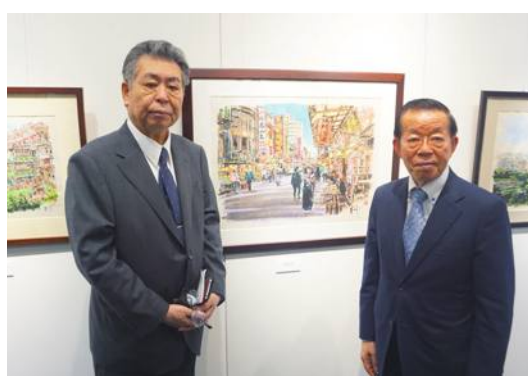
藤井さんと謝代表