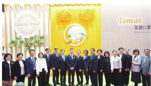
台灣館開幕儀式紀念合影

【東京／採訪報導】東京食品展於3月7日正式登場，今年經濟部國貿局與貿協合作，共徵集136家廠商組成台灣館，同時也是該展第二大參展國，其中也包括9個地方縣市政府，以及7大食品產業公會，是這5年來最大的陣容，也讓台灣館顯得氣勢磅礴。