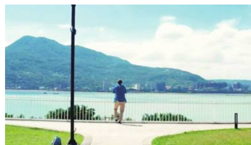
北海岸及観音山国家風景区管理処の「冒険之冠」のワンシーン