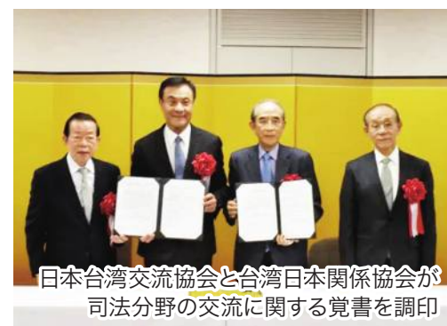
日本台湾交流協会と台湾日本関係協会が司法分野の交流に関する覚書を調印

日本の対台湾窓口機関・日本台湾交流協会と台湾の対日本窓口機関の一つである台湾日本関係協会は3月16日、日本台湾交流協会の東京本部で「公益財団法人日本台湾交流協会と台湾日本関係協会との間の法務司法分野における交流と協力に関する覚書」の署名式を行った。