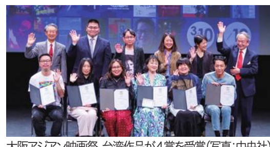
大阪アジア映画祭、台湾作品が4賞を受賞の関係者のSNSではファンから祝福のメッセージが殺到した。

「第18回大阪アジア映画祭」が3月19日に大阪市内で開催され、台湾の3作品が過去最多の4つの賞を受賞した。 「黒の教育」(黒的教育)で初めてメガホンを取った柯震東監督が「来るべき才能賞」に輝いたほか、潘客印監督の「できちゃった?!」(有了?! )は「芳泉短編賞スペシャル・メンション」を受賞。傅天余監督の「本日公休」は観客賞を受賞し、同作品に主演した陸小芬は「薬師真珠賞」に選ばれた。 台湾文化部(史哲部長)によると「台湾映画が引き続き国家の文化力を示し、台湾の文化コンテンツを強くしていく」(史哲文化部長)と期待し、受賞者には祝福の言葉を贈ったという。 今回の受賞を受け、柯震東監督など