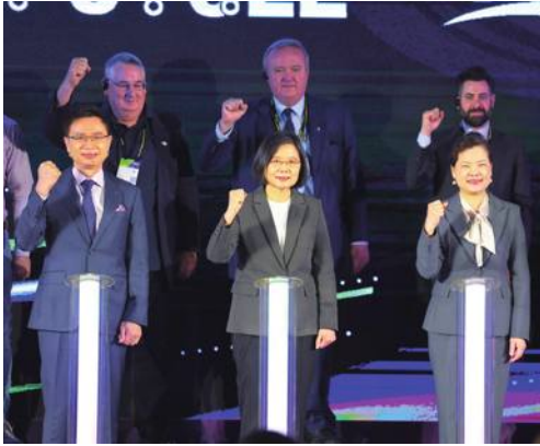
自転車産業見本市が開幕 蔡総統「電動・スマート化を加速させる」