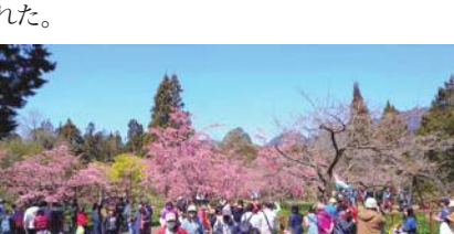
阿里山フラワーフェスティバル開幕

が遊楽区を訪れ、花見を楽しんだという。フラワーフェスは4月10日までの開催。3月13、20、27日には阿里山林業鉄道が蒸気機関車4号けん引する特別列車が運行された。