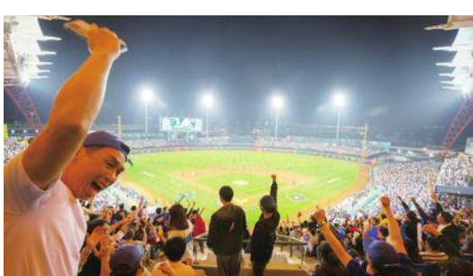
台湾、WBC 1次リーグに突破ならずも、ファンから感謝

第5回WBC(野球の国・地域別対抗戦)の1次ラウンドグループA組が3月8日に台中市の台中インターコンチネンタル野球場で開幕した。同日までの日程で全5チームが総当たり戦で臨み出場全チームが2勝2敗で終える大混戦となった。勝敗数で順位が決まらなかったため、大会規定に沿って失点率が適用され、キューバとイタ