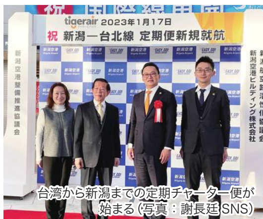
台湾から新潟までの定期チャーター便が始まる

マスク装着の緩和や感染症が5類に変更される見通しとなった日本国内のアフターコロナ時代において、日台両国の人的往来はコロナ前の水準に回復している。両国政府と観光業者は、双方の市場開拓、そして拡大の可能性を開発するため、推進手段を講じている。