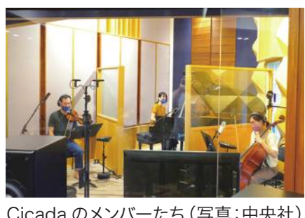
Cicadaのメンバーたち

かした。優秀音楽賞は「すずめの戸締まり」のRADWIMPSと陣内一真、「耳をすませば」の高見優らも受賞した。