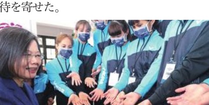
蔡総統、アウトドア世界綱引選手権大会で優勝の台湾チームと会見

引選手権大会が台湾で開催されることを踏まえ、開催国として各国の選手たちを迎えるとともに、ぜひとも台湾の選手たちの手でメダルを台湾にもたらして欲しいと期待を寄せた。