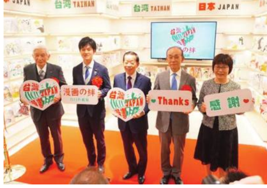
「漫画の絆 台日色紙展」が紀伊國屋書店新宿本店で開かれた