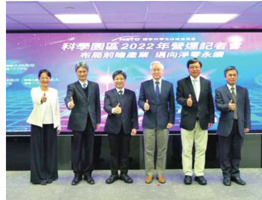
各サイエンスパークの関係者

ンスパークの営業額は対前年度比14.75%成長し、合計4兆2664億新台湾ドルに達した」と発表した。このうち新竹サイエンスパークの営業額は対前年度比1.59%成長し、1兆6132億新台湾ドル(約7.05兆日本円)となった。中部サイエンスパークは同13%成長の1兆1698億新台湾ドル(約5.11兆日本円)に、南部サイエンスパークは同35.48%成長、1兆4833億新台湾ドル(約6.48兆日本円)となった。