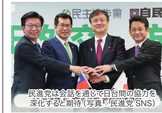
民進党は会話を通じて日台間の協力を深化すると期待

台湾与党・民進党と日本自民党は3月21日、外交や防衛の分野で両党議員が意見を交わす会合を台北市の民進党本部で開催した。両党間のいわゆる「2プラス2」が対面式で行われるのは初めて。出席した