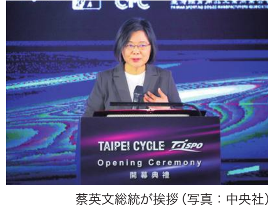
蔡英文総統が挨拶

蔡英文総統は3月22日、台北市で開かれた自転車産業見本市「台北サイクル」とスポーツ用品見本市「スポーツ・アンド・フィットネス台湾」の開幕式に出席し「政府は引き続き産業の競争力強化を後押しし、現代のテクノロジーと融合させ、電動化やスマート化を加速させる」と意気込みを語った。