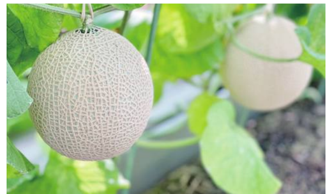
以「一木一果」方式長成均勻網紋的皇冠哈密瓜