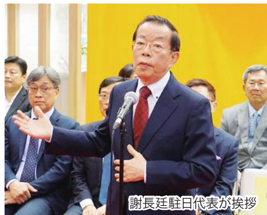
謝長廷駐日代表が挨拶