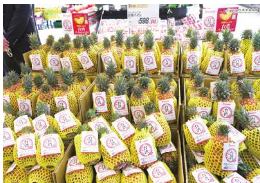
台湾産パイナップルは日本消費者に愛されている

西武ライオンズの奥村副社長は「日本の消費者は台湾のフルーツが大好き。野球でも日本と台湾は多くの交流がある」と陳副主任委員ら一行の訪問を歓迎した。ま