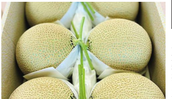
碩大肥美的皇冠哈密瓜

【記者黃貴美/靜岡縣專訪】初春三月，記者前往靜岡縣袋井市，參觀高級哈密瓜品牌「皇冠哈密瓜」(クラウンメロン)的溫室生產基地，專訪栽培「皇冠哈密瓜」超過60年的中條農園，探索「皇冠哈密瓜」背後蘊藏的日本職人精神。