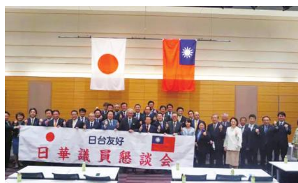
日華懇總會紀念合影

【東京／採訪報導】日華議員懇談會於3月9日舉辦總會，同時也發表2023年年底基本方針，並邀請駐日代表謝長廷出席，將方針轉交給謝長廷代表，今年適逢日華懇成立50週年，在方針中也提到將於夏季舉辦紀念活動，此外今年也預定舉辦第三屆台日美戰略對話，同時宣布自民黨政調會會長荻生田光一將接替岸信夫成為幹事長。