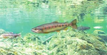
「国宝魚」と呼ばれるタイワンマス、野外個体数が過去最多に