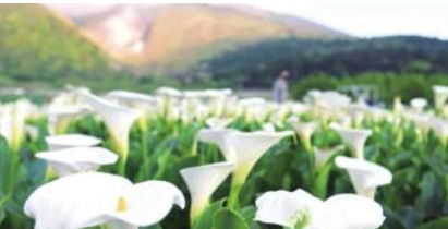
竹子湖でカラーフェスティバル。423まで

6月18日まで、さまざまな色のアジサイが咲き誇る「竹子湖アジサイフェスティバル」が開催されることになっている。