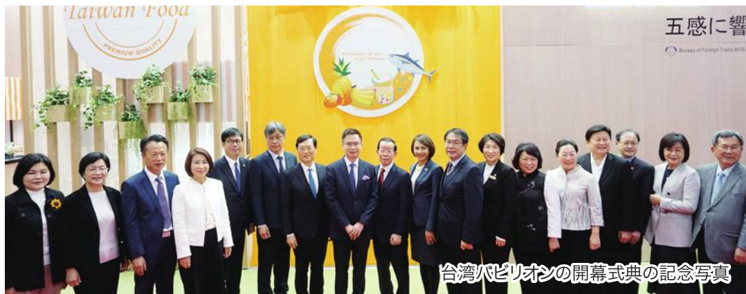
台湾パビリオンの開幕式典の記念写真