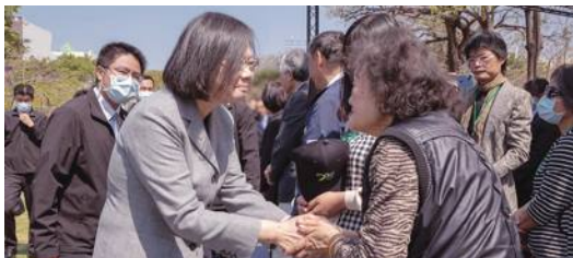
蔡英文総統が228事件76周年の記念式典に出席

開たばこ売りの取り締まりに端を発し、のちに台湾全土に広がっていった政治反抗運動「228事件」が今年で76年経った。政府主催の記念式典「二二八事件76周年中樞記念式典」は、初めて台南での開催となった。 蔡英文総統をはじめ、陳建仁行政院長、游錫堃立法院長、文化部の史哲部長、内政部の林右昌部長、台南市の黄偉哲市長、そ