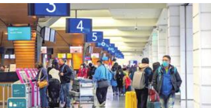
桃園空港、乗り継ぎ客に対し施設使用料徴収

と比べ、約6割まで回復している。また同氏は「今年1~2月の旅客数は延べ約409万人で、19年同期の52%に相当し、輸送量が明らかに回復している」と強調。23年には旅客数が延べ2000万人になるとの見通しを示した。