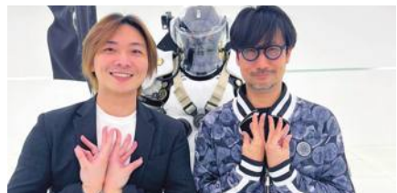
柯孟融監督が小島秀夫さんのスタジオを訪問

キャンなどを体験した。開発中のゲーム「DEATH STRANDING 2(仮題)」に登場するちょっとしたキャラクターに仕上げられる予定という。