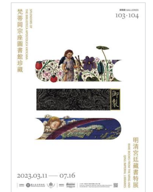
展示会のパンフレット