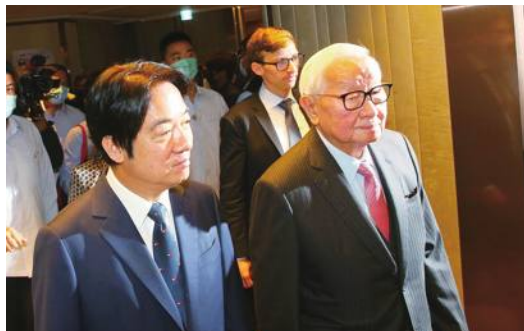
張忠謀氏と賴清徳副総統

ミラー氏に対しては、戦争が起こらないと仮定した場合の5年後や10年後の半導体サプライチェーンの見通しを質問。ミラー氏は「明らかに、サプライチェーンは二極