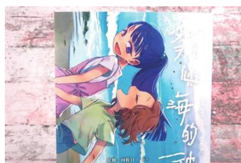
台湾漫画家・星期一回収日さんの作品「ネコと海の彼方」