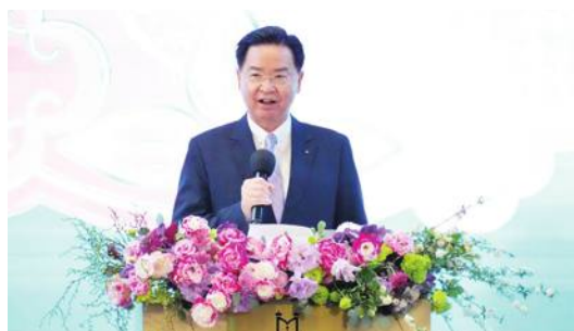
呉部長はインタビューで民主国家の団結を呼びかけている

台湾外交部の呉釗燮部長は3月2日、ベルギーの公用語の一つ「フラマン語」を使用するベルギー公共放送局「VRT」から「恐れではなく怒り:地政学のおもちゃになることを望まない台湾」をテーマにしたインタビューを受け、その内容が同日14日に放送された。