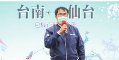
黄市長がチャーター便の記者会見に出席

結んだ。黄偉哲台南市長は「今回のチャーター便の運航が台湾の旅客にとって便利だけでなく、日本の旅客を台南に引きつけるきっかけにもなるよう」と期待を寄せた。なお、台湾は4月1日から5日まで清明節などを含む5連休となっている。