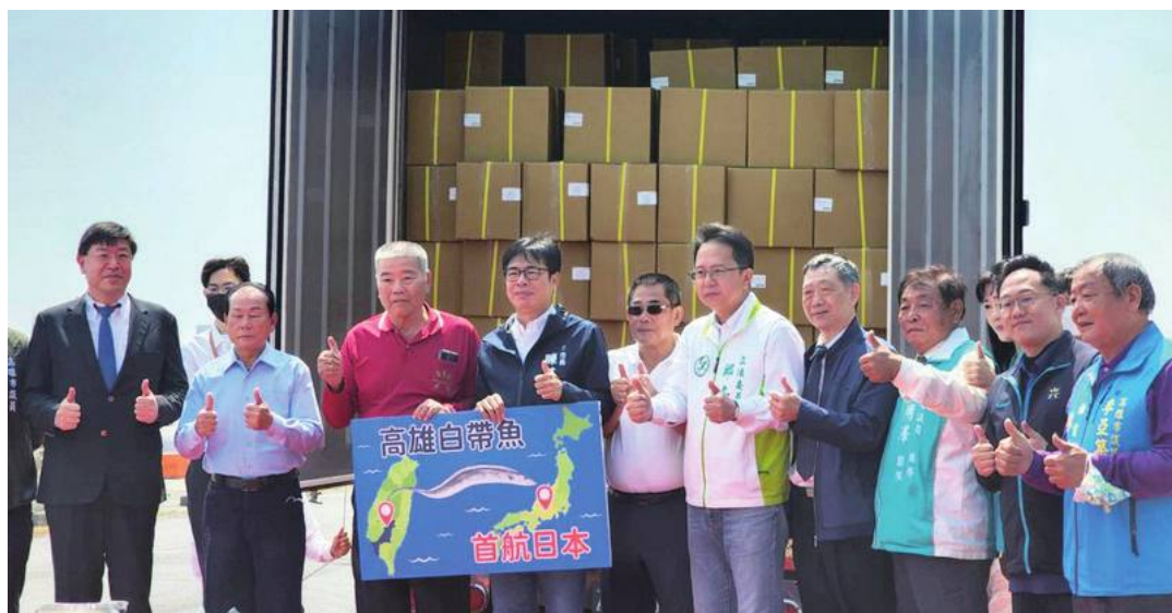
高雄産タチウオ7トン、日本に出荷

高雄市の陳其邁市長は3月15日、興達漁港漁業協同組合で行われた日本向け輸出コンテナ積み込み記者会見に出席し「台湾で獲れたタチウオ7トンが日本のスーパーマーケットとネット通販で販売される」と発表した。