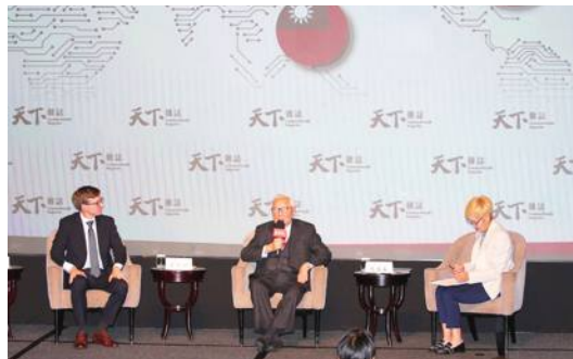
張忠謀氏、中国の半導体産業について語る

張氏は米中の半導体を巡る攻防を描いた「CHIP WAR」の著者、米タフツ大のクリス・ミラー准教授とも対談し、世界の覇権争いや半導体産業の発展の行方について