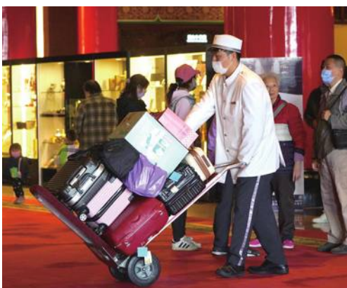
台湾、海外観光客向けのキャンペーンを実施

で先月開かれた『台湾ランタンフェスティバル』によって多くの外国人観光客が訪台したほか、新型コロナウイルス下で各市場で行った施策も成果を上げている」と説明。今年の訪台客600万人の目標達成に自信を示した。