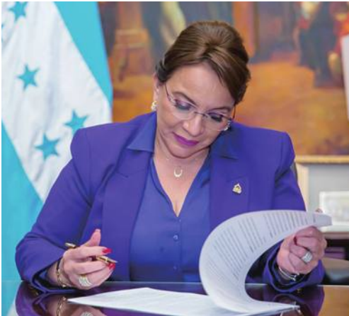
外交政策の舵を切るカストロ大統領

中国は3月26日、中米ホンジュラスと国交を樹立した。これを前にホンジュラスは3月25日、声明で「台湾は中国の不可侵な領土の一部」と表明し台湾と断交した。これにより台湾が外交関係を維持する国は13カ国となった。中国の秦剛外相とホンジュラスのレイナ