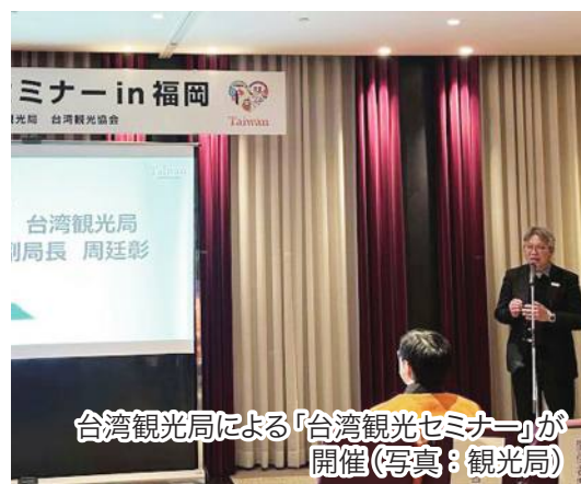
台湾観光局による「台湾観光セミナー」が開催

域向けに、アフターコロナ時代を迎えるに当たり、初めての観光推進イベントを開催したことを報道資料で明らかにした。