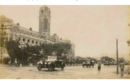
日本時代「台湾行啓」の貴重写真

会」、「台湾特殊人文」、「教育」、「文化思想」の角度から行啓の様子を紹介しているという。式典への出席や、台湾では重要とされた樟腦や砂糖の工場を視察する昭和天皇の姿、台湾らしいドラゴンボートや山車の披露された様子や行啓を一目見ようと道端に多くの市民が集まる光景などの写真が解説文と共に掲載されている。