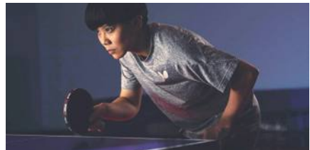
鄭怡静がTリーグの後期 MVP に

復帰を果たした。後期 MVP は2月28日に発表された。Tリーグによると、チェンはシングルスでリーグトップの11勝を挙げた。「勝敗を決するピクチャーマッチでも4戦3勝と、チーム初となるプレーオフ進出の大きな原動力となった」と選考理由を説明している。