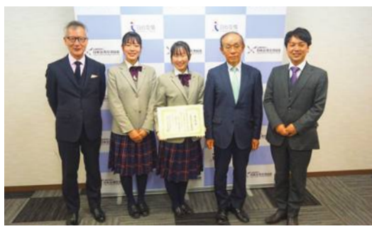
在雙十國慶大放異彩的京都府高松吹奏部也獲肯定