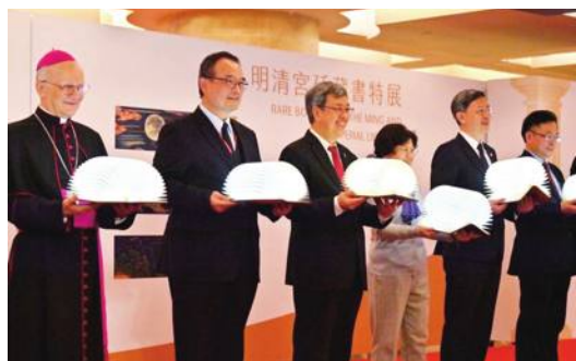
開幕式の記念写真

期に発展した。質量ともに非常に豊かなコレクションを持ち、今回の特別展では互いにその輝きを引き立てることになる。 オープニング・セレモニーでは、パチカン図書館とパチカン文書館の総館長を務めるアンジェロ・ピンチェンツォ・ツァーニ大司教も挨拶を述べ「この特別展の開催は数年前からパチカンと台湾が開始した対話と交流、文化交流の一つの成果だ」と喜んだ。