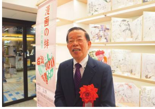
台湾漫画家の作品と合影した謝長廷駐日代表