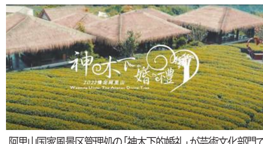
阿里山国家風景区管理処の「神木下の婚礼」が芸術文化部門でゴールデン・スター賞を受賞

台湾交通部観光局は、北海岸及観音山国家風景区管理処、阿里山国家風景区管理処、雲嘉南滨海国家風景区管理処が制作した観光動画3作品をドイツ・ベルリンで開かれた観光映像祭「ザ・ゴールデンシティ・ゲート」に出品し、受賞した。