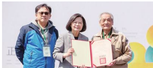
被害者の名誉回復の証書を手渡した蔡総統

開たばこ売りの取り締まりに端を発し、のちに台湾全土に広がっていった政治反抗運動「228事件」が今年で76年経った。政府主催の記念式典「二二八事件76周年中樞記念式典」は、初めて台南での開催となった。 蔡英文総統をはじめ、陳建仁行政院長、游錫堃立法院長、文化部の史哲部長、内政部の林右昌部長、台南市の黄偉哲市長、そ