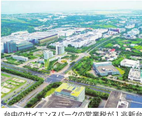
台中のサイエンスパークの営業額が1兆新台湾ドルを突破

台湾の国家科学と技術委員会は3月13日、2022年の台湾の3つのサイエンスパーク(科学園区)の営業額について「過去最多の4兆2664億新台湾ドル(約18.6兆日本円)に達した」と発表した。