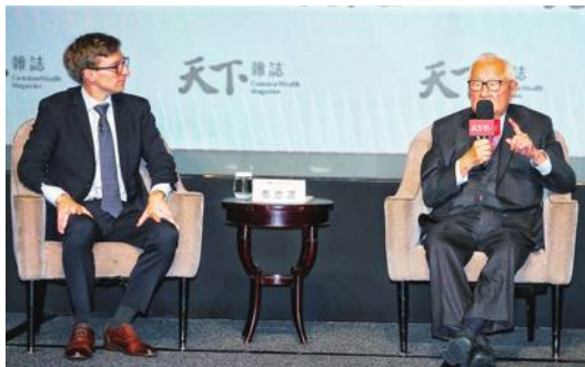
TSMC 創業者張忠謀氏が演説

半導体受託製造世界最大手「台湾積体電路製造(TSMC)」の創業者、張忠謀氏は3月16日、台湾の経済誌「天下雜誌」が主催するイベントで「中国の半導体技術は台湾よりも5、6年遅れている」と答えた。米国が中国に対して新たな輸出規制を実施したことについては「特に意見はない。むしろこのような方向性を支持していると言える」とした。