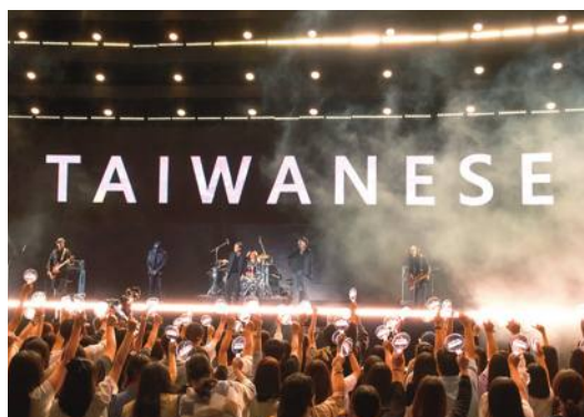
2023 總統府音楽会、高雄市で開催