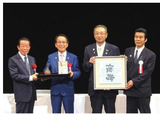
高雄市と佐渡市が友好交流協定を締結