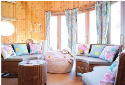
充滿凱蒂貓裝飾的特色小木屋

在「HELLO KITTY SMILE」主題樂園，不僅可以和穿著龍宮殿公主(乙姬)造型的HELLO KITTY一同拍照留念，還引進最新視覺科技如光雕秀(Projection Mapping)及規劃不同類型的凱蒂貓主題餐廳。光是看