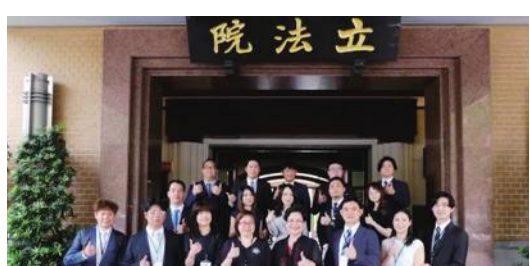
訪團中午到訪立法院合影