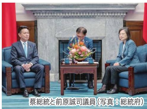
蔡総統と前原誠司議員

蔡総統は挨拶で「野党議員団の訪問は台湾に対する日本の超党派国会議員の支持を示すものだ。心から感謝する」と表した。さらに「自然災害の時の日台の相互支援や、先進7カ国首脳声明で3年連続『台湾海峡の平和と安定の重要性』を明記して下さった。また今年の訪日台湾人がすでに100万人を超えた」と話し、日台の絆を強調した。