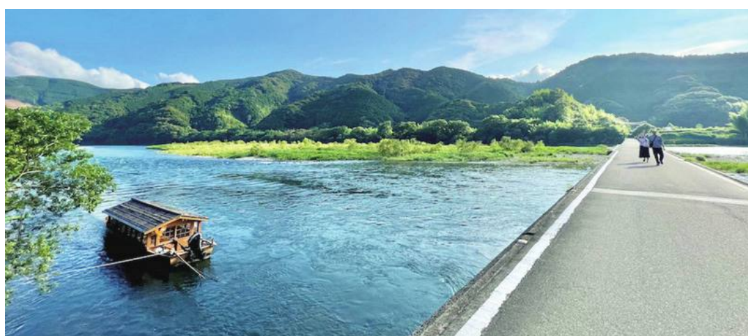
今年の訪日人数、台湾が2位

新型コロナウイルスの水際対策緩和を受け、台湾で海外旅行への関心が高まっている。日本観光局の統計資料によると、2023年1～5月における台湾の訪日人数は138万で、韓国に次いで2位になった。航空会社や旅行・宿泊業者はこれに着目し、双方が連携した訪日旅行プランの販売に注力する動きが出ている。