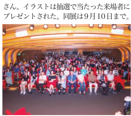
伊藤潤二さん、台湾でファンミ

漫画家の伊藤潤二さんの作品の世界観を再現した展覧会「伊藤潤二恐怖体験展2」がこのほど台北市内で開幕し、伊藤さんはこれに合わせて約8年ぶりに台湾を訪れた。会場ではこの日、伊藤さんのファンミーティングが開催され、200人が集まった。会場にはキャラクターをコスプレしたファンも見られた。台湾メディアによると、ファンミーティングの前売り券は販売開始からわずか5分で売り切れたという。ファンミーティングで台湾の超高層ビル「台北101」を背景にした人気キャラクター「富江」のイラストを描き上げた伊藤