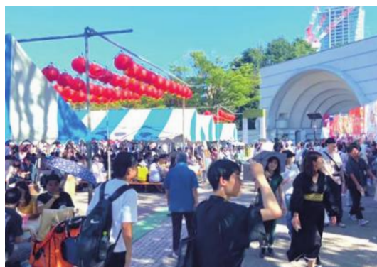
代代木台灣 FESTA 登場

【東京／採訪報導】代代木台灣FESTA於7月28日起至7月30日止在代代木公園登場，雖然正值炎熱夏天，但仍然有很多日本民眾到場體驗台灣美食和文化，今年以享受台灣為主題，希望能從早到晚，讓日本民眾在台灣FESTA體驗一天滿滿的台灣。