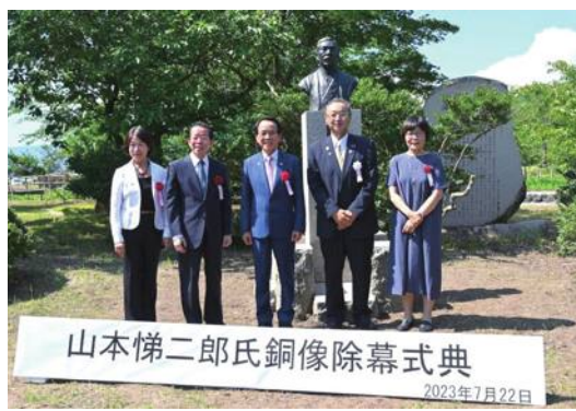
山本悌二郎銅像の除幕式は22日、佐渡市で開催