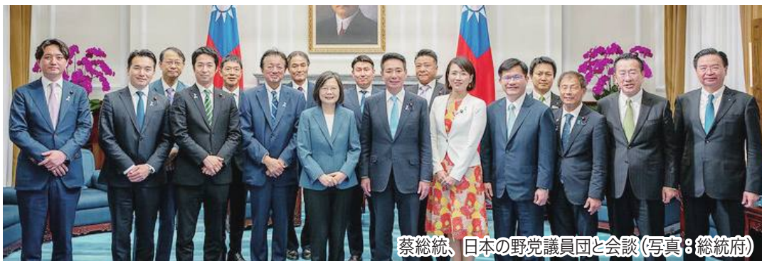
蔡英文総統、日本の野党議員団と会談

立憲民主党、日本維新の会、国民民主党の議員ら合わせ12人がこのほど、台湾を訪れ、蔡英文総統を表敬した。台湾総統府で7月3日の午後、訪問団らは蔡英文総統と会談した。蔡総統は「台湾には世界の経済発展促進に貢献する能力も意思もある」と述べ、環太平洋経済連携協定(TPP)への台湾の加入実現に向けた協力を議員団に求めた。