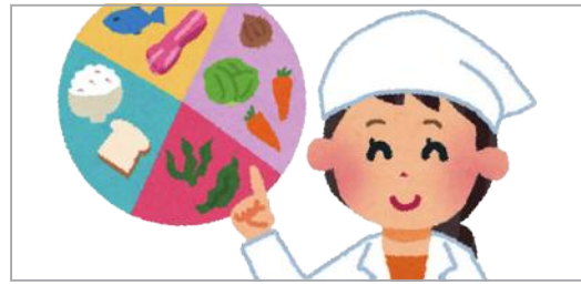
月子餐は専門の管理栄養士が計画したメニュー