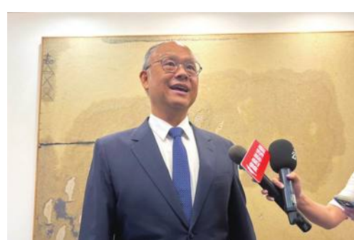
鄧振中政務委員、台湾のTPP加入に自信

台湾の通商交渉トップ、鄧振中行政院政務委員(無任所大臣)は7月25日のラジオ番組で「台湾の環太平洋経済連携協定(TPP)加入を支持する国際社会の力は強く、可能性は大きい」と自信を見せた。一方で「中国に先を越えられれば可能性はなくなる。中国の前に加入を成し遂げる必要がある」と述べた。