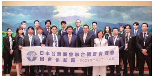
日總青商會組團返國拜會總統府，由總統府秘書長林佳龍接見