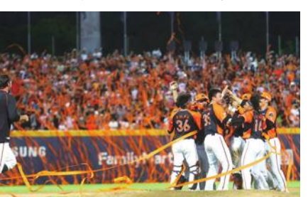
台日の「ライオンズ」がコラボ

ア「Uni-girls」が西武の「レオ」、「ライナ」、「bluelegends」と共演する。両チームは2016年、友好イベントを初めて行い、今年は新型コロナウイルスの感染状況の落ち着きを受け、交流再開を決めた。