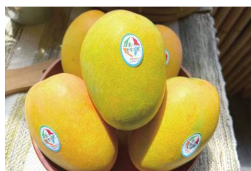
台湾産マンゴーは日本の学校給食に

台湾行政院農業委員会農糧署はこのほど、台湾産アップルマンゴーを茨城県笠間市内6つの学校で給食として提供すると発表。生産履歴の認証を得た台湾産アップルマンゴーを市内の6つの学校に7月13日、提供した。約2200人の生徒が新鮮なマンゴーを味わい、台北駐日経済文化代表処の職員も笠間市立友部中学校を訪れ、生徒たちと一緒に給食を楽しんだ。