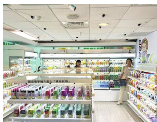
台湾セブンイレブン、全国初の無人店舗へ

「X-STORE」の店舗としては最も狭い。店内では300種類以上の商品を取り扱う。同社は「すでに延べ2千人以上が利用しており再来店率も高い。今後は従来型の店舗が出店できない商業ビルや学校などへの進出させる見込み」と説明した。