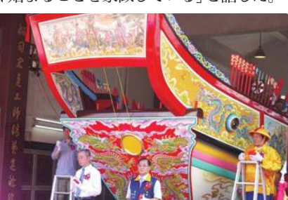
屏東県東隆宮で王船の開眼式