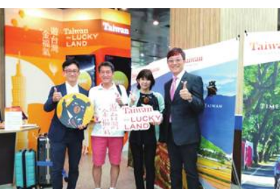
今年300万人目の訪台客となった日本人女性