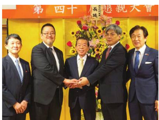
駐日代表謝長廷也特別見證聯合青年部交接卸任了

有許多回憶都不斷湧現出來，但接下來會有新的也會活動，不論是謝大使的演講或是與台商會青商交流會等可以嘗試看看，期待今後新垣部長帶領大家舉辦青年部風格的活動，最後也感謝這六年間大家的支持。