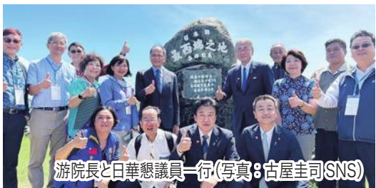
游院長と日華懇議員一行