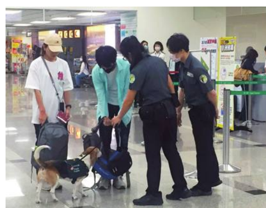
台湾基隆港のターミナルで検疫検査が強化

同委動物防疫検疫局によると、今後1年間豚熱の発生がなかった場合、WOAHに洗浄地域の認定申請をするという。早ければ25年にも認められる見通しで、アジアで唯一、三大家畜伝染病である口蹄疫、アフリカ豚熱(ASF)、豚熱を撲滅または阻止した国になる公算が強い。また、豚熱の撲滅により養豚場の作業員及びワクチン購入費が削減され、ワクチン接種の副作用などによる損失も減少する見込みで、効果的に養豚コストを抑えられる。さらに、豚肉製品などの国際競争力も大幅に向上さ