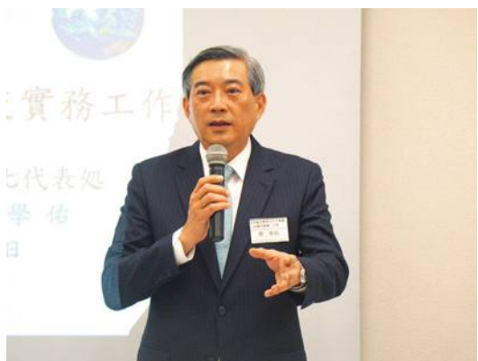
周學佑副代表致詞

【東京／採訪報導】台灣科學技術協會於7月1日舉行「2023年度夏季演講會·會員大會」，並同步以線上會議的方式進行，這次演講邀請到駐日副代表周學佑、國立台南大學黃銘志教授、株式會社日匠機販 DX担当林郁智針對不同主題進行演講，同時也進行了第34屆中日工程技術研討會的籌備會議。