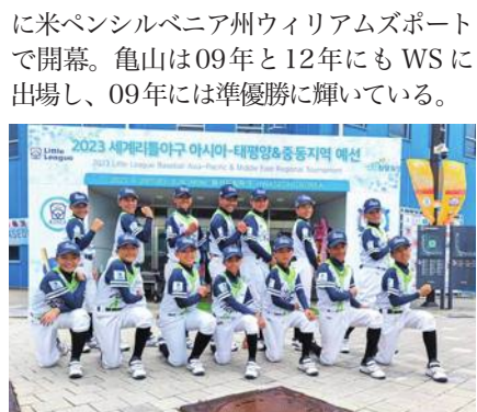
リトルリーグ野球のワールドシリーズ出場が決まった台湾代表

リトルリーグ野球の台湾代表の亀山(桃園市)はこの日、ルール違反で優勝が抹消された韓国代表の代わりに、ワールドシリーズに進出することになった。6月20〜26日に韓国華城市で開催されたリトルリーグ野球のアジア太平洋選手権で、台湾代表は決勝で韓国代表の南ソウルAに1-2で負けた。試合後に、試合中に相手チームの選手リストに問題があることに気づきリトルリーグ国際本部に抗議。国際本部は「出場資格のない南ソウルBの2大会出場したことを確認して韓国の優勝を抹消した」と発表した。ワールドシリーズは8月16日