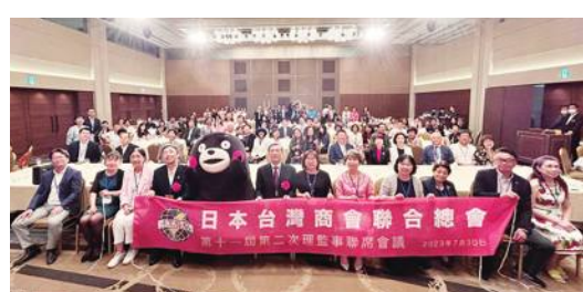
日總舉行第11屆第2次理監事聯席會議