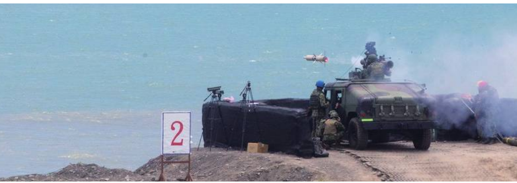
頼副総統は台湾国防能力の強化を支持

また米国国務院は台湾メディアの取材要請に対し「報道は事実ではない。米国は生物兵器禁止条約の規定を従っている」と答え、報道の内容を力強く批判した。