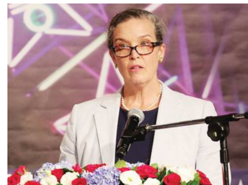
AIT「報道の内容は事実ではない」

台湾政府は7月11日、米国が台湾に対し、生物兵器を開発するよう圧力をかけたとの報道について「いかなる生物兵器の開発、製造計画もなく、ありえない」と報道を力強く否定した。 台湾大手の新聞報道に政府が批判 台湾の大手新聞紙は同9日付で消息筋の話として「米国が台湾国防予防医学研究所に対し、秘密裏にウイルス開発能力を構築し、生物兵器を開発するため、致死率が高い病原体を扱える『バイオセーフティーレベル(BSL)4』の新型施設の建設を求めている」と報じた。