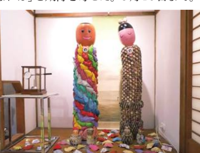
雲林県でこけし展示会

り体験メニューも用意されている。林さんは「子どもたちの美的センスを磨く機会になれば」と期待を寄せた。9月10日まで。