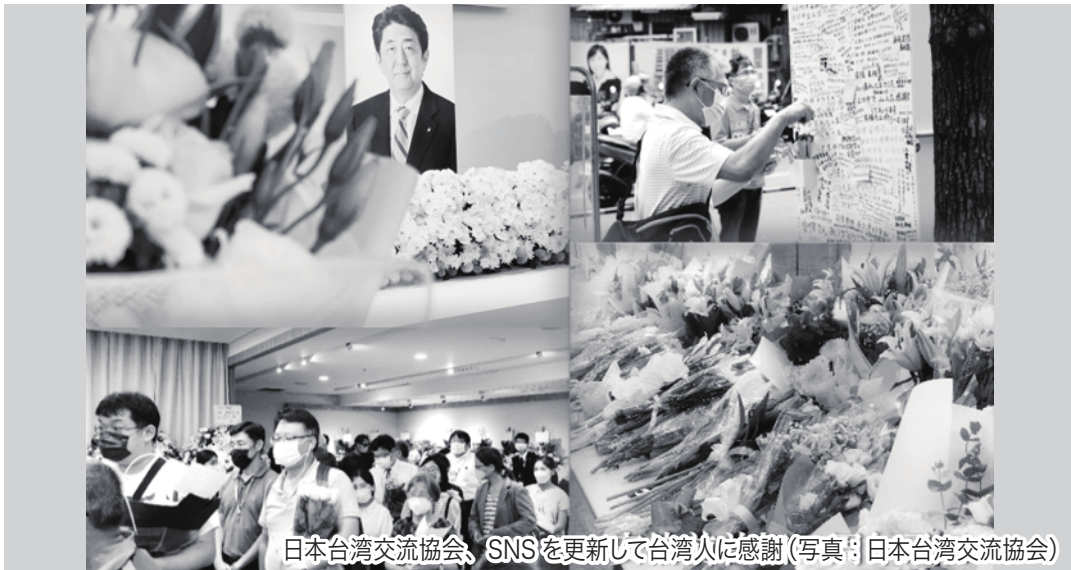
日本台湾交流協会、SNSを更新して台湾人に感謝

蔡英文総統は安倍晋三元首相の一周忌を迎えた7月8日にSNSを更新し「台湾有事はすなわち日本有事」と言明していた安倍元首相を「台湾の人々が最も懐かしさと親しみを感じる日本の首相です」とした上で「台湾のために多大な貢献をされ、私は改めて感謝申し上げます」とつづった。