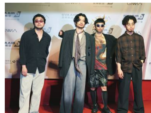
King Gnu、金曲獎で台湾初ステージ