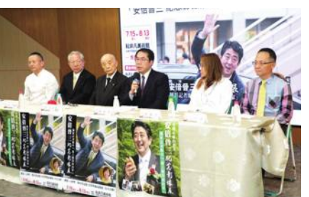
安倍晋三元首相の記念写真展が台南に

なども展示された。同市の黄偉哲市長は記者会見で「ぜひ多くの人に参観してほしい。一貫して台湾を支持してくれた日本の友人と一緒に懐かしもう」と呼びかけた。