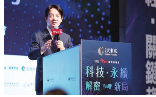
頼副総統、米紙ポストに寄稿

台湾の頼清徳副総統はこのほど、米紙ワシントン・ポストに寄稿し、平和の実現に向けて自分の4つの主張を発表した。 頼副総統は寄稿文の冒頭、自身の政治投身へのきっかけを言及した。「1996年までは台湾成功大学附属病院に勤務していました。同年に実施された台湾史上初の国民