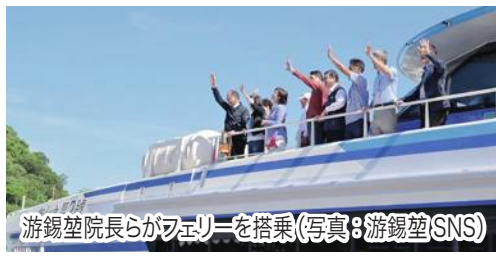
游錫堃院長らフェリーを搭乗

一方、日本超党派議員連盟「日華議員懇談会」代表団8人は同日朝、那覇経由で与那国島に到着。団長を務める古屋会長は SNS に「双方で現地にて110キロしか離れて