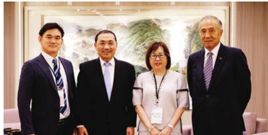
訪團團拜會新北市長侯友宜

【臺北／採訪報導】日本台灣商會聯合總會青商會返國致敬團，18日馬不停蹄的拜訪總統府、雙北市府，與總統府秘書長林佳龍、臺北市長蔣萬安、新北市長侯友宜會面，晚上則在臺北市內餐廳與柯文哲餐敘，雖然行程滿檔，但充實的行程也讓成員好滿足，訪問之旅順利畫下句點。