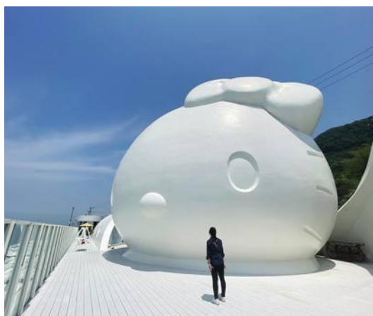
巨大凱蒂貓造型雕像

【淡路島／採訪報導】近年來日本的城鄉差距和都市集中化越來越鮮明，「地方創生」成了各鄉鎮自治體最關注的課題。記者特別走訪了兵庫縣淡路島的熱門景點「HELLO KITTY SMILE」，一個足以讓全世界的凱蒂貓粉絲尖叫及流連忘返的主題樂園，了解淡路島如何從一個地處偏遠的農業小島，透過「地方創生」蛻變成新的觀光樂園。