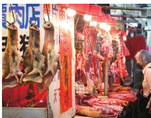
ワクチン接種停止で養豚のコストダウンを予期

台湾行政院農業委員会はこのほど、台湾で飼育される豚への家畜伝染病「豚熱(CSF)」のワクチン接種を7月1日から全面的に停止すると発表した。2024年6月以降、国際獣疫事務局(WOAH)に対し、豚熱の発生がないことを示す「洗浄地域」の認定申請に向けて準備が始まっている。