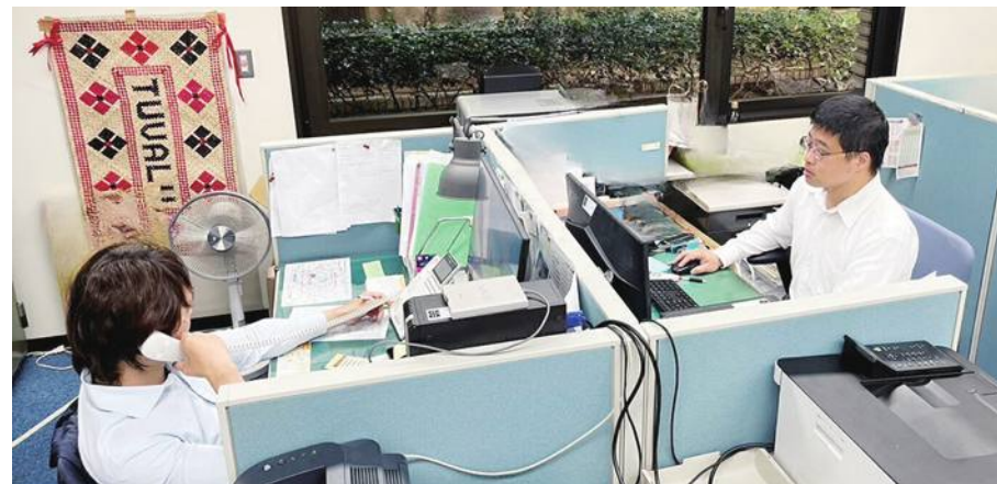
代表處領務組告訴大家海外旅遊小撇步

急難救助及在日生活資訊專區 https://www.roc-taiwan.org/jp/post/331.html