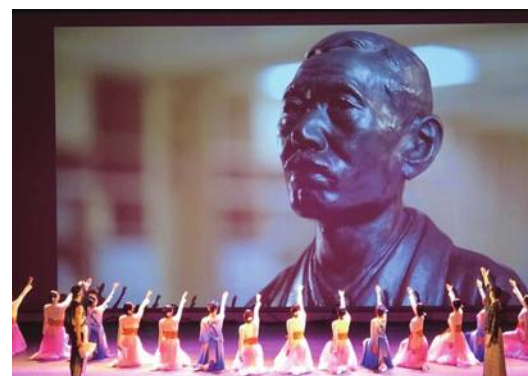
佐渡市で記念公演が開催

新潟県佐渡市で7月22日、日本統治時代の実業家山本悌二郎氏の銅像のレプリカが台湾から寄贈されることを記念した「日台交流イベント」が開催された。同時に山本氏が発展に貢献した台湾高雄市と佐渡市間の「友好交流協定」も締結された。 山本氏の銅像は、日本統治時代の台湾芸術家黄土水氏による作品で、元々高雄市の橋頭橋に設置されていた。戦後は撤去され1959年に山本の故郷である佐渡市の真野公園に設置され今日に至る。 この銅像は数年前、黄土水の作品を研究