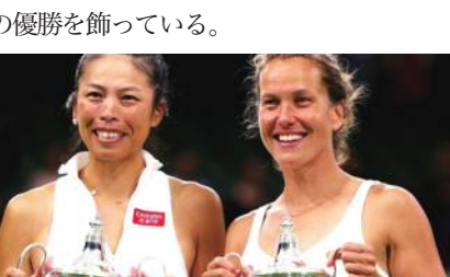
謝淑薇選手がウィンブルドン優勝、四大大会通算6勝目

テニス、ウィンブルドン選手権はこの日、女子ダブルス決勝が行われ、謝淑薇(台湾)/バーバラ・ストリコバ(チェコ)組は大会第3シードのストーム・ハンター(オーストラリア)/エリーゼ・メルテンス(ベルギー)組を7-5、6-4で下し、優勝を飾った。37歳の謝は、2013年に中国の彭帥と、2019年にストリコバと、2021年にはメルテンスとのペアでタイトル奪取。また全仏オープンでは2014年に彭と、今年の大大会では王欣瑜(中国)とコンビを組み、2度