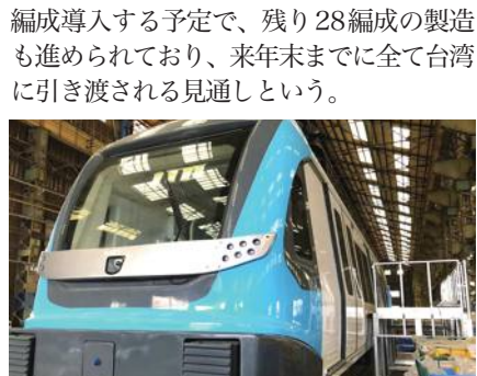
新北メトロ三鶯線の車両、第1陣が8月末にも日本から到着

新北市で建設が進む新北メトロ(MRT)三鶯線の車両の第1陣となる1編成2両が8月末にも日本から台湾に到着する。同市政府捷運工程局がこのほど明らかにした。台北メトロ板南線頂埔駅(土城區)と鶯桃福徳(鶯歌區)間の約14キロを結ぶ同線は、日立製作所などが鉄道システムの建設を手掛ける。2025年の完成を目指す。6月末時点の工事進捗率は70.09%。2両1編成で50人分の座席が設置され、定員は約330人。車体には同線が走る三峽や鶯歌エリアの青空や山林、河川をイメージした明るいブルーがあしらわれた。同線では29