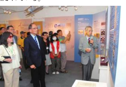
日本統治時代「治安警察法違反事件」特別展

件から100年の節目を迎えることを記念して実施するもの。来年2月29日まで開催されている。