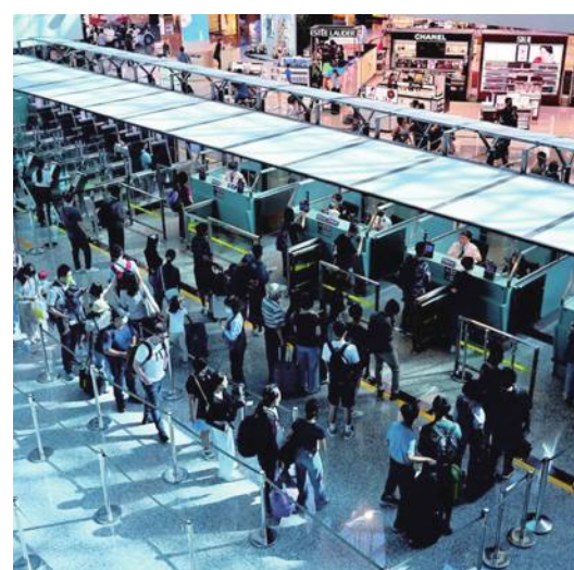
台湾、海外旅行への関心が高まっている

大手旅行会社 東北地方と北海道の旅行プランに注力 一方、台湾の大手旅行会社ライオントラベル傘下の旅天下は、タイガーエア台湾と