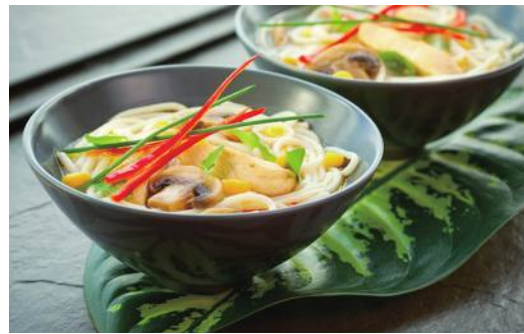
坐月子で一番重要なのは飲食管理