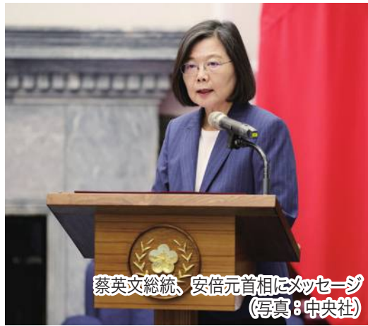
蔡英文総統、安倍元首相にメッセージ

基礎を築くことに一生をかけ、台湾の環太平洋経済連携協定(TPP)加入や世界保健機関(WHO)など国際機関への参加に身をていして支持してくれた。終始台湾と共にあり、台湾人に感謝の意を抱かせた」とコメントした。