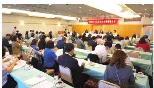
2023年日本東京地區僑務座談會舉行

【東京／採訪報導】2023年日本東京地區僑務座談會於7月6日舉行，這次的會議規模也恢復到疫情前，共有100位僑務榮譽職等僑胞參加，不少人都踴躍分享意見和想法，交由僑務委員帶回傳達給政府，駐日代表謝長廷和副代表周學佑都出席與僑胞交流互動。