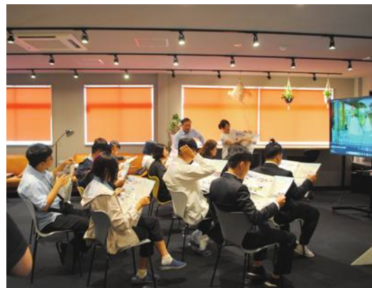
同市の文化観光協会に見学