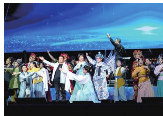
台湾を代表するパフォーマンスが次々と登場

台湾總統府と中華文化總會が共同主催する「2023 總統府音楽会- 跨海音」が7月8日、高雄市の高雄流行音楽センターで開催された。蔡英文總統も出席し、集まった人々と一緒に台湾の多様性を象徴する幅広い世代、スタイル、ジャンルの音楽を楽しんだ。 今年の總統府音楽会は、初めて一般市民向けに整理券を配布したほか、高雄流行音楽センターの屋外スペースに設置した大型スクリーンでも同時中継され、2000人以上が集まった。テレビ、ラジ