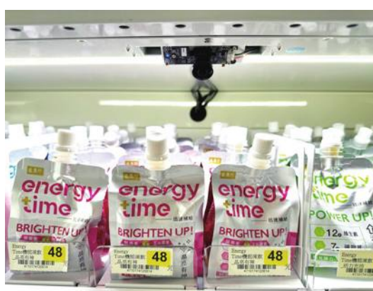
「AIoT」対応のセンサーでスマートショッピング体験

台湾セブンイレブンはこのほど、公的研究機関、工業技術研究院(台湾新竹県)と手を組み、全国で初めて母店に隣接しない24時間営業の無人店舗「X-STORE 7」をオープンさせた。これで「X-STORE」の名称が冠される省力化を図った同社の店舗は台湾内で7店となった。今後は年に1店舗のペースで出店する計画という。