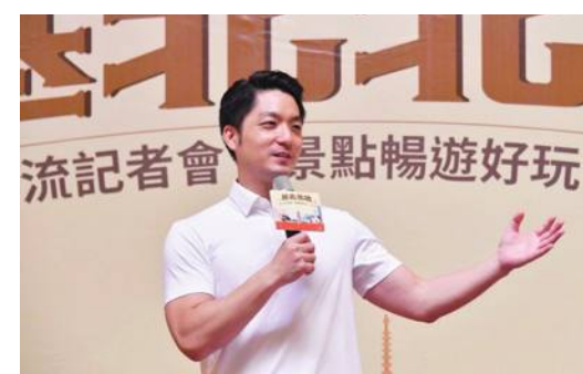
蔣萬安市長

「台北ファンパス」は二日周遊券(650NTD)、三日周遊券(850NTD)、四日周遊券(1050NTD)がある。交通系ICカードの機能が付与されており、チャージして使うことができるほか、カードを提示することで指定の観光スポットで割引が受