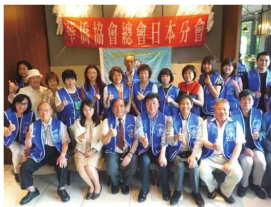
理監事會紀念合影

【東京/採訪報導】華僑協會總會日本分會於7月9日舉行第三屆第二次理監事會，因為即將邁入第四屆，這次會議討論重點在於如何讓僑胞更認識僑協日本分會，對此理監事們紛紛提出意見，希望能吸引更多僑胞加入僑協日本分會。