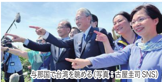
与那国で台湾を眺める

台湾の游錫堃立法院長は7月4日、宜蘭県蘇澳港からフェリーで沖繩県と那国島を日帰り訪問した。台湾交通部観光局の張錫聰局長や宜蘭県林姿妙県長、観光・医療関係者ら約100人が同行した。