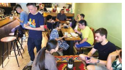
2023年度外国人住みやすい国・地域調査、台湾が5位

高いと分析。台湾では雇用の保障があり、台湾自体の経済も強く、給与も公平だとした。一方、ランキングで最下位の53位はクウェート。日本は44位だった。