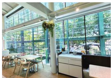
寿山動物園 おりを再利用してカフェに

台湾高雄市の寿山動物園内にこの日、新たなカフェがオープンした。オーナメントのおりを再利用したもので、巨大なおりの中にカフェの建物が入り込んでいる。カフェのガラス張りの大きな窓からは防護網を通じてしか外を見ることができない設計になっており、座席で飲食する客は、おりの中にある動物たちの視点を体験することができる。動物福祉の向上を目指すプロジェクト「動物園運動」を推進する同園。カフェの開業式典に出席した陳其通市長は「視点の転換によって動物の気持ちになり、動物愛護の意識を持ってもらえれば」と語った。