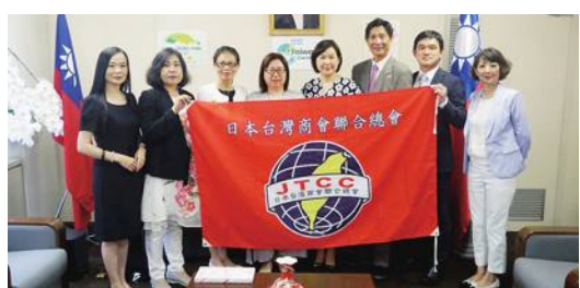
日總拜會橫濱辦事處