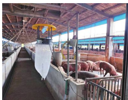
台湾、豚熱洗浄地域申請に向け準備へ

同委は日本統治時代から続く豚熱撲滅のため、21年から対策を実施。全面的なワクチン接種のほか、リスク管理などに取り組んでいた。今年前半には種豚を除いてワクチン接種を取りやめたところ、豚熱の発生がなかったため、専門家チームによる