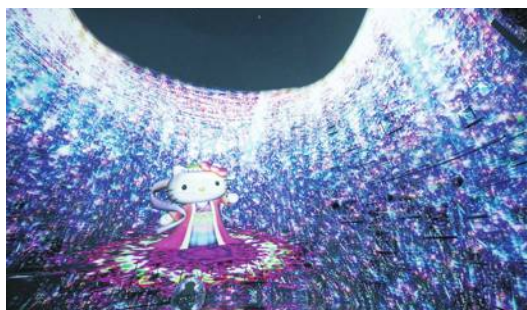
精彩的海底世界光雕秀