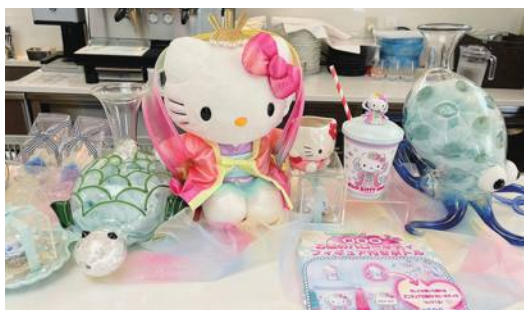
各個角落的 Hello Kitty 裝飾都令人愛不釋手

到每個餐廳中令人愛不釋手的凱蒂貓餐具，和可愛造型菜單，就令人愛不釋手。另外園內還有手工坊，可以親子體驗陶器和馬克杯的製作。整個園區面向淡路島的無敵海景，令人心曠神怡。