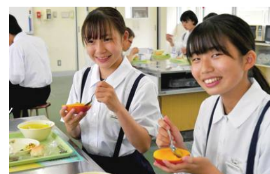
台湾産マンゴーを楽しむ中学生

同署は、2019年7月24日に笠間市と『食を通じた文化交流と発展的な連携強化に関する覚書』を締結し、食農教育として農業及び文化交流を展開している。笠間市はこれまで、台湾から購入したバナナやパイナップルを学校給食のデザートとして提供した経緯がある。