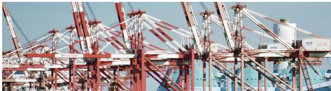
副総統、台湾の経済安全の確保を主張

台湾の頼清徳副総統はこのほど、米紙ワシントン・ポストに寄稿し、平和の実現に向けて自分の4つの主張を発表した。 頼副総統は寄稿文の冒頭、自身の政治投身へのきっかけを言及した。「1996年までは台湾成功大学附属病院に勤務していました。同年に実施された台湾史上初の国民