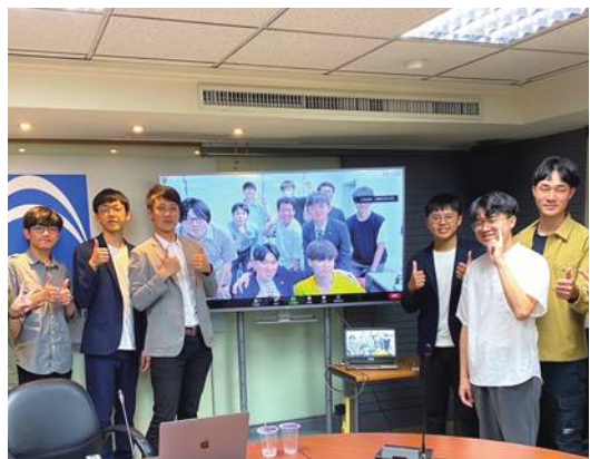
雙方越洋連線進行交流會議

【大阪/採訪報導】中國國民黨青年團(7)月1日,與日本立憲民主黨青年團「リッけんユース(Rikken Youth)」進行線上交流會,雙方針對青年參政、區域穩定,