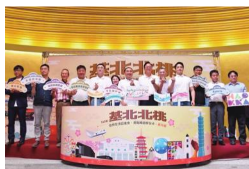
記念写真

台湾台北都市圏(台北市、新北市、基隆市)を対象とした観光スポット周遊カード「台北ファンパス(台北基好玩)」に、桃園市が初めて加わるようになった。中国語の名称を「臺北北桃景點暢遊好玩卡」に変更し、8月1日から発売する。台北市の蔣萬安市長、新北市の侯友宜市長、基隆市の謝國樑市長、桃園市の張善政市長(いずれも国民党所属)が7月20日、桃園市内で合同記者会見を開いて発表した。