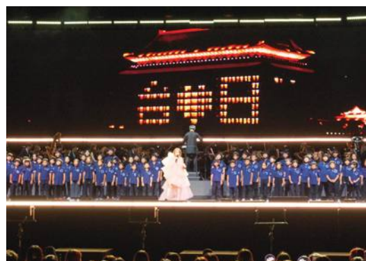
日台友好を象徴する一青窈さんのパフォーマンス