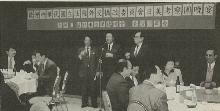
座談會の後の懇親会で乾杯の音頭