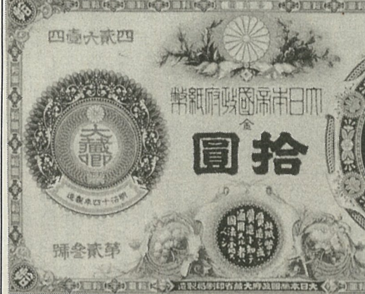
日本紙幣の中でも名図案と言われる神功皇后10円、明治16年発行～明治32年廃止

その後日本政府が発行した紙幣の総称を「近代紙幣類」と言いますが、昭和18年以前のもものは、兌換紙幣といひ、紙幣の表に「この券と引き換えに金貨と交換する」と書かれています。紙幣の裏付けに、金(キン)があった訳です。有名な二クソシヨックは、USドル紙幣の裏付けになるべき金(キン)が、その後交換しないと言表されたために世界の人々が大きな