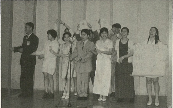
台湾の大学生たち

日本中華聯合總會 留日東京華僑總會 聯合主辦 留日台灣同鄉會 邀請中華民國名優的大學生，大部份是大學研習日在大學裡專攻日文的學生。今年第十八屆已有三百名以上的學生參加過訪日研習團，這是亞航當作文化國際經驗、考察的一部份，培養下一代，給他們有機會來日本見習體驗到各種交流、習俗及到民間家庭去學得非常有意思的，亞航對留日學生的傳，使我國青年一向的照顧，值得我們敬佩。 他們七月九日由台北搭他學生間的，達日本，亞航有安排十天的充實研習日程，在這短短的訪日中，七月十一日下午六時按照往例，僑界三團體於涉谷「中華料理陶陶」舉行