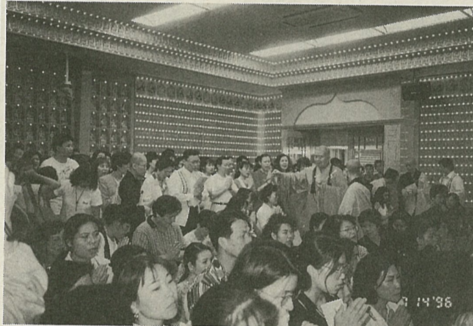
皈依三寶甘露灌頂典禮

別院一時聚集了七百多人，其中有醫學博士、有公司負責人、大學生等各階層人士，他們引領企盼著星雲大師為他們主持皈依三寶甘露灌頂典禮。典禮中，星雲大師除為他們證明皈依，開示皈依的利益，皈依後應注意的事項外，還一一為每一位皈依者揮灑甘露淨水加持，令去煩惱，消業障。贈送念珠一條保平安，皈依證一份以資證明。皈依證是未來人生的護照，是成為佛教徒的註冊證明，是善神護法的保護對象。更是生命重生的開始。 當天除了舉行皈依三寶典禮外，上午十時三十分還舉行首次的盂蘭供僧活動，由東京佛光山協會主辦。由會員們備辦供養品、飲食等供養法師，表達其護持三寶的心意。而受供養的法師在接受大家的財物供養後，也要以法施(講經說法)回饋。這是佛教的傳統，在日本可說是難以見到了。因此當天觀禮者，除了親見星雲大師能率佛光山諸位法師蒞臨禮供而滿心歡喜外，對莊嚴的儀式更是感動無比。