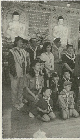
スタートした佛光童子軍 (佛光山東京別院)

佛光山東京別院はボーイスカウト(佛光童子軍)を結成するために準備を進めてきたが、去る六月九日発