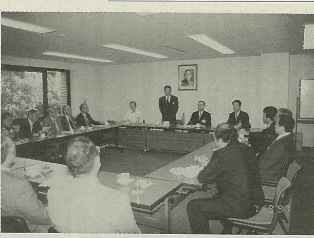
莊代表主催で結団式(在日台湾商工会議所の皆さん)

アジア台商會總會 へ出発前に結団式 出席の在日台湾 商工会議所の役員 の人は、七月十三