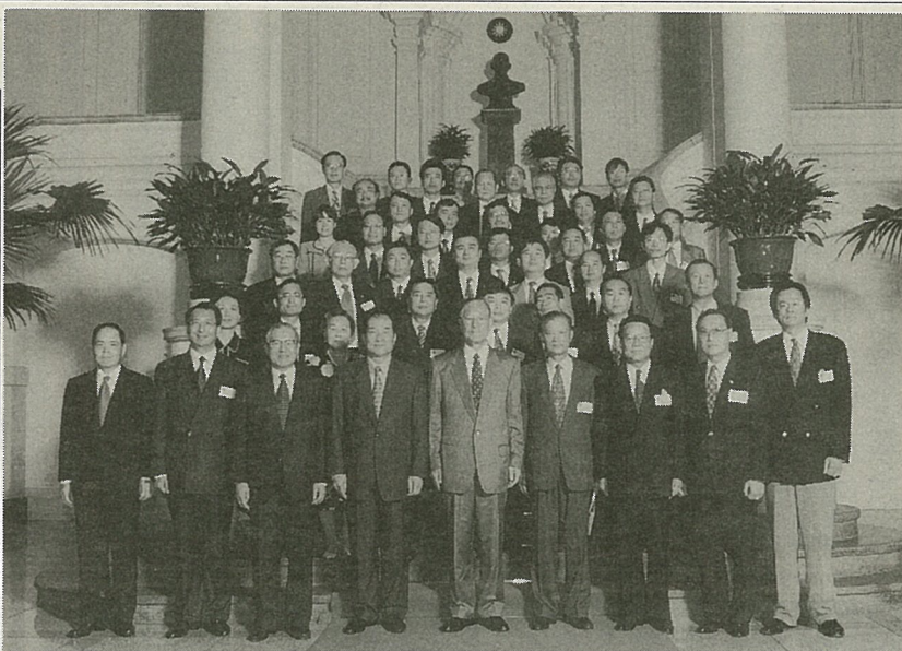
李総統(最前列中央)を中心に記念撮影

その一つは、資金調達ネットワークをなくすことです。ご存じのように各国に台湾の銀行がありますが、そこから融資をしてもうつのほ