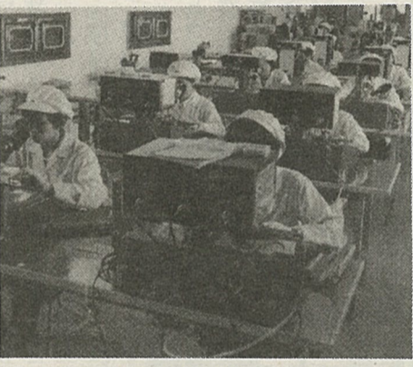
後、安全保障会議を招集し、基本計画を決定、速やかに周辺事態に当たるといふ閣議報告をする。防衛庁長官は閣議決定を定め、部隊活動内容や区域などを定めるに命ずる。

協力のための指針(ガイドライン)の閣議決定と条約改定を決定した。日本周辺有事への対応を定めた周辺事態法案、自衛隊法改正案、日米物品役務相互提供協定(ACSA)改定の三本柱が閣議決定された。周辺事態法案は、周辺事態での自衛隊の活動内容や物資の輸送、燃料補給など米軍への後方地域支援、国連安全保障理事会の決議に基づき船舶検査、米兵らの捜索・救難活動などを打ち出している。政府は同日中に両法案を国会に提出し、ACSA改定については日米両政府間で正式に署名した。ただ社民党が閣議を反対し、与党の亀裂が露呈している。政府は緊急事態の発生