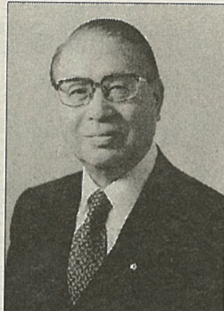
馬紀壯生於民國元年十月十四日，河北南宮人，生前先後受兩位蔣總統提攜，民國七十九年擔任總統府資政。馬紀壯於五月十四日病逝，享壽八十七歲。

總統府資政馬紀壯日前因病於家中去世，享年八十七歲。總統府及中國國民黨中央將協助辦理喪葬。馬紀壯壯年以來因年邁身體不佳曾多次進出三軍總醫院，最近屢次跌倒致病情加重，不幸於五月十四日病逝家中。 馬紀壯一生歷任軍、政要職，並曾奉派出使泰國、日等國，也曾出任中鋼董事長，主持企業經營，經歷輝煌。 馬紀壯歷任海軍總司令、國防部參謀次長、國防部副部長、聯勤總司令、副參謀總長、國防部副部長。六十二年，馬紀壯奉派出使泰國，六十四年出任中鋼董事長，六十七年任行政院秘書長，旋調任總統府秘書長，蔣經國中樞，七十五年奉派出任駐日代表，至七十九年卸任，並獲聘為總統府資政。今期間並於八十年至八十五年擔任亞東關係協會會長。