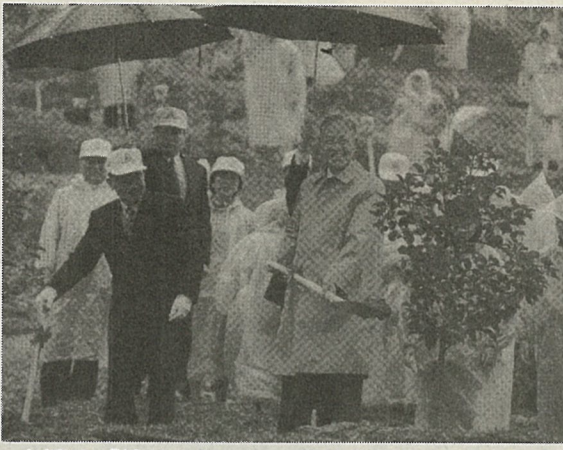
台湾の「植林の日」に、政治大学山林での植林活動に李登輝總統(右)、連戦副總統(左)も参加

専門主婦や定年退職者は全体の四%にすぎなかった。年齢の分布はやはり若者の天下で、三十歳未満が五三%を占め、五十歳以上はずか三%だった。 学歴は、九六%が高卒以上で、そのうち約四割が大卒または大学院卒だった。このほか、性別では、男性五五%、女性四五%となった。 また今回の調査で「インターネット族」は、北部在住が五割以上、南部は二%という極端な結果がでた。