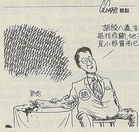
胡說八道，未幾，據我診斷，他不過是小感冒而已……

◎僑務委員會業務電腦化推展現況 僑務委員會於民國七十一年設立「資訊檔案科」，民國七十二年三月改名「資訊科」，負責業務電腦化之規劃、設計與推行，已將各項僑務資訊建立電腦資料庫，供業務單位辦理業務，藉以提高行政效率，加強服務品質。隨著國際網路無遠弗屆的特性及上網人口的快速增加，又僑胞散居全球各地，利用國際網路傳播資訊及建立雙向溝通，乃為最迫切的工作，僑務委員會於是在八十五年八月開始建置本會全球資訊服務網。 整體目標及遠景 ①建立僑務資訊系統，提高行政效率，加強對僑團(胞)之聯繫與服務。②建立辦公室自動化作業環境，推動公文處理現代化工作，以提昇公文處理品質與時效。③建置國際網路服務資訊系統，增進資訊交流與服務。④建置電子郵遞作業環境，提供直接服務僑民與進行雙向溝通。 ①推行辦公室自動化作業，購置四十三部個人電腦供同仁製作公文及文書作業使用，使本會從每四點六八人共用一部個人電腦提升每至二點七人共用一部個人電腦。②推動公文處理現代化及辦公室自動化作業，辦理本會同仁電腦基礎應用訓練班兩期共計六十人參加，成立各處室電腦管理員制度，舉辦電腦管理員講習。③重新設計本會全球資訊服務網站版面，擴充資訊內容，資訊內容分七大類，二十六項子分類，擴大僑務資訊服務範圍。④利用國際網路建立中華語文學習環境，建置本會五字說華語及華語會話有聲教材(含注音符號)上