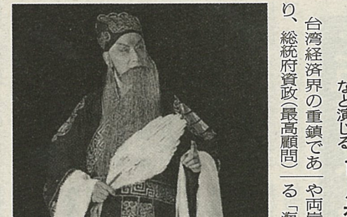
蜀の軍師、諸葛孔明を演じる 幸振甫氏