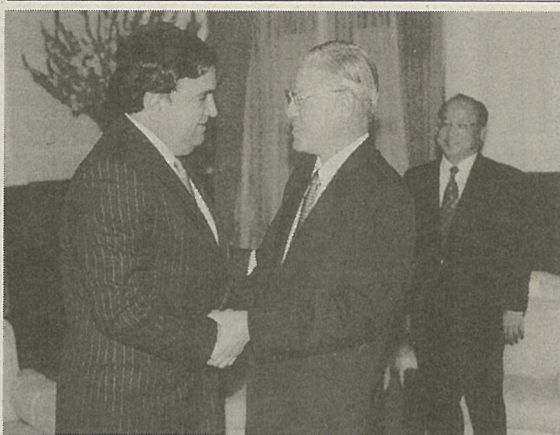
リチャードソン米エネルギー長官(左)が来台、11月10日、総統府で李登輝総統と会見、米政府の対台湾政策不変を改めて示す

ヤードソン長官と会見し、クリントン大統領と米政府が台湾ならびにアジア太平洋地域の平和と安全の維持に努力していることに感謝の意を表明するとともに、両岸問題について「われわれは絶対に入力入れられない」と強調した。