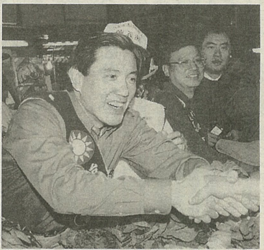
支援者と握手する馬英九氏

の勝利集会で馬氏の名前を連呼する支持者の中で、女性をはじめとする若者の姿が目立った。この光景は今回の選挙を象徴するものであった。 全有権者のうち四十歳未満の占める割合が今回初めて五割を超えた。選挙戦は無党派層の取り込み合戦でもあった。 容姿で陳氏を圧倒する馬陣営は徹底したイメージ作戦を展開。五月の出馬表明後はテレビCMでひたすらジョギングシーンを流し続けて若さと健康美をアピールした。