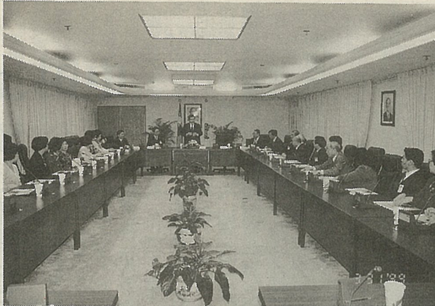
留日台灣同鄉會團員與僑務委員會委員長焦仁和在會談中合影。

留日台灣同鄉會回國致敬團一行二十九人於三月三十一日拜會僑務委員會，委員長焦仁和在接見時，對團員提出在東京設立僑教中心一事，表示絕對支持；他強調僑委會一定會盡力向行政院爭取，期對日本僑胞的服務能更完善。 針對該團團長留日台灣同鄉會會長詹德豐表示，留日同鄉會會長詹德豐表示，爭取僑教中心是希望防堵中