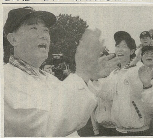
宋楚瑜應以民意為依歸，出馬競選總統，還是以和為貴，接受黨的安排？

五個月前，台北縣三重、蘆洲地區的產業界代表舉行了一場地方性的聯誼聚會。包括模貝廠、五金廠、小型加工廠等產業界約四、五百人參加。當時，總統大選已是熱門話題。會後有人一時興起跳出來高喊：「我們來做調查，看看大家對總統的支持人選是誰？」於是現場又再度熱烈起來。這些中小企業主們平時與政治權力核心並沒有密切往來，也沒有太多政治意識，既然好玩，當場就統統用舉手的方式表達意見。結果現場約有六、七十%的人說支持宋楚瑜，約有二、三十%的人支持陳水扁。在座就有企業老闆起鬨說：「哇！那麼「宋扁配」不就所向無敵了！」