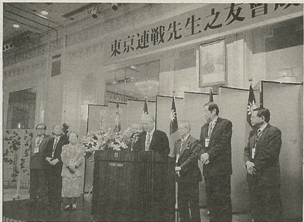
壇上で紹介される「東京連副總統之友会」世話人一同

来年三月の台湾の次期総統選挙で連戦副總統が出馬を予定している。その「東京連副總統之友会」成立大会が四月十七日午後六時、東京・新大久保の海洋会館で約三百名が出席して開かれた。