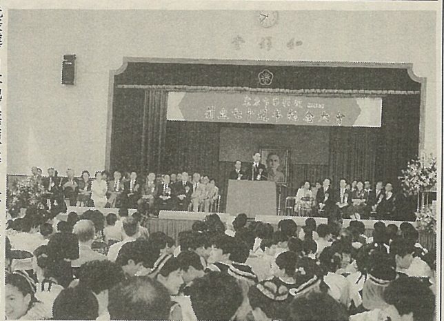
東京中華學校の成立70周年記念大会

力下，已成為全球數千所中文學校中的佼佼者，近年來在薛理事長、郭校長、各位師長、校友齊心協力及代表處莊代表支持下，東京中華學校更是飛躍進步，這份榮耀來之不易，我們除要珍借外，一定要將他繼續發揚光大。僑教是維繫僑社的基礎工作，僑教不僅可滿足了僑胞子女求知的需求，同時也肩負起傳承中華文化的功能。所以政府對這項工作是特別的重視，僑務委員會也一向將推廣海外僑校服務作為重點工作項目。