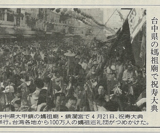
台中県大甲鎮の媽祖廟・鎮瀾宮で4月21日、祝寿大典挙行。台湾各地から100万人の媽祖巡礼団が詰めかけた。

いもの、中華民国の呼称を事実上承認する文書を盛り込むこととすることを決定し、さらに「主権の独立と自主は、国家の安全、社会の発展および人民の幸福の前提である」として、 また「台湾は中華人民共和国に属さず、中国が一方的に主張する『一つの中国の原則』と『一国二制度』は根本的に台湾には不適」とし、外交では国連参加を努力目標としている。