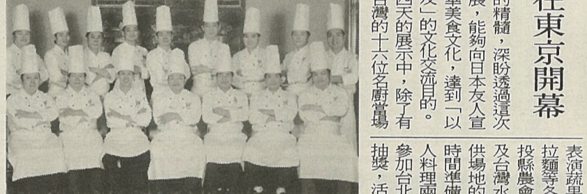
台北中華美食展在東京開幕。圖為參加台北中華美食展的台北中華美食展在東京開幕。圖為參加台北中華美食展的台北中華美食展在東京開幕。

第二十七屆由日本亞細亞航空主辦，救國團協辦，招待台灣各大專院校日裔優秀人才的訪問團，於七月七日抵達日本進行為期兩週的訪問。 本次訪問團的團長是由淡江大學日文系主任擔任，訪問內容除了至日本各大大學訪問外，也包括了家庭訪問等深入日本生活的內容。團員分別來自台灣大學、輔仁大學、東海大學等院校。