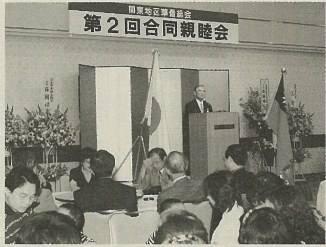
関東地区華僑総会の第2回合同親睦会

この集いは、比較的少ない首都圏各県の僑胞を糾合して親睦交流を計るの目的で、今回が二回目。会場では、各界の人士の卓話、余興などがあり、また代表をはじめ出席の代表の代表者たちを囲んでの活発な意見交換、質疑応答も