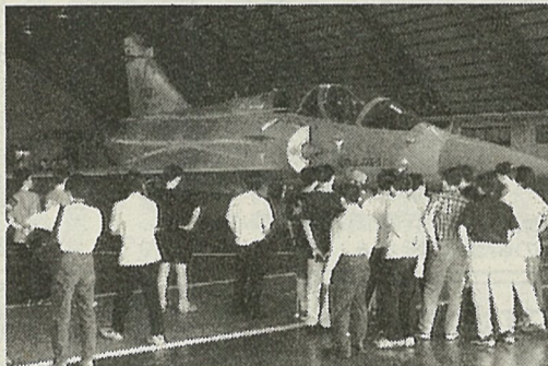
台湾の過去最大の航空ショー

分の家を持ち、自分の適性にあった、仕事につき、分散して努力したほうがよいのか、恐らく、親の目の届く範囲で活動するよりも、自力で運命を切り開くほうが、実り多いでしょう。毎日多くの身内がひしめいて生活し、嫁達の文句を聞きながら、兄弟同士が悩むよりも、別個で生活し、年に一回か親の元で、自分の成功話を報告し、親を喜ばした方が兄弟仲よく、お互いに活気あふれる生活を送ることが出来るでしょう。