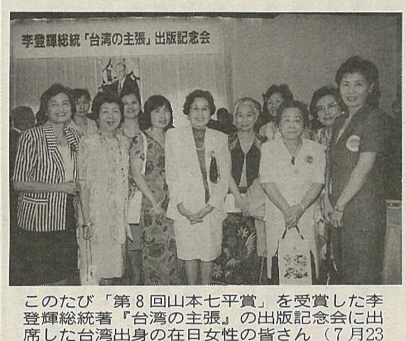
李登輝総統「台湾の主張」出版記念会

台湾は李総統時代の十年余りで、奇跡的な経済発展と最高指導者を有権者の一票で選ぶ「米国にも負けない民主化」（台湾紙）を実現させた。この自信が、ますます「小さな虚構」に我慢できなくなっている。李総統が中台を「国と国の関係」と定義した背景には、こうし