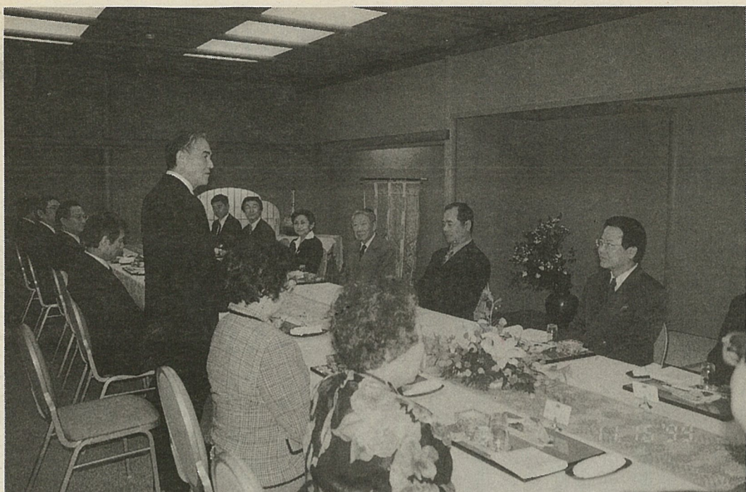
庄代表(左側立つ人)が主催した「在日華僑の王貞治監督(右側の右から二人目)の日本一を祝う集い」(11月16日、目黒八芳苑)

今回の台湾地震で被害に遭った多くの人の救済活動の一助とする募金を行うための「台湾集集大震災写真展」が福岡市のキャメル