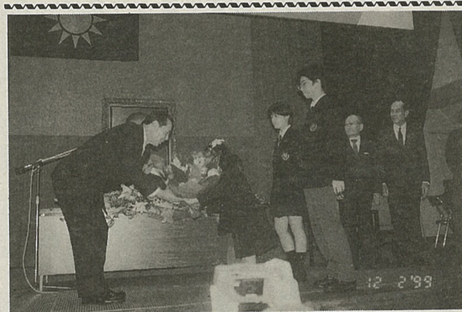
プロ野球ダイエー王貞治監督が東京中華学校を訪問し女生徒から花束を受ける(12月2日)

善に言及しており、一九九二年八月の断交以来、冷却していた台湾と韓国との関係は改善へ向け動き出す可能性も出てきた。 聯合報によると、韓国の金大中大統領と金鐘泌首相から、航空機乗り入れ再開をめぐり、近く閣僚級人物を台湾に派遣したいとの連絡があったという。