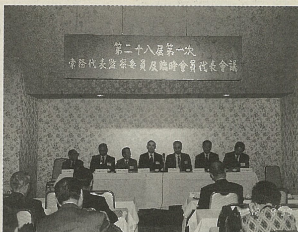
日本中華連合總會の臨時会員代表会議