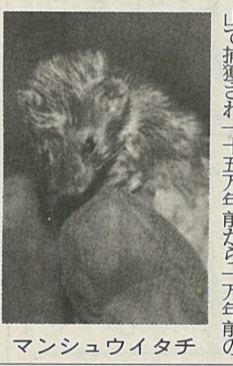
マンシュウイタチ