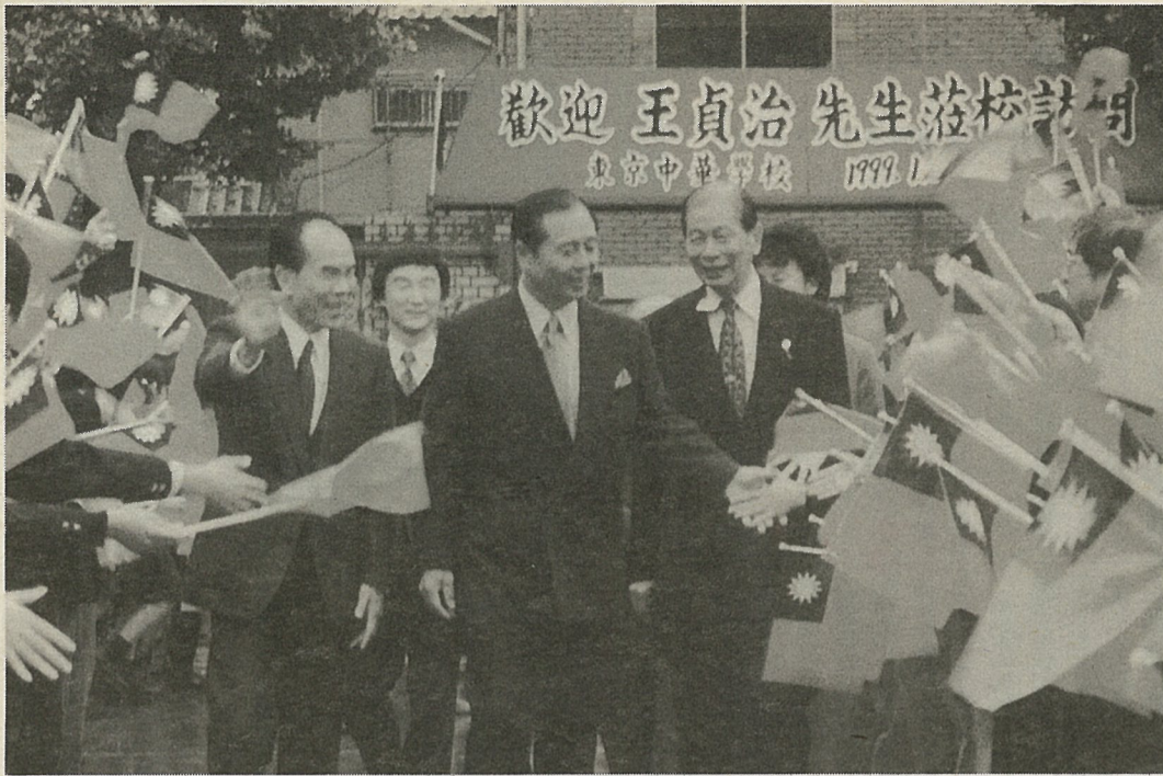
ダイエー王貞治監督が東京中華学校を訪問。全校生徒から大歓迎を受け、そのあと生徒の質問に答えた。郭東栄校長は、これを機に同校に野球部をつくと表明した (12月2日)

チャリティーコンサート開く 「心の絆ー日本と台湾」 紀尾井ホールで「心の絆ー日本と台湾」の歌謡などを披露 台湾大地震チャリティーコンサート「心の絆ー日本と台湾」が、十二月七日午後七時からJR中央線四谷駅近くの紀尾井ホールで開かれた。特別協賛・創価学会、後援・台北駐日代表処、中国文化大学、東京華僑総会、協力・中華航空ほか、このチャリティーコンサートは、台湾の音楽家が中国の伝統的民謡と台湾歌謡を日本で初めて舞台上で歌う