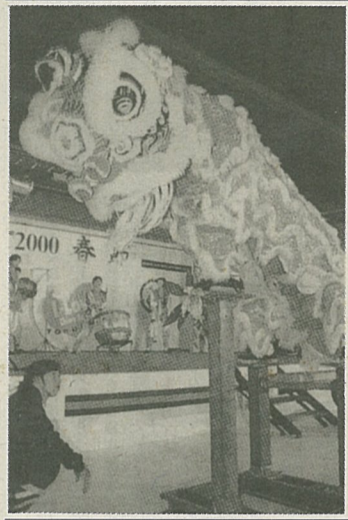
横浜中華街で旧正月の祭り 旧暦の正月を祝う中国の祭り「春節祭」 横浜市中区の横浜中華街

採決の結果は賛成三百四十一、反対七十の大差だった。クリントン政権は同法案に強く反対しているが、民主党からも四百一十一人が賛成に回ったことで、米議会の親台湾勢力の存在が根強いことを示した。一月三十一日夜、議事運営委員会で修正について協議されたが、結局、無修正のまま採決となった。 この法案は共和党の保守派、ディレイ院内副総務が提出したもので、ディレイ議員は同日、一九九六年の台湾総統選挙の際の中国のミサイル演習による威嚇に言及し、中国のミサイル脅威は増してきており、このまま手をこまねているのは大きな間違いだと述べた。一方、国務省のフォーリー