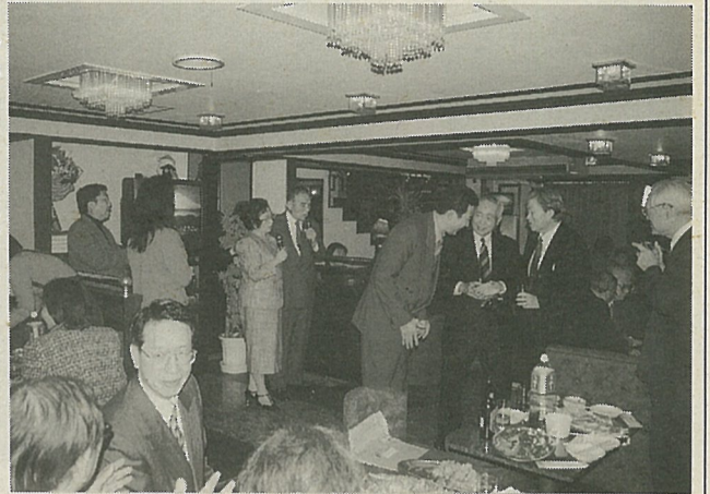
和気あいあい、心から楽しく旧正月を祝う 留日台湾同郷会の新年会

きたる三月十八日に行われる台湾の総統副総統選挙に帰国して投票する在日華僑の選挙帰国団の結成式が十四日午後二時半から台北駐日代表処で行われた。参加した華僑団体は後記のとおり。 また、結成式のと、同処で諮問委員ほかの任命式も行われ、在代表から次の各氏にそれぞれ辞令が手渡された。