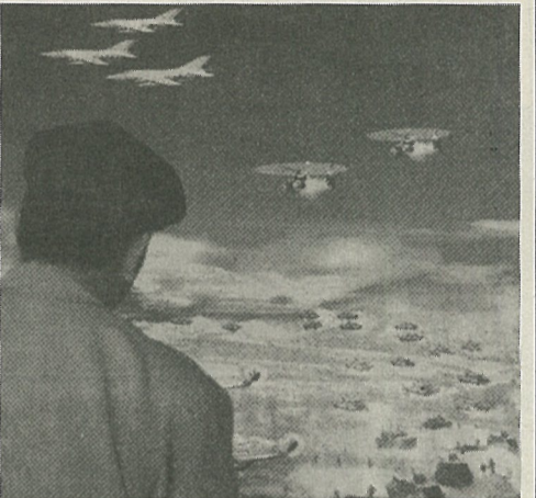
2月22日、北京市内で、人民解放軍の上陸作戦を想定した絵をみる中国人

中国は二月二十一日、台湾を統一する決意と方針を示した台湾問題に関する白書を発表したが、これに對して、台湾では反発と批判が広がっている。多くは、台湾の現実の主権と民主主義を無視しているというもので、三月に行われる台湾の総統選に対する脅しだとすれば、四年前の前回選挙のミサイル演習と同様、逆効果に終わる、との批判も少なくない。 中国の台湾問題に関する白書について、台湾当局の中国問題スポークスマン、