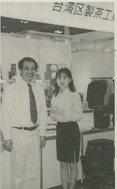
東京食品展台灣館

行政院農業委員會結合經濟部貿易局及中華民國對外貿易發展協會籌組東京食品展參展團，國內食品大廠義美等四十八家廠商及公會以國家館形式盛大展出。參展團五日啟程，七日到十日為展出期間，我參展團並安排舉辦三場中日業者貿易懇談會，交換市場拓銷經驗及解決各項貿易問題。 農委會表示，日本為全球最大的農產品進口國，年進口額約五百億美元，台灣輸日農產品佔有率約百分之六，還有相當大的開拓空間，東京食品展為亞洲地區最大、全球第二天的農產品