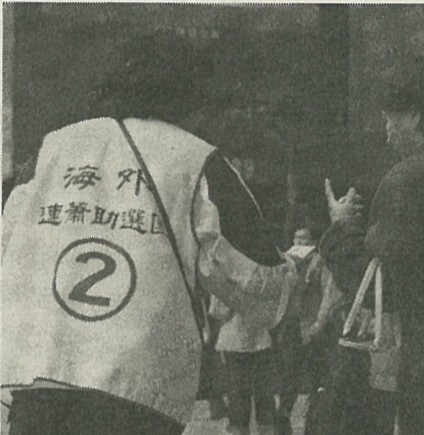
台北駅前、候補者応援のため海外から駆けつけ、ピラを配る在外支援者

台湾人は中国大陸に十万人、その他に十万人で、この数割が一時期台湾を去っている。各陣営が支持を求めている。政壇交代の歴史的瞬間を見たいからだ」と述べた。(11日付産経)