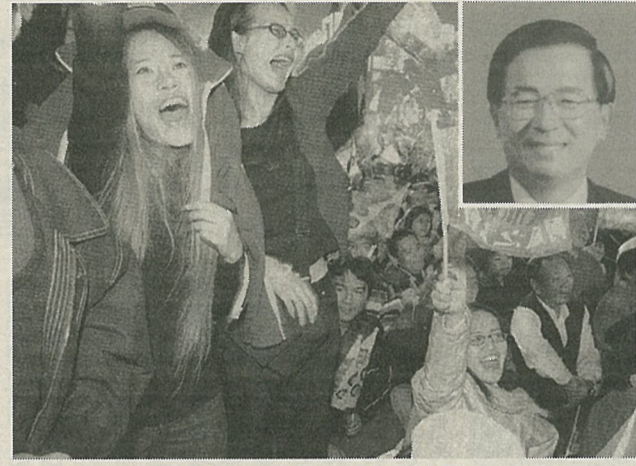
台北市内の民進党本部で18日、陳水扁氏(右上)の当選を喜び、氣勢を上げる支援者たち

台湾の総統選挙は十八日、投票が行われ、最大野党、民主進歩党(民進党)の陳水扁候補(四)が予想を上回る得票数で当選した。与党・中国国民党の連戦候補(六)は大敗した。民主選挙による台湾初の民主的な政権交代が実現した。