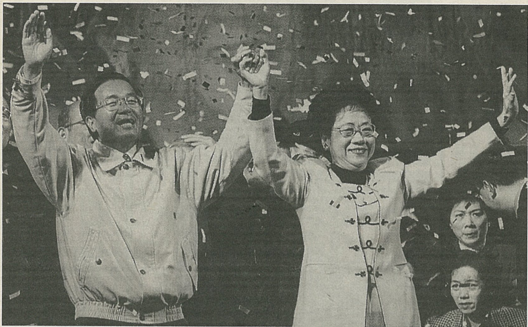
主要三候補の大激戦となった台湾総統選での勝利を喜ぶ次期正副総統の民進党・陳水扁氏(左)と呂秀蓮氏(3月18日、台北市内)