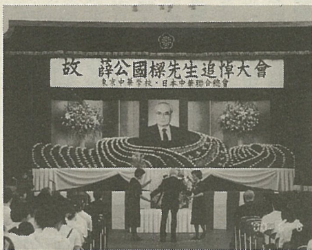
6月8日、東京中華学校で追悼大会。日本中華連合会総会と合わせ、約200人が出席して遺徳を偲んだ。