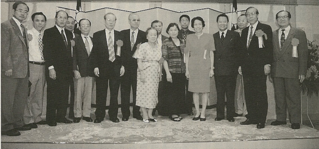
来日した張僑務委員長(右5)と僑務委員および華僑各会の会長の皆さん(14日、品川プリンスホテルで。撮影・台湾新聞社)

海外からの対台投資減少し、台湾の対大陸投資増加。經濟部が六月十五日に発表した統計によれば、今年一～五月の海外からの対台投資は金額で前年同期比一九・六%減少し、台湾からの対大陸投資は同三三%増加した。