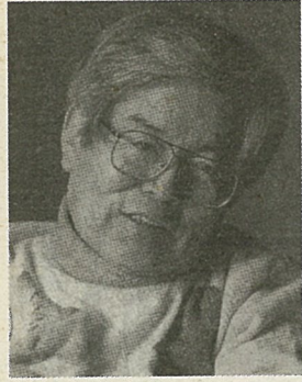
「こんな前例があるか

上、世の中は20年前、石油がもつた心配した。ところが、20世紀末になって分かったのは、問題は石油の埋蔵量ではなく、排出物、つまり「ゴミ」だということでした。いまや人類は、資源ではなく「ゴミ」で減びる可能性が高い。 「777」した経済構造をいつまで続けるつもりなのか。経済界の人たちは、この深刻な危機についてどうしようか。 ——日本は再び頂点に立ち、経済の立て直しに必死です。 「明らかに供給過多のモノを作っています。人間は人工的なシステムによって需要以