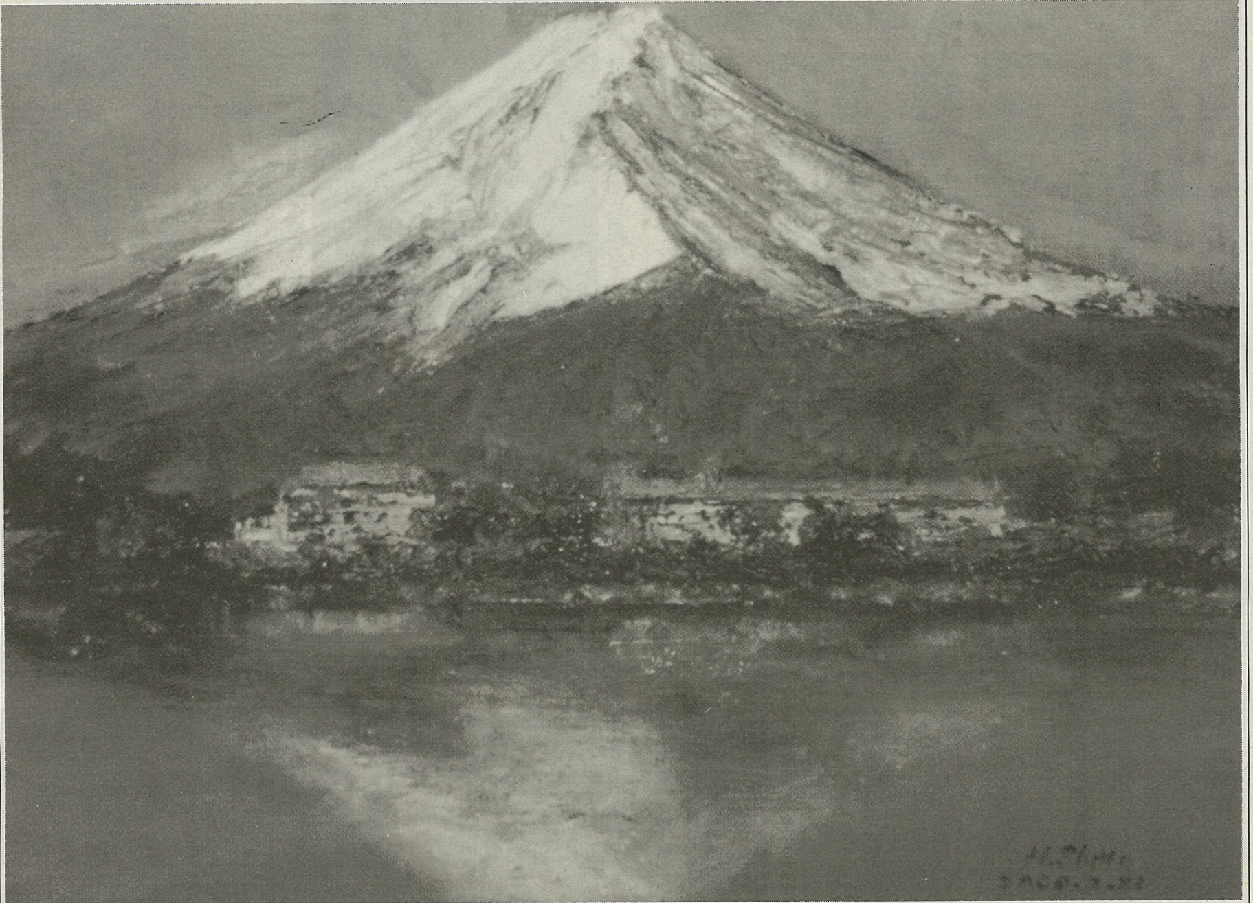
「河口湖と富士山」油絵F4号・周東 寛医博描く (駅ビル医院「せんげん台」院長。本紙に「健康講座」連載中)

・発行人 詹 德 薫 ・編集人 編集委員会 ・〒101-0045 東京都千代田区神田 鍛冶町3-2-4 第2富士ビル2F ・電話 03-3254-2201 ・FAX 03-3254-2202 ・本紙は留日台湾同胞の動 向を伝える情報紙です ・購読料 1部250円 ・年間3000円(送料・税込) ・月一回20日発行 ・郵便振替口座 00170-0-165216 ・振込銀行口座(普通預金) 東京三菱銀行神田支店 口座番号010-0586256 キョウシンキョウセイセントクワン