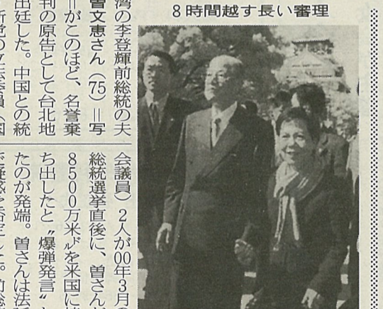
李前総統夫人の出廷