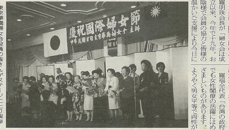
東京華僑婦女会役員の方々がステージに上り挨拶

台湾電力が第三原発と深澳火力発電所で実施しているため、発電所の排水は民間の一般の魚槽に比べて水質がよく、細菌も少ないため、生死亡率も高いという。一般の養殖では、寒波の到来で魚が凍死する問題があったが、発電所の排水