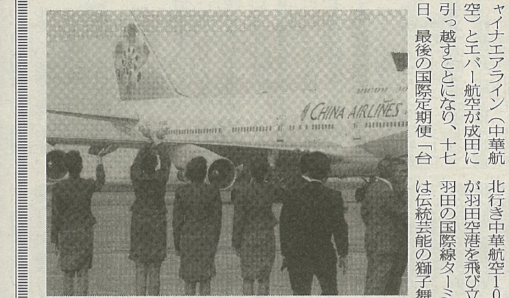
羽田発最後の国際定期便となった中華航空機に手を振る関係者

四月十八日の成田空港暫定平行滑走路の供用開始に伴い、羽田空港に唯一国際定期便を乗り入れていたチャイナエアライン(中華航空)とエバー航空が成田に引越すことになり、十七日、最後の国際定期便「台北」は伝統芸能の獅子舞や花束贈呈などが行われた。中華航空が羽田に乗り入れたのは昭和四十二年。その後、成田が開港した五十三年に他の外国航空会社が移転したが、中華航空は羽田に残った。平成十二年からは同じ台湾のエバー航空も羽田に乗り入れたが、同年の日台航空協議で成田への移転が決定。今回の成田への移転に伴い中華航空が、便増の週二十六便(ホノルル便も含む)、エバー航空は週二便から十四便(エドモントンとの共同運航を含めると二十一便)に大幅増となる。