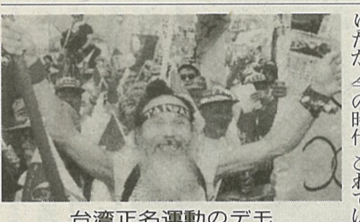
台湾正名運動のデモ

台湾に多く残る「中華」あるいは「中国」という名称を「台湾」に改めようという運動が、台湾で高まりを見せている。前總統の李登輝氏も賛同し、十二日には台北市で二万人近くの大規模なデモが行われた。「台湾正名運動」と名づけられたこの運動は数年前から始まり、昨年から本格化、四月