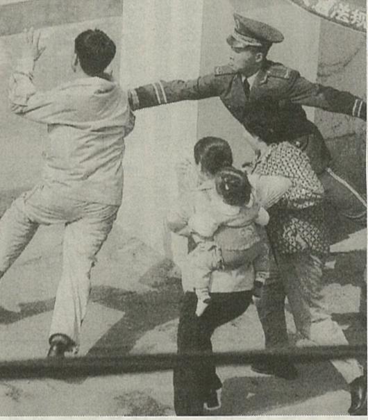
8日、中国遼寧省瀋陽の日本総領事館に駆け込み、総領事館内で中国の武装警官に拘束される北朝鮮住民とみられる男女。この「事件」は、周知のようにマスコミで連日大々的に報道され、日中間の外交折衝をめぐり大きな問題になっている

誤解され、国際社会から認知もされないとして、より一般的に知られる「台湾」という名称を使おうという運動となった。十二日の大規模デモは、李登輝氏が総呼びかけ人を引き受け、デモには参加しないものの、メッセージを寄せた。ただ、中国は「台湾独立への動き」として警戒している。