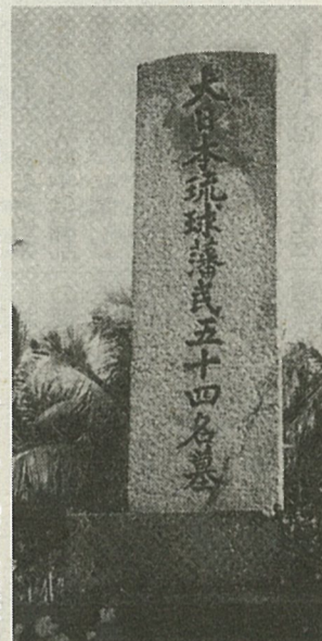
牡丹社で殺害された琉球・宮古島の54人を弔う「大日本琉球藩民五十四名墓」。大日本」の3文字が、ほぼ20年ぶりに復活した。台湾・車城で。

★格安航空券★ 募集：地方販賣員 海外出張、観光、パッケージツアー 2002/4月～2002/9月迄の料金(ピークシーズンは除く)