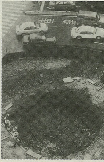
台北の田環(マル公園)の工事現場から、第二次世界大戦中のものとみられるレンガ造りの貯水池が思いがけなく「出土」し話題を呼んでいる。台北市文化局