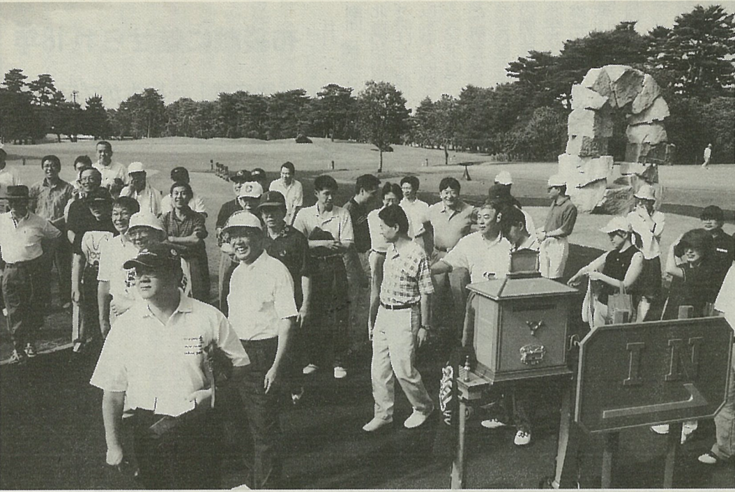
華僑各界ゴルフコンペに参加し、プレー開始を前に「いざ出陣！」と心はずませる華僑の皆さん (7月7日、霞ヶ浦国際カントリークラブ)

台湾は「一つの中国」原則の維持と台湾独立の不支持などを強く要求。また、テロ抑止では、米摘発を非難していることに強い不満を述べた。