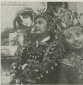
「巴冷公主」は国内で初め人間と蛇の壮絶な恋愛劇が描かれている。先住民の伝説をもとに制作されたゲームソフトである。

先住民ルカイ族の伝説、人間と蛇の壮絶な恋愛劇が、ネットワーク時代のバーチャルドラマとして現代に蘇った。七月十日、先住民伝説を題材にした3Dゲームソフト「巴冷公主」が国内の主要地区で二斉発売された。本ソフトは三千万円(約二億二千万円)と二年の歳月をかけてつくられ、中国、香港、台湾で販売数十万部を見込んでおり、イ、オーストラリア、韓国などでも海外版権について