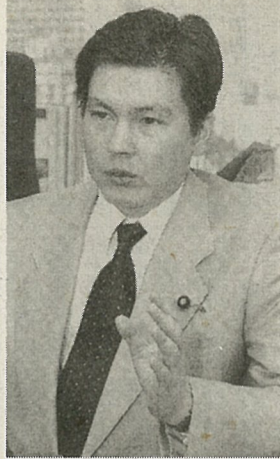
辞任した水野政務官

外務省の水野賢一政務官は八月二十一日、福田康夫官房長官を首相官邸にたずね、日中外交正常化に伴う台湾との断交三十年に合わせ川口順子外相に求めていた、自らの台湾訪問を省内で議論されず却下されたとして、外相がアフリカ諸国歴訪に出発する二十五日までに辞表を提出し、辞職を辞任する意向を伝えた。 水野政務官は八月十二日、自身のホームページで「外務省の一員」として今