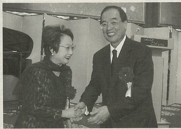
来場した扇千景国土交通相(左)を出迎え握手する羅福全代表

増えたことはご存知の通りで双方の往来はますます増加しつつあり、慶賀の至り。今後の交流緊密化に大いに期待したい」と述べ、このあと登壇した中川昭一衆院議員が「日台断交の時、父(故中川一郎氏)が泣いて残念がったことをよく覚えて