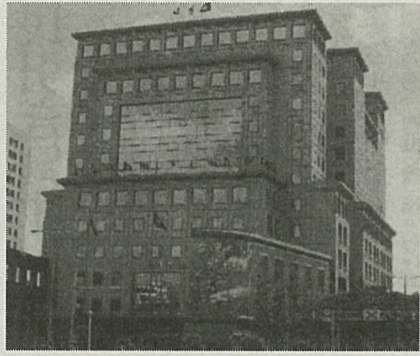
「孫文記念図書館」に生まれ変わるのか? 国民党本部ビル

「党営事業」の歴史は、国民党が大陸にいた1940年代までさかのぼれる。その後、台湾に逃げのびた国民党は日本統治時代の資産を引き継ぎ、政權移行の力をバックに70年代からは事業を多角化した。製造業から金融、メディアまで幅