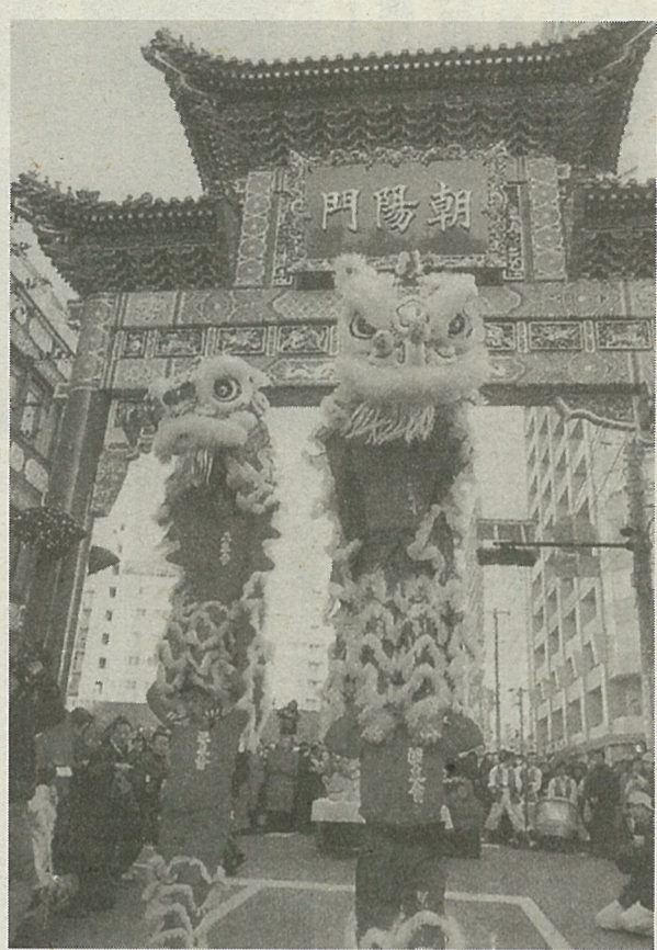
「朝陽門」の完成を祝い、獅子舞のお披露目もあった＝2月1日、横浜市中区山下町で

中国の旧正月に当たる春節の1日、横浜市中区の横浜中華街で、街の新しい玄関口となる「朝陽門」が完成披露された。