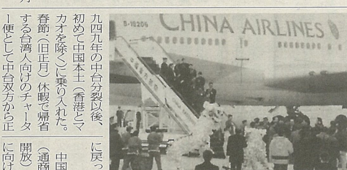
1月26日台湾機として初めて上海・浦東国際空港に到着した中華航空機のチャーター便。同機は同日午前、一般乗客を乗せず台北国際空港から香港を経由して上海・浦東国際空港に飛び、同日午後、台湾人乗客約二百五十人を乗せ、上海から再び香港経由で台北