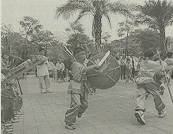
「青真劍」分送給陳水扁總統、內政部長余政憲。這次宋江陣活動內容，除內門紫竹寺前廣場連續九天的陣頭表演及宋江陣製作「U」外，實踐大學高雄校區則有郭常喜兵器藝術文物展、農特產品展售，以及取宋江陣式的形、音、意而定名的菜餚「宋江大菜」。

美國在台協會台北辦事處表示自三月十七日起，所有非移民簽證申請人必須透過電話預約申請簽證，同時加強全球的美國簽證核發流程，所有簽證申請表必須以英文填寫。 預約電話是付費電話，入國情形，入境我國在三十天以內者免辦簽證，超過三十天以上者，請於行前向我駐外館處辦妥簽證。 具大陸地區人民身分者，依兩岸人民關係條例，尚須符合旅居國外四年以上之要件，方得適用前項辦法入境。