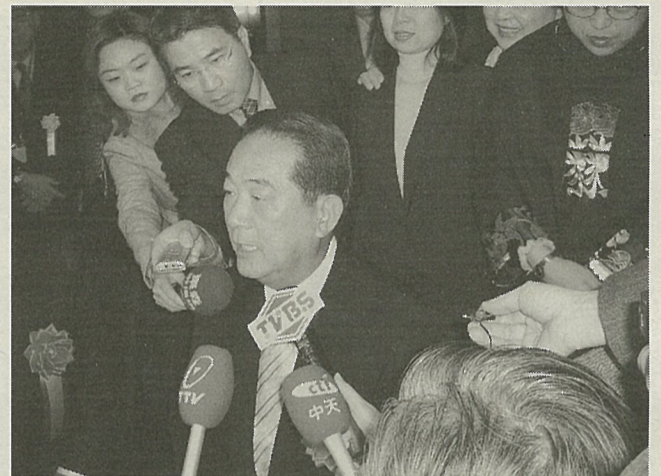
宋楚瑜親民黨主席(中央、歡迎會中)

「未來「二十一地區」為主的橫濱市政建設，在傍晚和中田市長會談，中田市長指出日台在國家層次的交流上雖受到限制，但在都市交流應該加強。宋楚瑜稱讚橫濱雖是老城，但在年輕的新市長的規劃下充滿朝氣，很多地方值得學習。 九日參加由蔣經國中日文化交流基金會主辦，東京親民黨和日山中學會協辦的聯誼餐會，旅日僑界等共有大約六百人出席，場面盛大，日本參議員尾谷一郎也到場致意。