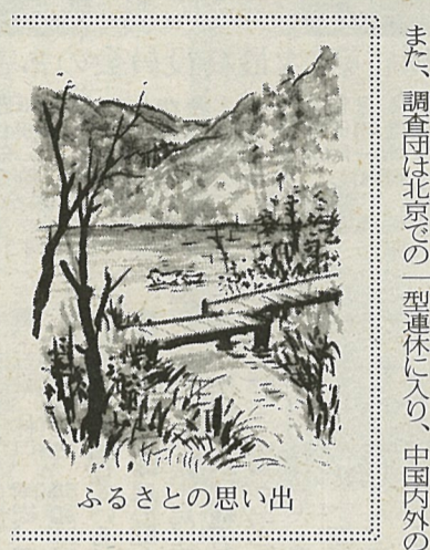
ふるさとの思い出

調査団は十一日から十五日まで北京で調査を行い、百人以上のSARS患者が入院しているとの疑念が指摘されていた二カ所の軍病院などを立ち入り視察。この結果、衛生省が発表した患者数に軍病院の入院患者が含まれていないことを確認した。