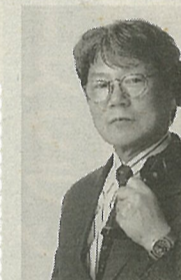
正木信之氏の専属写真記者として活躍。現在フリーカメラマンとして、あらゆるジャンルの写真撮影を行っている。

本紙特約カメラマン・正木信之(まさきのぶゆき)氏は台北市生まれ。東京綜合写真学校卒業後、アメリカのAP通信東京支局写真部に勤務のあと、日本の宮内庁写真記者として皇室行事の取材活動に従事。その後、フリーカメラマンとして、フリーカメラマンとして、あらゆるジャンルの写真撮影を行っている。