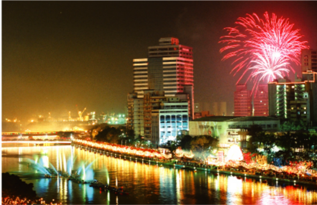
STAY的相關情形也可洽詢臺灣觀光協會 http://www.tsa.jp/ http://jp.taiwan.net.tw/ 和臺灣LONGSTAY協會

有鑑於之前埔里曾發生「中村事件」，許傳盛說，將結合高屏先試辦一、二個禮拜的短期旅遊，充分了解了日本人生活習慣與嗜好，才能真正的規劃適合日本人的LONG STAY。有關LONG