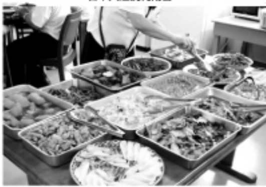
台湾式のベジタリアン料理