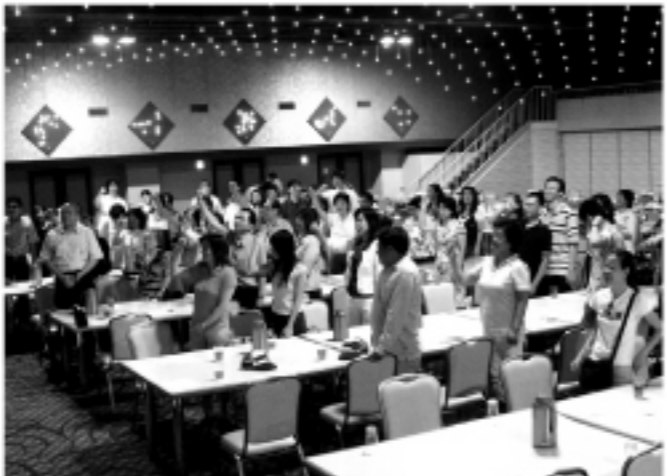
大家齊聚溫泉飯店會場

台灣を愛する日本の友人の皆様に知らせとお願いがございます。皆様が台湾が中国により国際的に迫害を受けている事をご存知ですか？