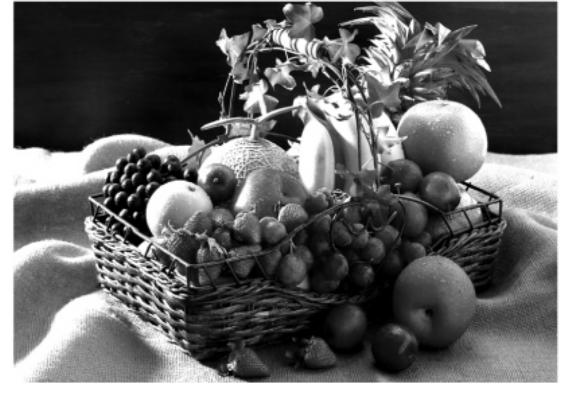
日攝取蔬菜的份量，應較水果多一份。在此建議大家每日攝食足量新鮮蔬果外，也可以選擇市面上販售的蔬果汁來補充蔬果攝取不足。

有効予防癌症 台湾人罹患癌症の人数年创新高，然而在現代癌症已非絕症，根據台灣癌症基金會發表的文獻表示，60%～70%的癌症是可以預防的，預防重點需要靠飲食調整、運動及維持適當體重等努力。台灣癌症基金會及美國癌症協會(ACS)從2004年起，提出「蔬果579」飲食概念，做為新一代健康防癌參考指標。 根據台灣癌症基金會的研究，蔬果的纖維素能減少腸內致癌因子、改變腸中菌叢生態、避免癌細胞形成；目前已證實足量的蔬果纖維，可預防大腸直腸癌，並減少乳癌、食道癌等數種癌症的發生機率。此外，蔬果中所含的維他命C、E、兒茶素等營養成分，對於抗氧化、降低心血管疾病風險率等，皆有不錯的功効。 「蔬果579」是為現代人身訂做的最新飲食概念，有效幫助國人養成防癌的好習慣。建議6歲學齡前兒童，每天攝取應5份新鮮蔬果；6歲以上學童、少女及女性成人，應每天攝取7份蔬果；而青少年及男性成人，則應每天攝取9份蔬果。蔬菜類一份約為生重100公克，水果類一份約為150公克，每