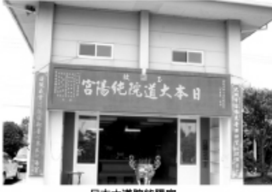
日本大道院純陽宮

私は午後3時ぐらいに大道院から出て、東京に帰った。数時間の滞在だったが、気分がリフレッシュし、清々しい。異国にいるとき、誰でも心細くなる時がある。そんな時、ぜひとも大道院に行ってほしい。そこには、癒してくれる神様と人々がいる。