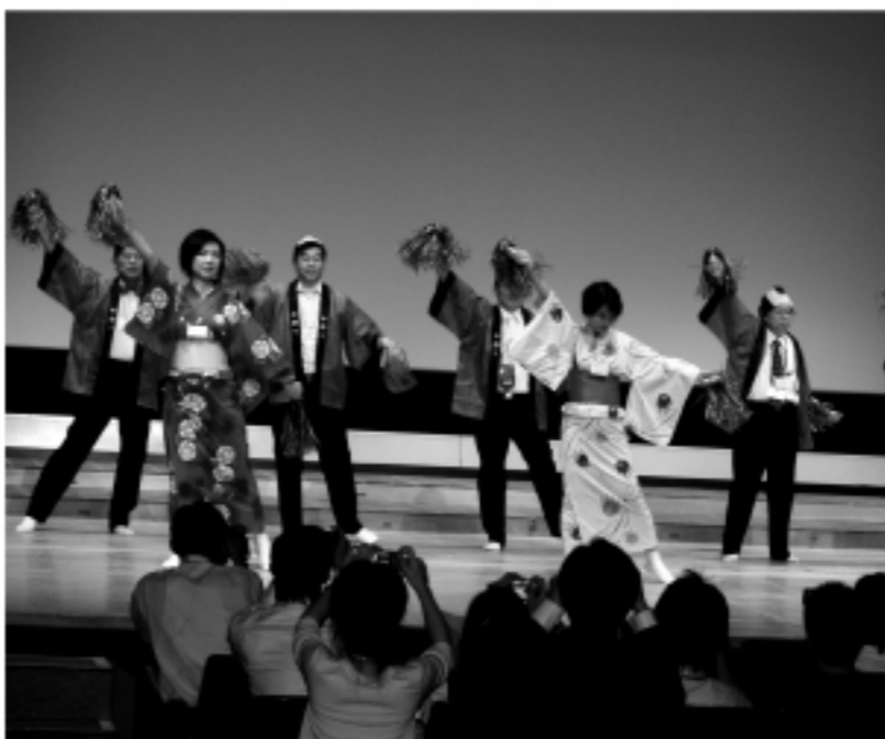
日本舞蹈歡迎從臺灣前來的朋友們

許代表說,日臺沒有國交並不代表臺灣不是一個國家;既使沒有國交也沒有關係,至少承認臺灣是一個國家。許代表並在最後呼籲,不論大家所支持的總統候選人為何,應一致團結的支持以「臺灣」之名加入聯合國。