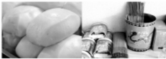
ふわふわの手作り饅頭