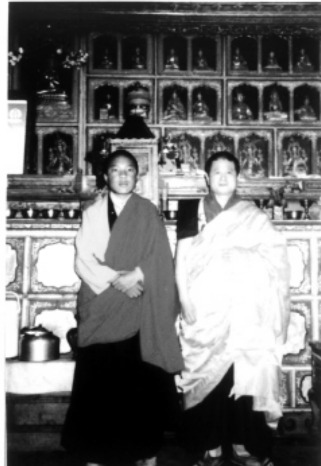
圖左為第十七世大寶法王烏金聽列那耶多傑，圖右為被認證的噶瑪巴登洛德喜饒根登仁波切。