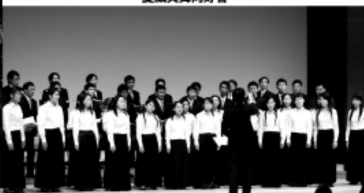
中山醫學大學醫學部合唱團