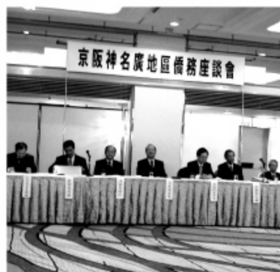
▲京阪神名広地区僑務座談会の様子