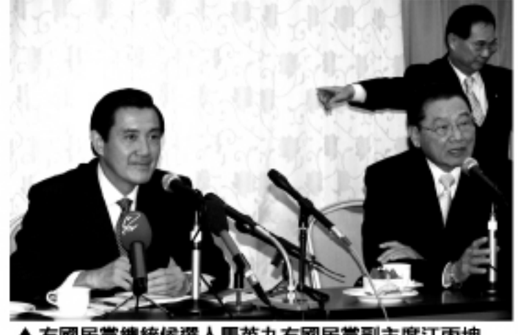
▲ 左國民黨總統候選人馬英九右國民黨副主席江丙坤

馬英九並對於在日台灣人的外國人登錄証上的國籍欄記載著「中國」，而感到的不當。馬英九許下承諾，若當選總統將會向日本政府進行交涉。馬英九也就國號稱呼問題提出了立場，他表示，自己選的是中華民國總統，也可接受是說選中華民國(台灣)或是台灣的總統，但不能夠接受說選台灣總統。他也再次重申不統、不獨、不武的立場；也不會再在內和中國大陸談統一問題，並不會支持台灣獨立，更反對以任何非和平的方式去解決台灣問題的立場，當然也不會試圖片面的改變台灣的現狀。 馬英九於當天下次結束訪日之行啟程回國，馬英九在這一訪日期間也遭到反對人士抗議。前日由在日華僑所舉辦的歡迎會及當日上午的記者會的場外都有數十名示威者大聲抗議。