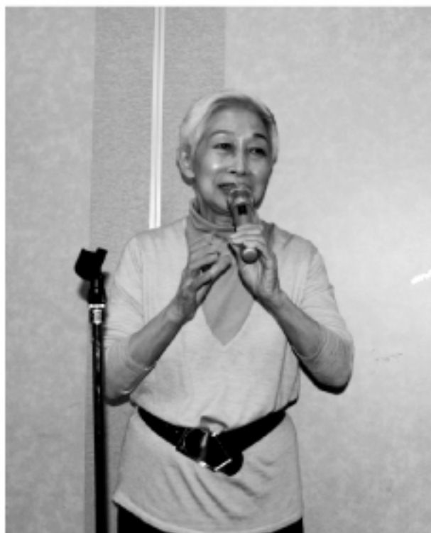
▲前國策顧問金美齡