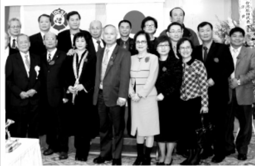
▲遠從台灣來的佳賓們