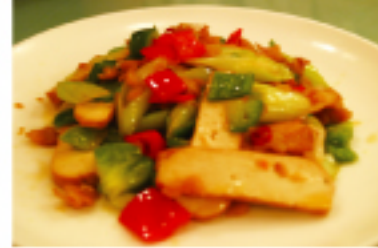
▲ 豆干菜脯(脱水豆腐と台湾産切り干し大根の炒めもの)