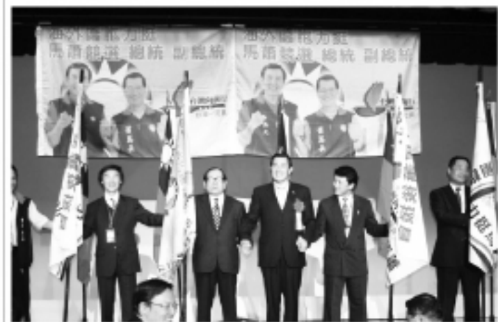
▲國民黨總統候選人馬英九授旗後後援會的會長們