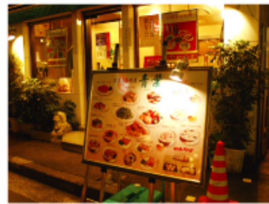
▲ 青葉新館の入り口

営業時間:月~木:日 11:30~22:00 金・土11:30~23:00 定休日:月曜日(祝日を除く) ホームページ:http://www31.ocn.ne.jp/~aoba/index.html