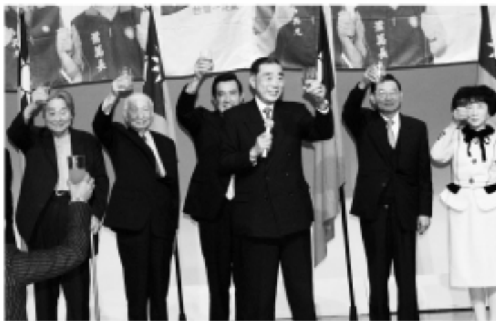
▲一齊舉杯祝國民黨總統候選人馬英九馬到成功