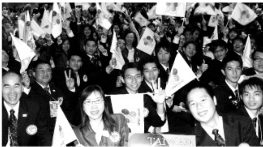
▲11月14日の開会式での台湾選手団の元気な姿。

開幕した。これから11月21日の閉会式まで、世界およそ50か国から集まった選手団が、さまざまな職種の実技を競う。