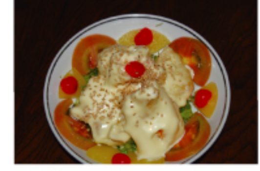
▲ えびのマヨネーズ和え