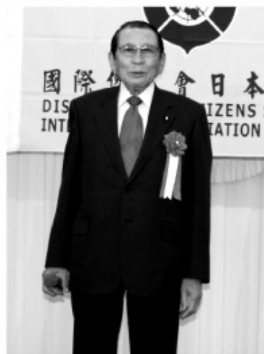
▲國民黨代表錦賢民輔