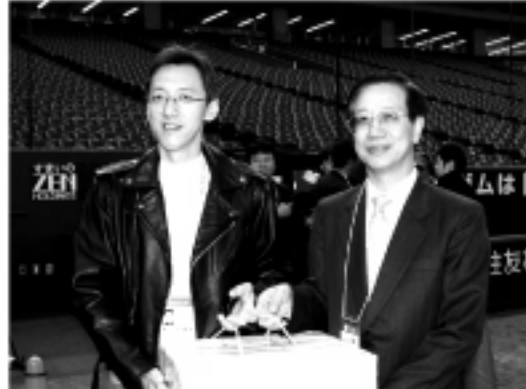
▲ 羅副代表贈與水果給統一獅

因為日本的球場和台灣的球場不同，所以球員們也不放過任何練習的機會，藉此熟悉場地。