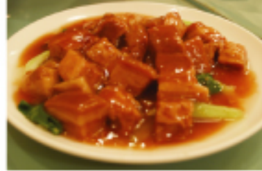
▲ 紅燒魯肉(豚肉の台湾風角煮)