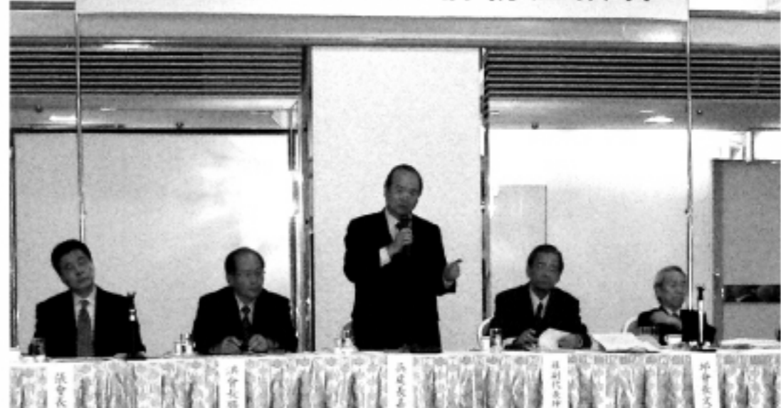
▲台北駐大阪經濟文化辦事處・吳嘉雄処長があいさつ