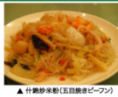
▲ 什錦炒米粉(五目焼きピーマン)