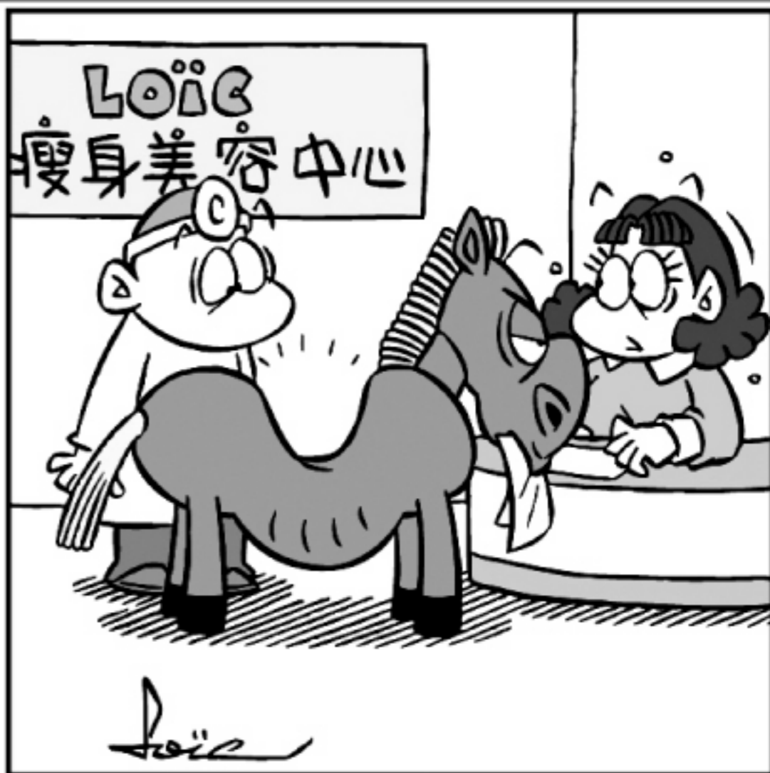
作者：蕭言中 牠堅持要替牠主人報名減肥……

改正法により、一定規模以上の小売店は、レジ袋使用量の削減への取組状況を、来年4～6月に国に報告することが義務付けられた。レジ袋は家庭から出るプラスチックごみの10～15%にあたり、環境省は、この使用を減らせば大幅なゴミの減量になると期待する。一方で、レジ袋メーカーにとっては大きな打撃になる。レジ袋メーカーなどが加盟する日本ポリオレフィンフィルム工業組合によると、今年3月のレジ袋の出荷量は前年同月比13.7%の大幅減となった。レジ袋には一定のコストがかかる。大手スーパーなどがレジ袋削減や有料化に取り組み、コスト削減し、利益を高めることになるという声も出ている。そのため、大手の流通企業は消費者に理解を求め、発生した利益の社会還元に取り組んでいる。イオンはレジ袋削減で得た収益を自治体のリサイクル推進や環境保護活動に充てる。西友は、レジ袋を受け取らない客に対して、一回の精算でレジ袋はぼ1枚の費用にあたる2円を買い物代金から差し引き還元するなどを実施している。