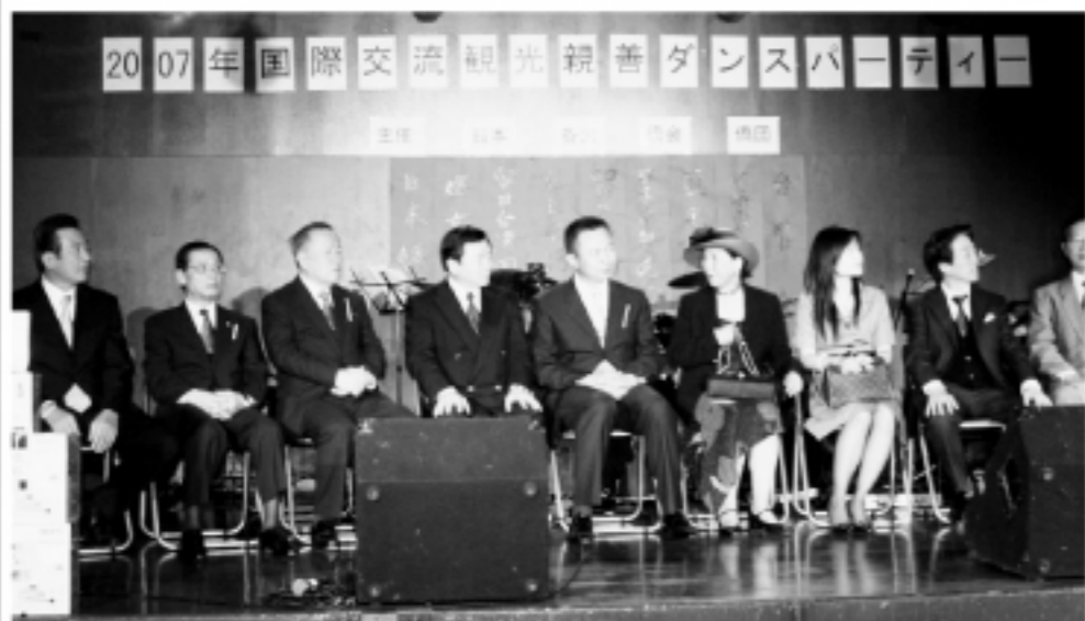
▲各大僑會僑團的會長及代表