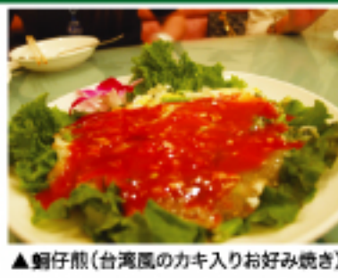
▲ 蚵仔煎(台湾風のカキ入りお好み焼き)

中華街で本格的な中華料理を食べられても、本場の台湾料理を食べられると限りない。しかも、薬膳料理と一緒に食べられる台湾料理店はない。冷え込みが厳しくなる中で、薬膳料理と台湾料理で、体の芯から温めよう。