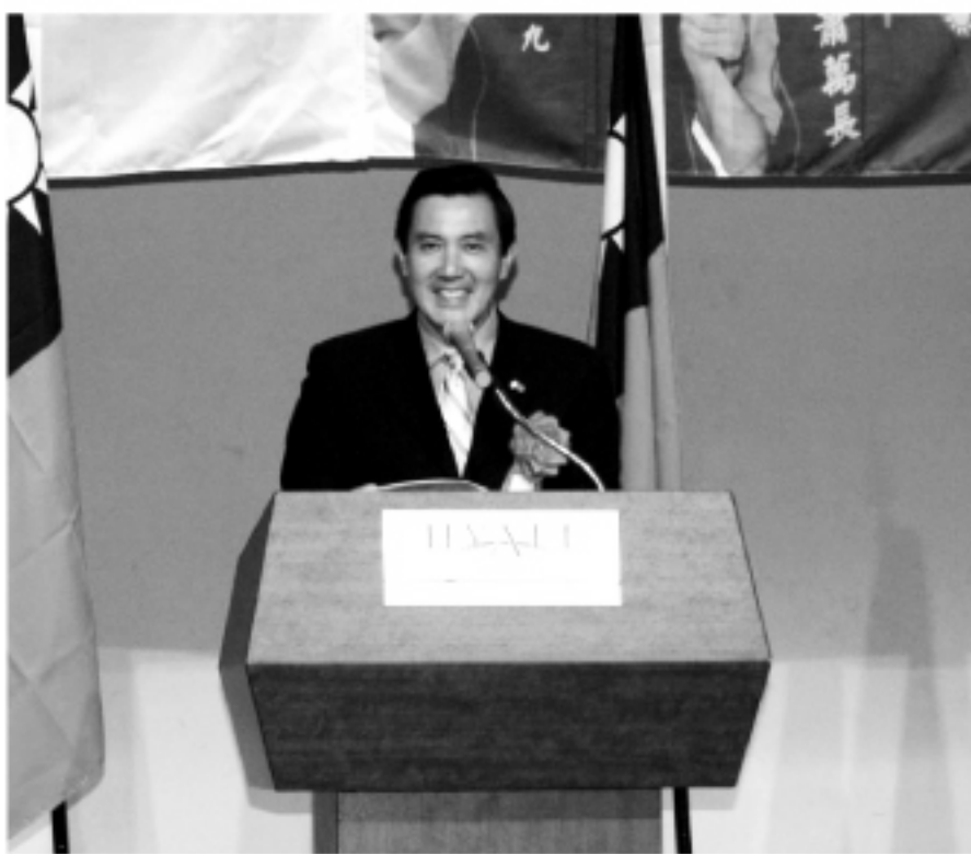
▲國民黨總統候選人馬英九

本次以結合東京地區中國國民黨黨員及熱愛中華民國臺灣的全體僑胞、學人與留學生等一切力量，透過實際行動，以精誠團結支持馬英九、蕭萬長競選。從「僑聯日本地區馬英九之友會」成立後，八月由國民黨籍台灣各縣市青年議員所推動組成的「東京阿九後援會」，十月的「東京中山學會馬蕭後援會」各界紛紛展開行動，表明支持中國國民黨前主席馬英九、蕭萬長競選二零零八年中華民國總統，由馬英九博士受給五大代表大旗，授旗時帶動會場全員，全體黨員高呼「馬英九(凍蒜)」口號。給了在場的每個人充電，使到場的人員為選舉助選到堅持到最後一刻的信念加上新的力量。