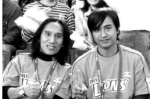
▲ 動力火車也來日加油

光宣傳廣告影片之外，並在入口之處擺設攤位，也在入口處發給每位入場球迷抽獎單，獎品豐富。現場除了放置觀光手冊及