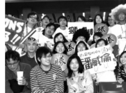
▲ 從台灣專程來日的加油團

而在比賽結束後，得獎人則陸續拿著得獎單前往台灣觀光協會東京事務所的攤位兌換獎品。得到台灣和日本往返機票的球迷感到非常的興奮，表示一定要好好的玩台灣。