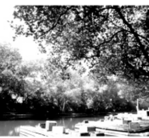
▲ 大鵬灣國家風景區