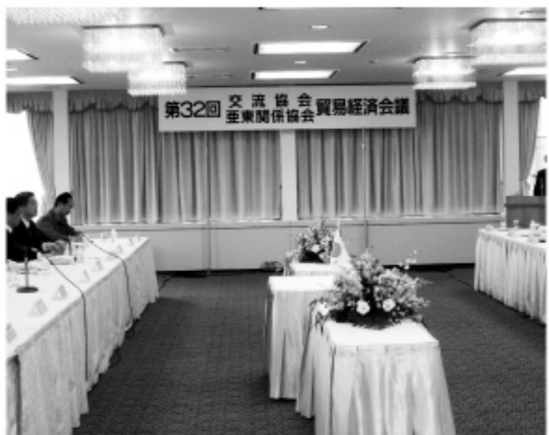
▲ 第32回台日經濟貿易會議

出，我國日前提出「加強推動會展產業」，希望在未來兩年透過硬體建設及行銷推廣措施，強化我國會展產業之發展，包括即將於明年三月舉辦揭幕首屆的「南港展覽館」，請日本工商團體及企業共襄盛舉。 另外，陳團長特別強調推動台日青年人的交流活動，盼台日雙方進一步洽談「渡假打工協定」，讓青年人有機會到對方體認，學習生活與文化，增進未來台日關係之發展。 本次會議雙方共提出WTO、APEC、關稅、農漁業、投資、環保、通訊、科技交流、醫藥及智慧財產權等61項議題，分成「一般政策」、「農漁業 醫藥 技術交流」、「智慧財產權」等三組，由雙方官員直接進行諮詢，另台日雙方亦援例安排在閉幕典禮中做專題演講，台方報告：「南港展覽館與未來營運」，日方報告：「日本中小企業現況及今後之政策」，21日下午四時三十分，在台日雙方團長簽署會議同意議事錄後結束本屆會議。 文章提供：台北駐日經濟文化代表處