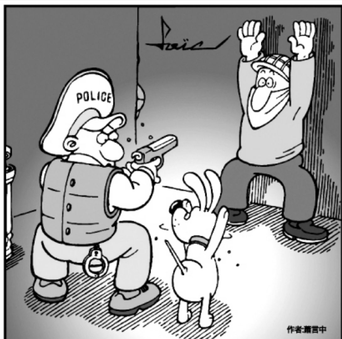
手舉起來!...不包括你, 波比! 手をあげろ!!!! ポビー、お前じゃないぞ

物盡其用的好例子。 環保概念2：森林保育 木材是家具最主要的原料，但是隨著濫伐造成土石流等氣候災害，所以在歐美等先進國家早已政策性的規劃造林和有計畫的使用木材。 而因為原木的數量大量減少，所以防潮型合板就成了替代性的建材。雖然價錢不菲，但是歐美家具早就引進了環保的德國防潮型合板，在歐美早就普遍的選擇。另外，無印良品以回收的再生紙製成堅固的紙管，可以組合成收納棚架，其靈活性也容易和環境融合，也是最環保的替代素材而北歐廠商IKEA則對林業保護更有著全面性的計畫。IKEA全球有12位林業管理人員，專門負責監督木頭的取得有否符合生態保育的準則。並且和非營利組織合作，如和WWF在世界各地進行不同的林業計畫。 環保概念3：降低空氣污染 環保是現在全世界所面臨到的最大問題，對許多企業來說，也把做環保當成提升自己企業形象的重要工具。其實，除了宣揚環保外，要能夠真正的在製成上降低污染，這樣才真正的對環境有幫助。而運輸型態的改變也可以降低空氣污染。比如說，IKEA就把產品設計成可以堆疊的方式，如此以來不僅可以提升運送量，還可以降低3成的廢氣排放量。