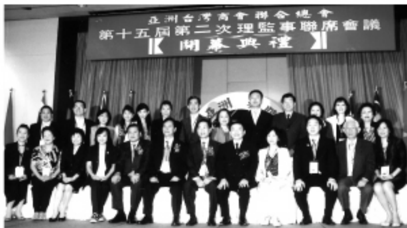
▲亞洲台灣商會聯合總會第十五屆第二次理監事聯席會議開幕典禮大合照