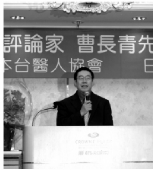
▲旅美政治評論家曹長青

此外，曹長青也針對近日以來爭議不斷的大中至正改名提出看法，曹長青說，國民黨一直強調的蔣的功大於過是東京固有的帝國思想，國民黨和中國其實沒有什麼兩樣。民主主義下的總統是為人民服務