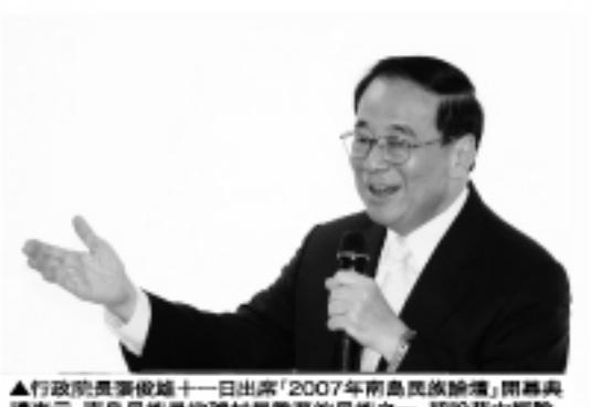
▲行政院長張俊雄於11日出席「2007年南島民族論壇」開幕典禮，強調台灣原住民與南島民族同屬全球分佈最廣的南島語系民族，擁有共同的語言與世代傳襲的海洋文化，台灣政府非常重視原住民，這也是台灣與友邦間重要的合作課題。2007南島民族論壇上午在台大醫院國際會議中心會議室隆重開幕，邀請了來自澳洲、紐西蘭、帛琉、貝里斯、巴布亞新幾內亞、菲律賓、印度、德國、加拿大等國家原住民代表與政府官員參加，張俊雄蒞臨出席。開幕式一開始，會場後面一不速之客突然起

(中央社)行政院原住民族委員會主辦的2007年南島民族論壇12月11日在台北市開幕，行政院長張俊雄蒞臨致詞，強調台灣原住民與南島民族同屬全球分佈最廣的南島語系民族，擁有共同的語言與世代傳襲的海洋文化，台灣政府非常重視原住民，這也是台灣與友邦間重要的合作課題。2007南島民族論壇上午在台大醫院國際會議中心會議室隆重開幕，邀請了來自澳洲、紐西蘭、帛琉、貝里斯、巴布亞新幾內亞、菲律賓、印度、德國、加拿大等國家原住民代表與政府官員參加，張俊雄蒞臨出席。開幕式一開始，會場後面一不速之客突然起