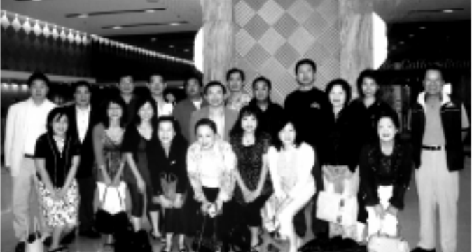
▲關於馬來西亞登頂高原