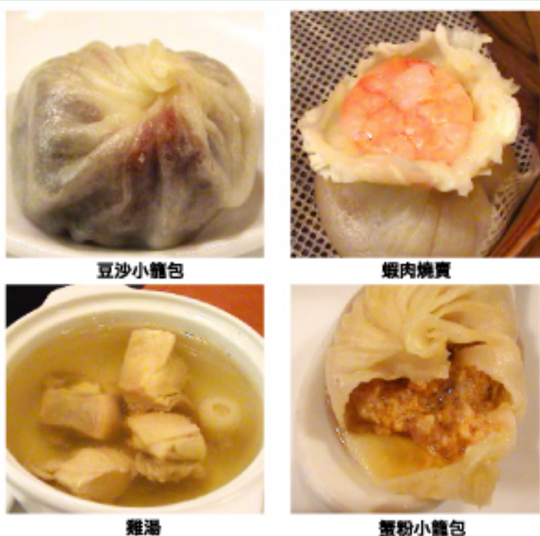
豆沙小籠包 蝦肉燒賣 雞湯 蟹粉小籠包

【ディナー】 ・小菜(台湾風味前菜) ・葱油素菜(野菜の和え物葱油風味)・お麩の甘辛煮台湾風・クラゲの甘酢和え・炒青菜(季節野菜の青菜炒め)・酸辣湯(サンラータン)・小籠包(豚肉のスープ入り小まんじゅう)・蟹粉小籠包(カニ肉入り小籠包)・油淋鶏(鶏肉の唐揚げ甘辛ソース)・炒鮮魚(白身魚の炒め物)・糯米焼売(もち米入りシューマイ)・ハーブ担担麵・豆沙小包(あんこ入り小饅頭)・本日のデザート