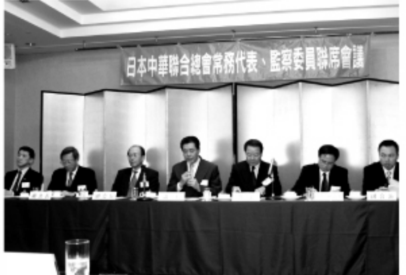
▲第32回「第2次常務代表委員及監察委員聯席會議」の様子