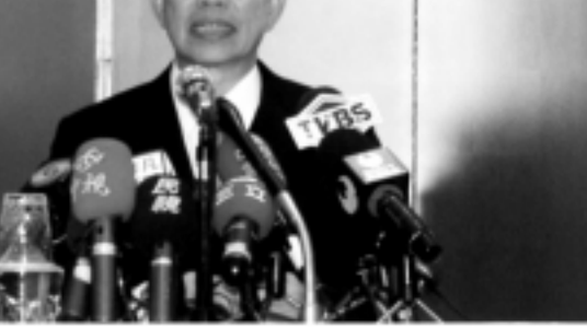
▲民進黨總統候選人謝長廷

府是一個麻煩製造者，唯有他才能維持台灣安全，兩岸和平，但是這樣子的發言對台灣人民是不公平的。謝也針對記者提問的兩岸問題表示，當選總統後將會促進兩岸和平，但是是平等有尊嚴的和平。也將會積極的尋求和中國對話的機會，但是對話一定是在平等的狀況之下，也不會接受一個中國原則等條件。此外，謝長廷也提到在對於中國的經濟政策上將會比較開放。他表示，贊成包機直航和開放中國觀光客訪台但在政治上則堅持台灣主體性，這和馬英九的主張開放卻沒有主體性是大不相同。 而針對馬英九上個月訪日回台召開記者會時就來日被噓聲之一事，馬英九才會被抗議，而謝長廷就不敢像他如此作出堅決的主張。謝長廷說，馬英九並不了解其實政府多年來一直都有在處理釣魚台問題，如果馬先生所說，為了釣魚台而不惜一戰的話，那麼全世界都要打戰了。這是非常缺乏國際常識的回答。謝長廷也表示，其實釣魚台問題應該分為主權和漁權，漁權的話台日則都一直協調的很好，而關於主權則不是馬上可以解決的。謝長廷也對於此於受到日本人士的大力歡迎，感到非常的感謝。