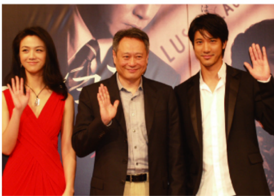
▲左邊湯唯 中間李安 右邊王力宏

李安導演在記者會上談到在電影一開頭的麻將戲和床戲是整部電影中不可缺少的部分。麻將是中國的國粹，在麻將桌上，戲中的太太們藉著一邊打麻將一邊互相探取對方的口風和盤算利害關係，所謂的方城之戰，是女人之間的戰