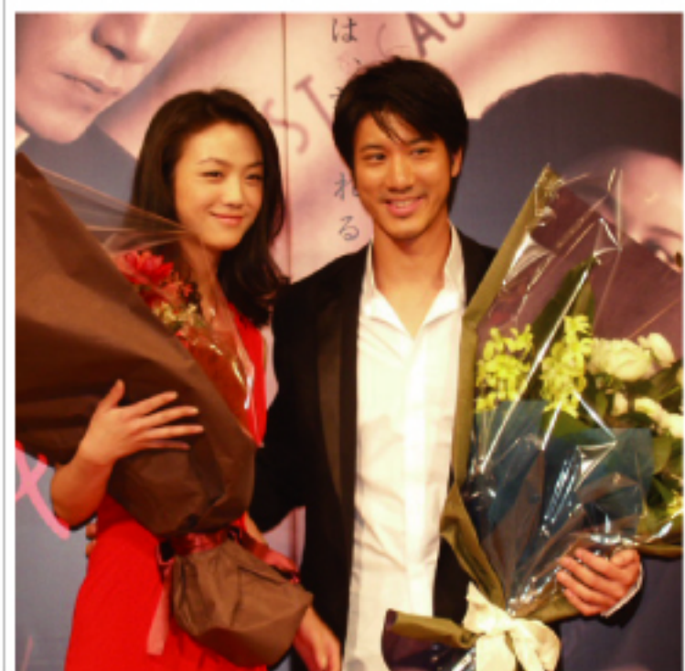
▲湯唯和王力宏的合影

李安在最後時表示電影中的三個角色，王力宏所飾演的鄭裕民代表著自己年輕時的那股清純，而湯唯所飾演的王佳芝則代表著自己的內心，至於梁朝偉所扮演的易先生則代表著男人最脆弱的部分。