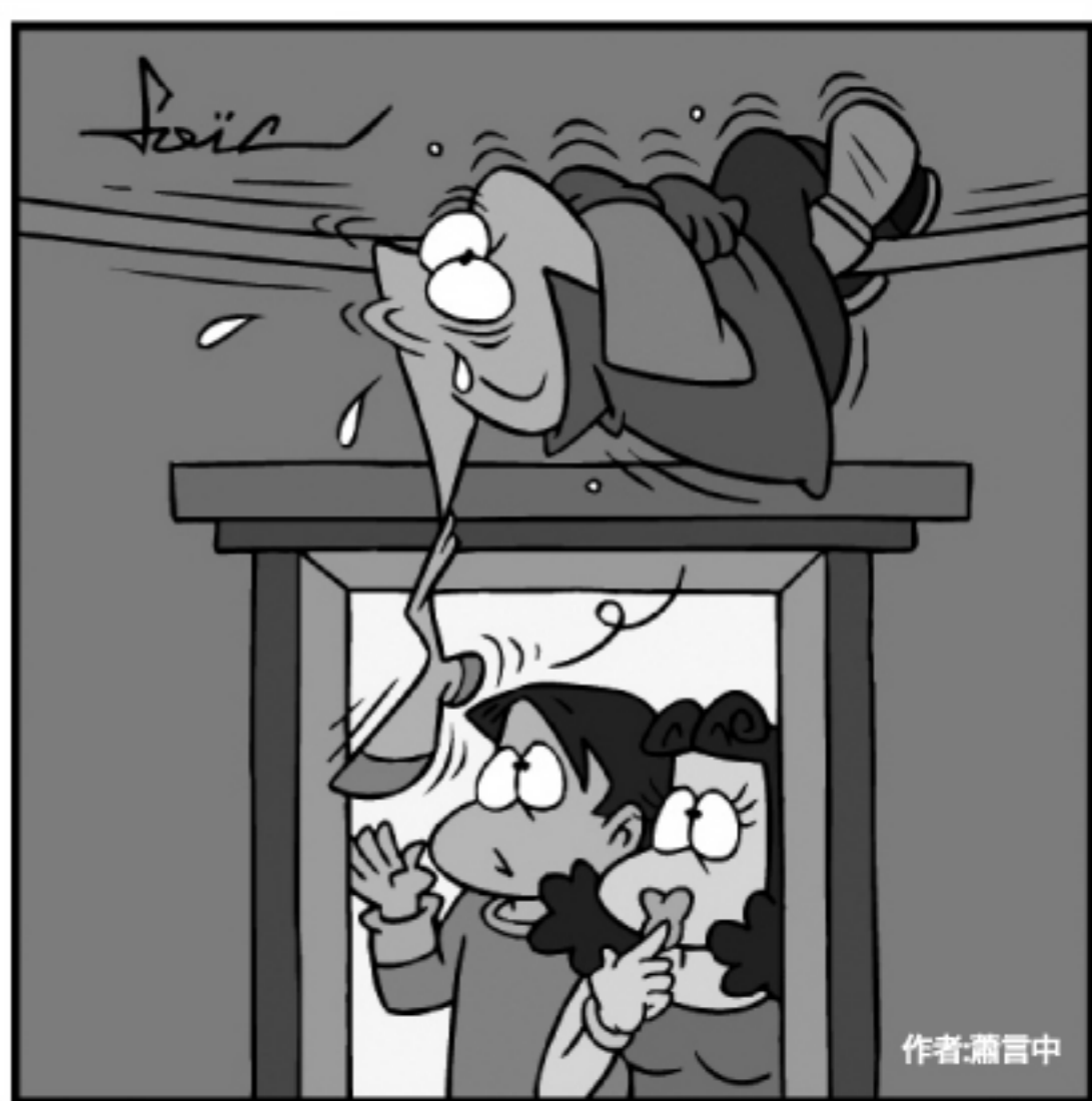
親愛的... 是在陽台「曬被褥」嗎?! ... あっ、くつした!!!! お前が干したの??

我想我也不會這麼認真的去辨識我所使用的洗髮精味道。對於自己的本能知覺訓練，倒很有幫助。經過數次的訓練以後，我漸漸的習慣黑暗中的泡澡模式，在黑暗中反而更使人放鬆，這也是很令人意料不到的效過喔。讓我更加愛上泡澡的感覺，但千萬別因此著涼了。(本報記者賴月女)