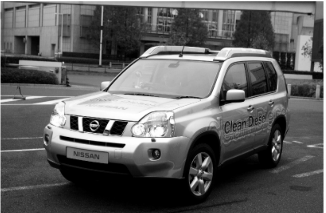
▲日産自動車が発売するクリーンディーゼル「エクストレイル」

た規制をクリアするために開発投資がかさんでいる。これを回収するためには、ディーゼル乗用車が普及していないアメリカや日本でも販売し、開発投資の負担を軽減する必要がある。クリーンディーゼル乗用車は地球温暖化防止という建前と同時に、日本車メーカーの負担軽減による国際競争力強化につながるから、政府も本格普及に向けた支援を進める方向にあるのだ。また、クリーンディーゼル乗用車の普及に石油業界も期待を寄せている。日本の石油市場は、輸送用トラックの動きが景気低迷で悪いことなどのため、軽油がだぶつき気味だからだ。軽油をガソリンなどへ転換する場合もあるが、軽油をそのまま売ったほうが効率的であるため、日本の石油元売り各社からも、ディーゼル乗用車普及への要望論が出ている。クリーンディーゼル乗用車は構造として、電子制御による燃料の高圧噴射、大容量排ガス循環装置などで燃焼をコントロールし、排ガスに含まれる悪質成分を除去、さらに酸化触媒・DPF(微粒子除去装置)・リーンNOx触媒で排ガスを徹底的にクリーニングする。排ガスのクリーン化に際しては、その前段で行うエンジンの燃焼コントロールが重要な要素を持つが、鍵となるのが燃料噴射で、その制御技術開発に取り組むことができるのは、日本車メーカーではいすゞ自動車だけで、ほとんどがドイツのボッシュに依存している。国策として進めようとしているクリーンディーゼル乗用車の普及だが、その開発の心臓部は、ドイツ・ボッシュに握られているという現実がある。