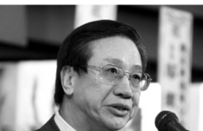
▲台北駐日經濟文化代表處副代表羅坤燦