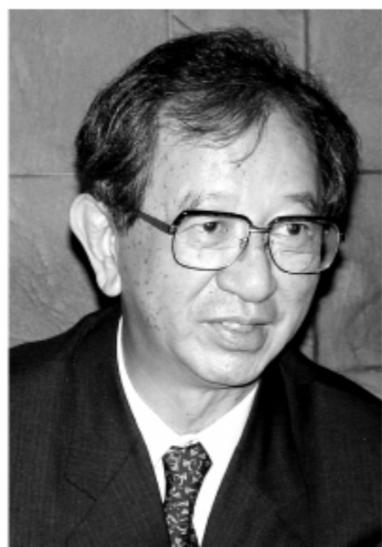
▲諾貝爾化學獎得主、前中央研究院院長李遠哲二十二日在東京表示，期待下任台灣總統具有「高度應變和解決問題的能力」，並在處理兩岸問題上代表大多數台灣人民的意見，他也強調制衡在民主社會的重要性。

此下任總統必須代表大多數台灣人民的利益，將是選民的重要考量。 李遠哲表示，期待聽兩位總統候選人的辯論，看看他們的政見。他對應該保持中立的看法持否定態度，指出他最反對的是讀書人被批評為「百無一用是書生」；他說，知識份子應關心社會。在未明確表達為誰「背書」的情況下，李遠哲對民主進步黨參選人謝長廷的整合能力表示肯定，指出日前曾與謝長廷晤談，談到有關能源等問題，認為他的整合能力很不錯。 李遠哲說，在民主國家，人民是國家的主人，人民的監督很重要，有關制衡的問題，最後監督的還是人民。 對於是否和中國國民黨參選人馬英九見面的問題，李遠哲表示，只要馬英九想和他交換意見，他是願意的。但他也指出，他和謝長廷見面的第二天，馬陣營就表示不會跟進。他也強調，不論是誰，只要對國家的將來和人民福祉關心，他都樂意與他討論。李遠哲表示，若是他的看法能發生影響，會很高興，因為他從年輕時代就希望成為一個好的科學家，貢獻社會，同時也希望看到公平合理的社會，強調不應