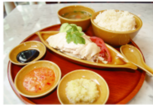
▲「シンガポールチキンライス」