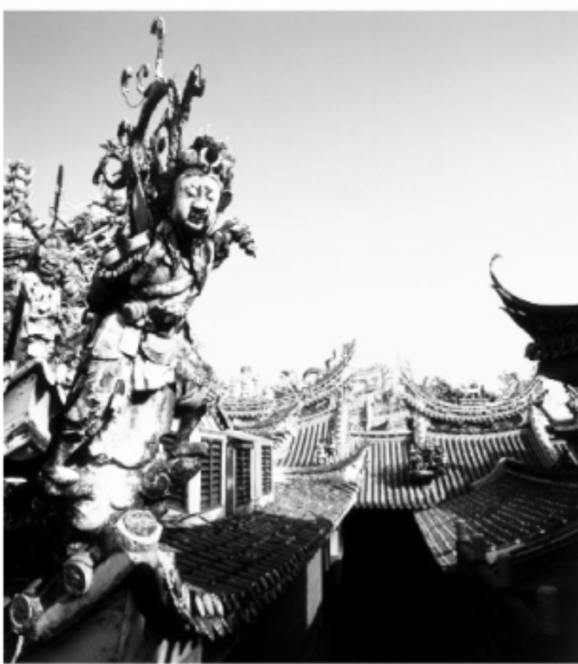
▲写真説明:台南県北門廟

される予定で、地元産業である蘭をブランド化して、世界に売り出そうと意欲満々だ。 自然が好きな人には、台南七股の潟湖をお勧めする。潟湖は、約1600ヘクタールの面積があり、300年前の台江内海遺跡は内海仔と呼ばれる。台南県で繰り上げられる年中行事を通じて、当地の風土と暮らしに触れる事が出来る。また、夏の白河鎮を訪ねると、一面に蓮の花が咲いていて、南部風情が溢れる町だ。 レトロの観光地が好きな人は、新營製糖鉄道を訪ねてはどうかだろう。新營は、台南県の県政府所在地であり、昔は製糖の町として活気を帯びていたが、不況の中で製糖工場は閉鎖された。しかし、鉄道は近年、観光用に変身