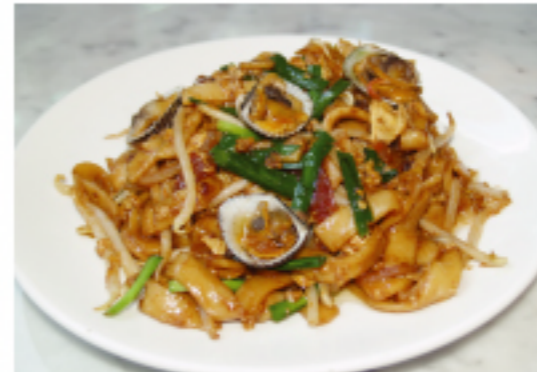
▲「海鮮陳年生酒焼きそば」