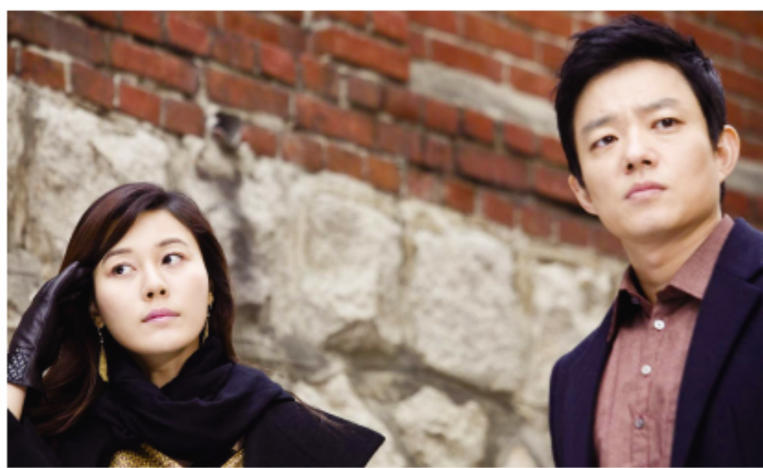
▲韓劇「On air」二十日晚間將至台灣取景。圖為韓國製片公司K Dream提供的金荷娜（左）及李範洙（右）在「On air」的劇照。

也會全方位在亞洲掀起台灣觀光潮，除可瞭解台灣海外遊子的思鄉之情，也會為觀光局啟動「2008-2009旅行台灣年」之際，注入一劑強劑，必將帶動赴台觀光新高潮。據悉，宋允兒等「On air」的主要演員及編導攝製小組，將於二十日搭乘長榮、華航及韓亞航三個班機飛往台灣，與先遣隊伍匯合，將成為一支八十多人的團體。他們會將台北一零一大樓、故宮博物院、圓山大飯店、九份、太魯閣、墾丁國