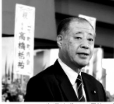
▲衆議院議員玉澤徳一朗

新年のこの集いは、台湾と日本の友好を考える両国の人たちが集う会としては、大変に大きなものだが、誰もが台湾の隣国、中国をかなり意識しており、特に質が高いITと経済において、大陸中国のはるか先を走る台湾、そして日本との友好関係が極めて