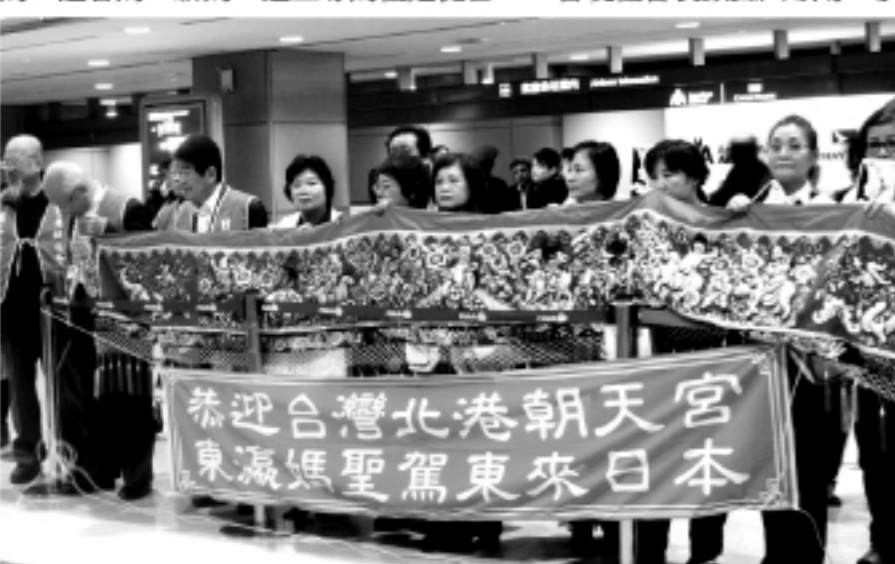
▲在成田機場等候媽祖降臨

の小さい空間だが、30年前、台湾から日本きて生活を始めたとき、その難しさが深く伝わる場所だと思ふ。現在、百玄宮の中に師姉は、この道場で生まれた30年の文化とともに、四方から縁がある人々への広めに専念して頑張りたいと話していた。東京百玄宮 東京都新宿区大久保2-32-6北京荘105 TEL. 03-3232-7892