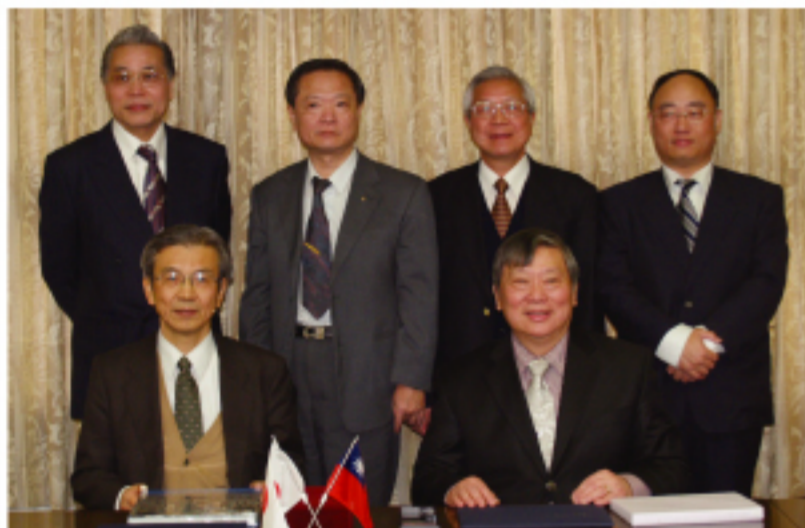
▲前列左: 益田隆司・国立電気通信大学学長、右: 呉重雨・国立交通大学校長後列右から方永壽・交通大学工学院院长、葉清發・台北駐日経済文化代表處科技組組長、莊紹勳・交通大学国際事務處国際課、国立電気通信大学総務課国際企画係長・久保木健

信・情報分野の強さを評価した。また、「正式に締結したことで両校の教授と学生の研究交流をより一層盛んにしたい」となど、今後の交流が深まることへの期待を表明した。交流を深めるための具体的な計画は、現在、検討している最中で、呉校長は「まだ正式な案が出ていないが、これからダブル学位を設置する可能性もある」と話している。 交通大学は、台湾の新竹市(台北の南西50km)にあり、国立台湾大学、国立清華大学とともに台湾有数の学府として知られている。中央に大きな湖を有する広大なキャンパスの中に理学部、工学部など11学部を配置し、学生数約29,000人、研究者数約2,800人の総合大学である。 電気通信大学は、東京都調布市にある国立の理工系単科大学で1949年に創立された。電気通信学部、大学院電気通信学研究所、大学院情報システム学研究所を有する。学生数約5,500人、教職員数501人の規模である。