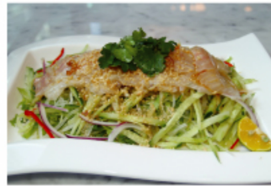
▲「シンガポール風刺身」