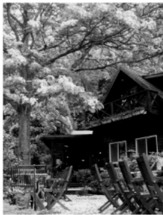
雪のように散らしている桐花の花びら レストランおよび民宿の情報を提供し、さまざまな桐の花見ができるコースなどを推薦している。また、台湾新幹線の新竹駅と台中駅では桐の花をモチーフにしたインスタレーションも展示されている。

2008客家桐花祭: http://tung.hakka.gov.tw/ (中国語のみ) ガイドブックのダウンロードには: http://tung.hakka.gov.tw/hakka/internet/doc/doc.aspx?did=43&uid=43#