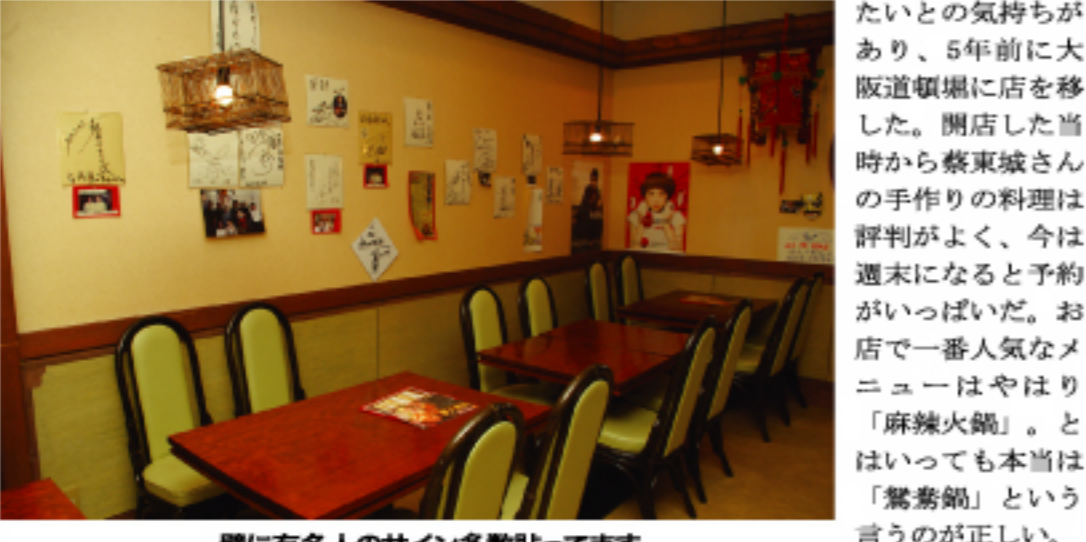
壁に有名人のサイン多数貼ってます