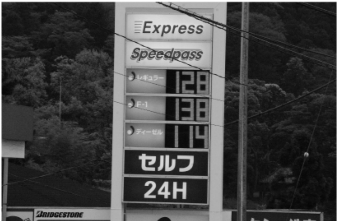
ガソリン税、再値上げ後の混乱が要注意

ラーの経営戦略なども破綻をきたす。さらには海外から日本の中古車を買付けにきている中古車輸出業者も、商売の見直しに迫られる。日本の中古車は、新車登録から5年経つと、国内では大きく市場価値が下がるが、走行距離が10万km以内であることが多いため、新興国や途上国の市場で人気が高かった。このため、ロシア向けを中心に中古車輸出は年間150万台近くに達する規模に拡大しているが、保有車両の減少にともない、輸出車両を集めることが困難になってくる。一部の中古車輸出業者は、海外生産拠点として日本車メーカーが基盤を固めたタイなどに拠点を移すことなどを検討し始めるなど、足早な動きもでてきた。