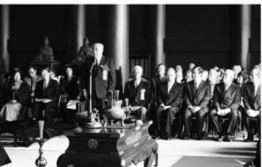
駐日代表許世楷が演説

【本紙記者三田典玄】2008年4月27日、東京・御茶ノ水にある「湯島聖堂」にて、財団法人斯文会(しぶんかい)の主催による平成20年度の「孔子祭」が行われ、台北駐日經濟文化代表處の許世楷代表が來賓として招かれ、日本の學術の頂点に立つ人々に向かって、挨拶した。許世楷代表は、大正殿での式の挨拶の後、施設内の「斯文会館」にて、「台日関係の近況」と題して記念講演会を行い、聴衆の多くの賛同を得た。孔子祭は學問の神様として日本では名高い。