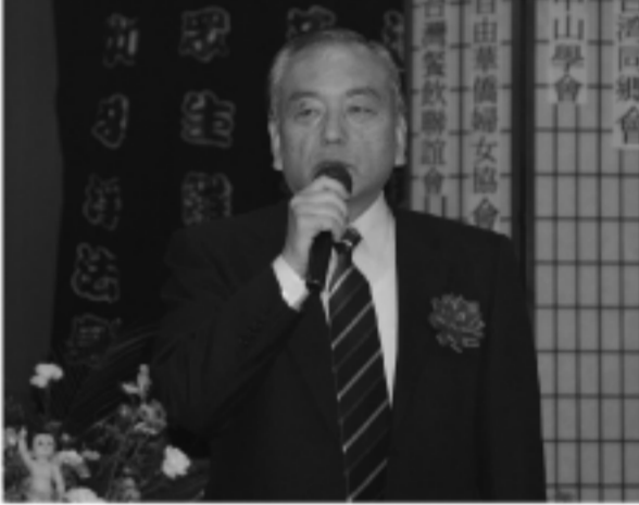
只要我們行為方正、仁人愛物、必然會得到庇蔭。祝福大家在佛祖的光環之下、能過著幸福且圓滿的生活」。

因此、浴佛節是提醒我們時時保有一顆清淨心。慶祝浴佛節、我們應觀照自己的心是否清淨、這是非常重要的。願以浴佛功德、祈求世界和平、民生樂利、並迴向法界一切眾生、共植福慧。