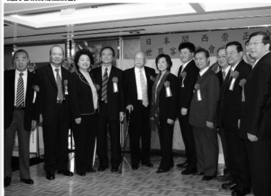
現場來賓大合照。(於關西崇正公會)