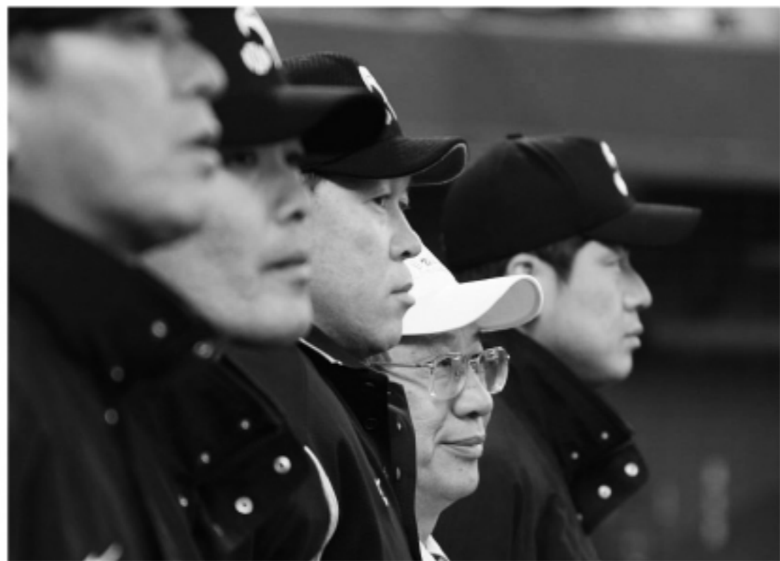
駐日経済文化代表處羅坤燦副代表(白いキャップ)

【本紙記者三田典弘】2008年4月26日、埼玉県所沢市にある西武球場で、パ・リーグのライオンズ・オリックス戦が開催された。今年西武ライオンズ球場とそこで行われる試合のスポンサーの1つとして、台湾政府観光局が出ており、そのために台北中日経済文化代表処の羅坤燦・副代表が、始球式を行うこととなった。以下はその写真である。 また、球場外の入り口には、台湾観光局がテントを出しており、台湾のさまざまな観光の案内を行っていた。