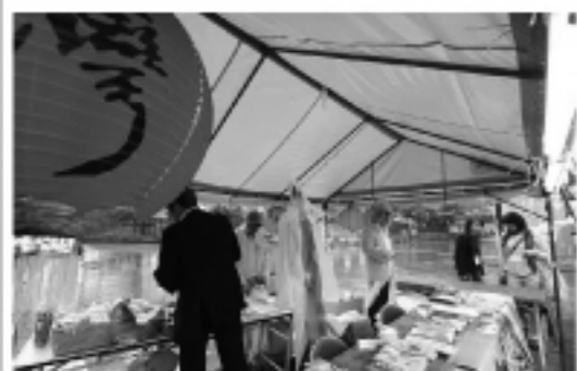
球場外の台湾観光ブース