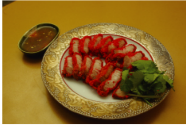
紅焼肉(赤いチャーシュー)