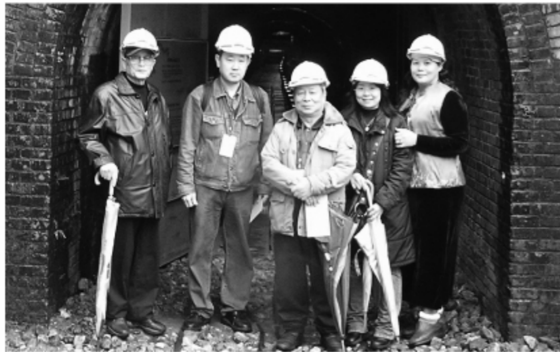
金瓜石5番坑入口にて。左から2番目が筆者

山の表面から掘り取るいわゆる露天掘と、下部から坑道を掘って内部から掘り取るものと2つの方法で、以前は共に人力によって採掘していたが、現在は、大部分機械力によって採掘している」。