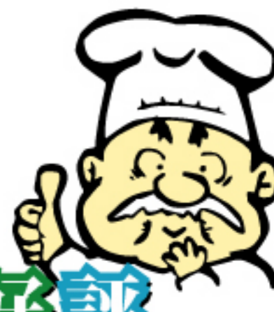
圖誌の試食用も用意していますので、是非立ち寄ってください!