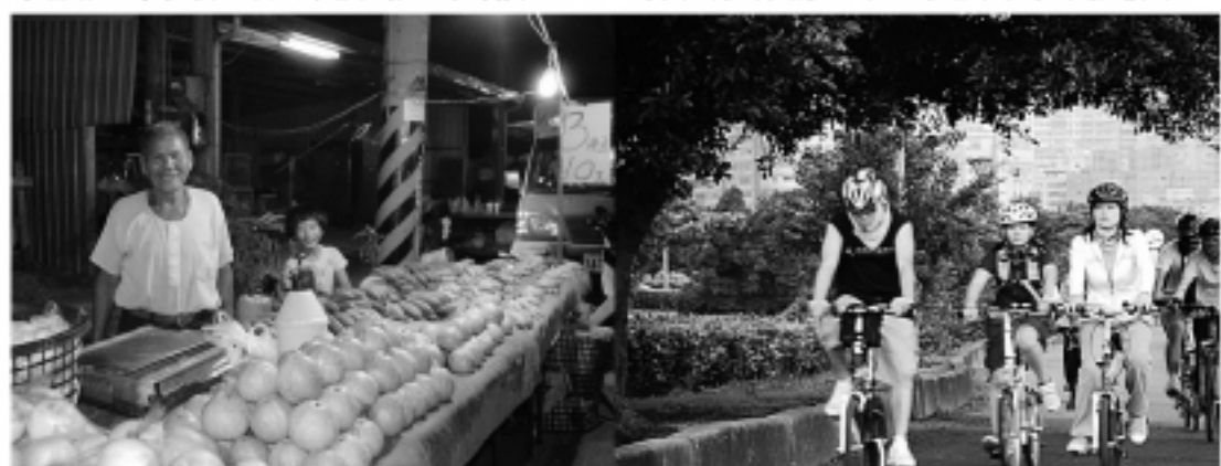
按下感動快門 24小時攝影記錄台灣

這次活動有全國各地網友參與，已經交稿者的作品，畫面就分佈在台灣十二個縣市的二十三個城鎮。從凌晨一時起，延續到昨天深夜。沿著時序，包括北部的豆漿店店員「少年羅阿嬤」，新店與泰山傳統市場的肉販、台北與高雄果菜批發市