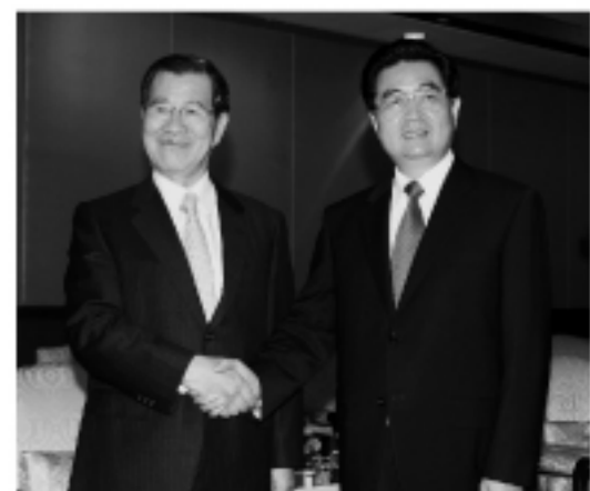
出席博鰲亞洲論壇的副總統當選人蕭萬長(左)與中國國家主席胡錦濤在開幕式結束後會談。

此行，蕭萬長所受到的接待規格也是外界關注焦點，蕭萬長與媒體會談時說，他在博鰲論壇開幕與晚間的文藝表演都坐在