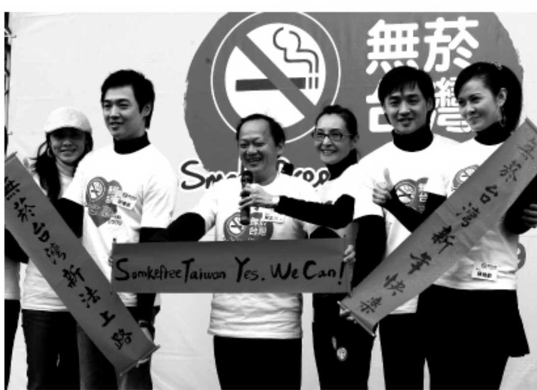
台湾は1月11日からタバコ煙害防止法が施行される。日中およびオールデー営業のカラオケボックス、インターネットカフェ、マンガ喫茶等では室内全面禁煙となった。但し、夜9時から営業開始の18歳以上のみ入場可能なバー

【本紙】「タバコ煙害防止法」新規定が1月11日より、台湾全土で正式に施行された。新規定では、高専以下の学校、医療機関は室内外全面禁煙、政府機関は3人以上が共用する室内事務室は全面禁煙、レストラン、ホテル、商業施設等の場所では喫煙スペースを除き禁煙が義務付けられる。 新規定によると、禁煙場所で喫煙した者は最高1万元(約2.7万円)の罰金となり、禁煙場所に禁煙標識を設置しなかったり、喫煙器具等が設置されていた場合は、当該場所責任者に最高5万元(約13.5万円)の罰金が課せられる。 新規定施行後、鉄道、バス、タクシー、飛行機の車内(機内)および屋根のある公共交通ターミナル、室内または地下の駅ホーム等はいずれも全面禁煙となった。しかし、路上または騎楼(半開放式アーケード)にあるバス停やバス待合所は喫煙可とした。 レストランについては、法に基づいて設置された独立した空調設備のある喫煙室以外は、室内全面禁煙が実施された。また、半開放式のカフェ、飲食店、屋台のテーブル席等の屋根のない席では喫煙可とした。