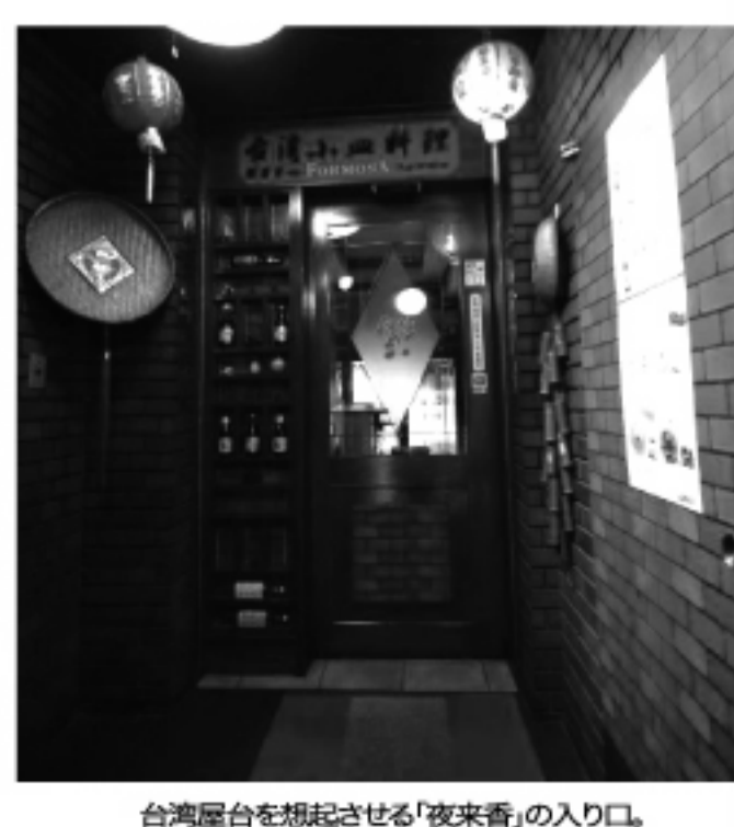
台湾屋台を想起させる「夜来香」の入り口。

ているので、酒飲みには楽しい。「お酒はどうも、...」という方には、マンゴージュースなどもとても人気だとのこと。 なにかと気ぜわしい通学や通勤の帰り道、仕事場の友人たちとちょっと一杯、あるいは夕食をこの店で取るにも、気軽に入っていける明るい気さくな雰囲気がいっぱい。また、お店の内装はすべて動かせるようになっていて、70名くらいからの宴会もできるようになっているという。長く飲食店をやってきた人らしい、自由の利くお店の作りにもなっているとのこと。 おいしい料理とおいしいお酒は語らぬの場を明るくする。夜来香はそんな当たり前のことあらためて感じさせてくれるお店だ。