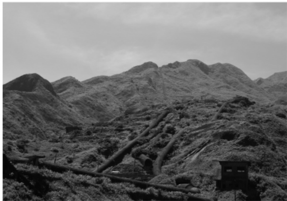
山に伸びる鹿煙道。

1945(昭和20)年8月、日本は敗北。太平洋戦争が終わり、台湾から日本人は去っていく。金瓜石では、戦後数年間は、無政府状態になり、台湾人の盗採が行われたという。「一晩で1ヶ月分の給料を得ることもできた」と盗採者の一人は言う。1948年1月、新たに国営資源管理委員会の下で、台湾金銅鑛務局が成立。