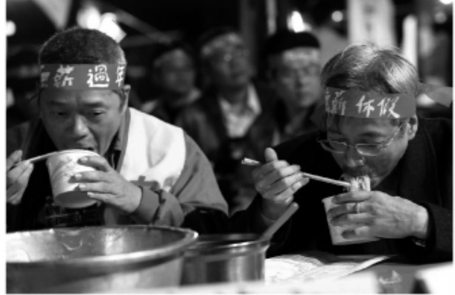
労働者団体の「團結工聯」が1月17日、台北市内の「自由広場」で失業者のために忘年会を開いた。簡単な食事をただで提供していた。

【本紙】行政院主計処が1月22日に発表した労働力に関する統計によると、2008年12月の失業者数は54.9万人であり、前の月より4.2万人増加し、失業率は5.03%だった。失業率は前月比で0.39ポイント上昇し、前年同月比で1.20ポイント上昇した。季節変動の要素を調整後の失業率は5.01%であり、前月比で0.39ポイント上昇した。 08年12月の就業者数は1,035.4万人であり、前月比で5.6万人(0.54%)減少した。前年同月比では、2.7万人(0.26%)減少した。12月の労働参加率は58.20%であり、前月比で0.15ポイント減少した。 08年の平均失業者数は45万人で、前年比で3.1万人(7.42%)増加した。年間平均失業率は4.14%で、前年比で0.23ポイント上昇した。平均就業者数は1,040.3万人で、前年比で10.9万人(1.06%)増加した。年間平均労働参加率は58.28%で、前年比で0.03ポイント上昇した。 世界主要国・地域の最新の失業率は、ドイツ7.4%、米国7.2%、カナダ6.6%、英国6.0%、香港4.1%、日本3.9%、韓国3.3%、シンガポール2.2%となっている。