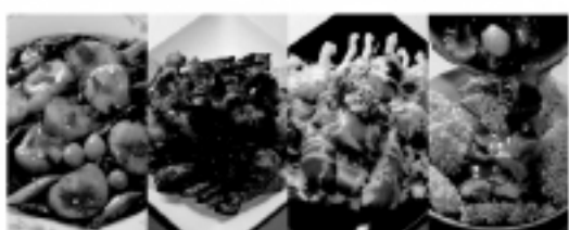
台湾人シェフが調理した本格的な台湾料理、食べ放題コースなどある。