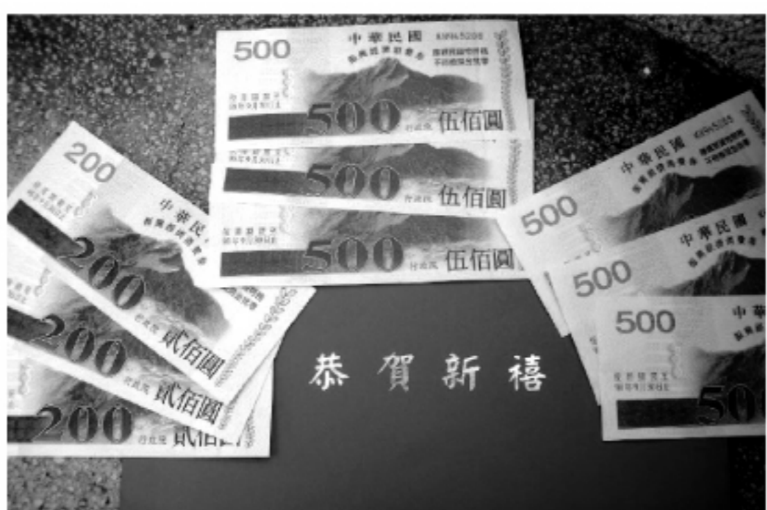
台湾の「消費券」(定額給付金)が1月18日から配布し始め、その経済効果が注目される。

【本紙・青田信吾】08年度の第2次補正予算が成立し、賛否両論あった定額給付金の支給が決まった。雇用不安が広がり、さらに景気が悪化することが見込まれるため、給付金が支給されても消費に回らず、貯蓄に回す日本人の割合が多いと見られる。一方、台湾では日本よりひと足早く、経済刺激策として政府が「消費券」の配布を始めた。日本では評価が低い定額給付金だが、「消費券」は台湾人の高い評価で受け入れられている。国民性の違いが鮮明だ。 日本で定額給付金への評価が低いのは、1999年に日本政府が財源を負担して「地域振興券」という台湾の「消費券」と同様の商品券を配布したことがあるからだ。このときは全国民でなく、15歳以下の子供、満65歳以上で市町村税の非課税者、あるいは高齢福祉年金・生涯基礎年金の受給者などと配布対象を絞り、1人当たり2万円、総額6194億円分を配布した。当時の経済企画庁の調査によると、その経済効果はわずかで、名目GDPに占める個人消費を0.1%、約2000億円分押し上げたにとどまった。受け取った国民の3分の1は消費に回したものの、残りは通常の生活費に地域振興券を活用し、手元の生活費分の現金を貯蓄に回したと見られるためだ。今回の定額給付金も貯蓄に回す割合が高く、個人消費を大きく押し上げるまでの効果はないと見られている。 定額給付金は1人当たり1万2000円、総額約2兆円。65歳以上の高齢者と18歳以下の子供には8000円上積みして2万円を支給する。夫婦と子供2人の家庭では総額6万4000円。増額はありがたいものの、子供がいる家庭は塾などの教育費に負担がか