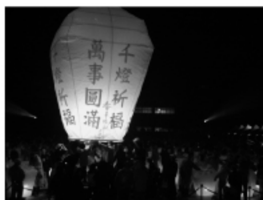
暗い夜空に舞う天灯が、新しい一年の願う事が叶ってくれそう め、願い事と名前を注意深く天灯に書いて、風と共に空に飛ばす。天灯が高く上がるほど、事業がうまくいくとも言われている。

「南の爆竹、北の天灯」と言われるように、元宵節に行われる行事としては、台南の塩水で催される爆竹祭りと、台北県平溪の天灯祭りが有名だ。台北県の東北にある平溪郷は、昔は炭鉱で栄え、衰退しましたが、近年は年に1度の天灯上げイベントによって、人々をこの小さな村に引き付けています。毎年の元宵節には、観光客が平溪郷に押し寄せ、地元で最も文化的な特色のある天灯を買い求め、願い事を記して空に飛ばす。天灯が高く上がるほど、事業がうまくいくとも言われている。