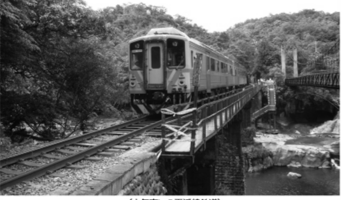
(人気高いの平溪線鉄道)

ユースホステルに宿泊しながら、台湾本島周遊を達成をめざす。期間中は莒光号・復興号・区間(快速)車・普通快速車の自由席に何度でも乗車可能。対象年齢は15歳以上35以下。 詳細は「中華民国国際青年之家協会」のホームページhttp://www.yh.org.twで、または同協会+886-2-2331-1102、+886-2-2331-2655まで。