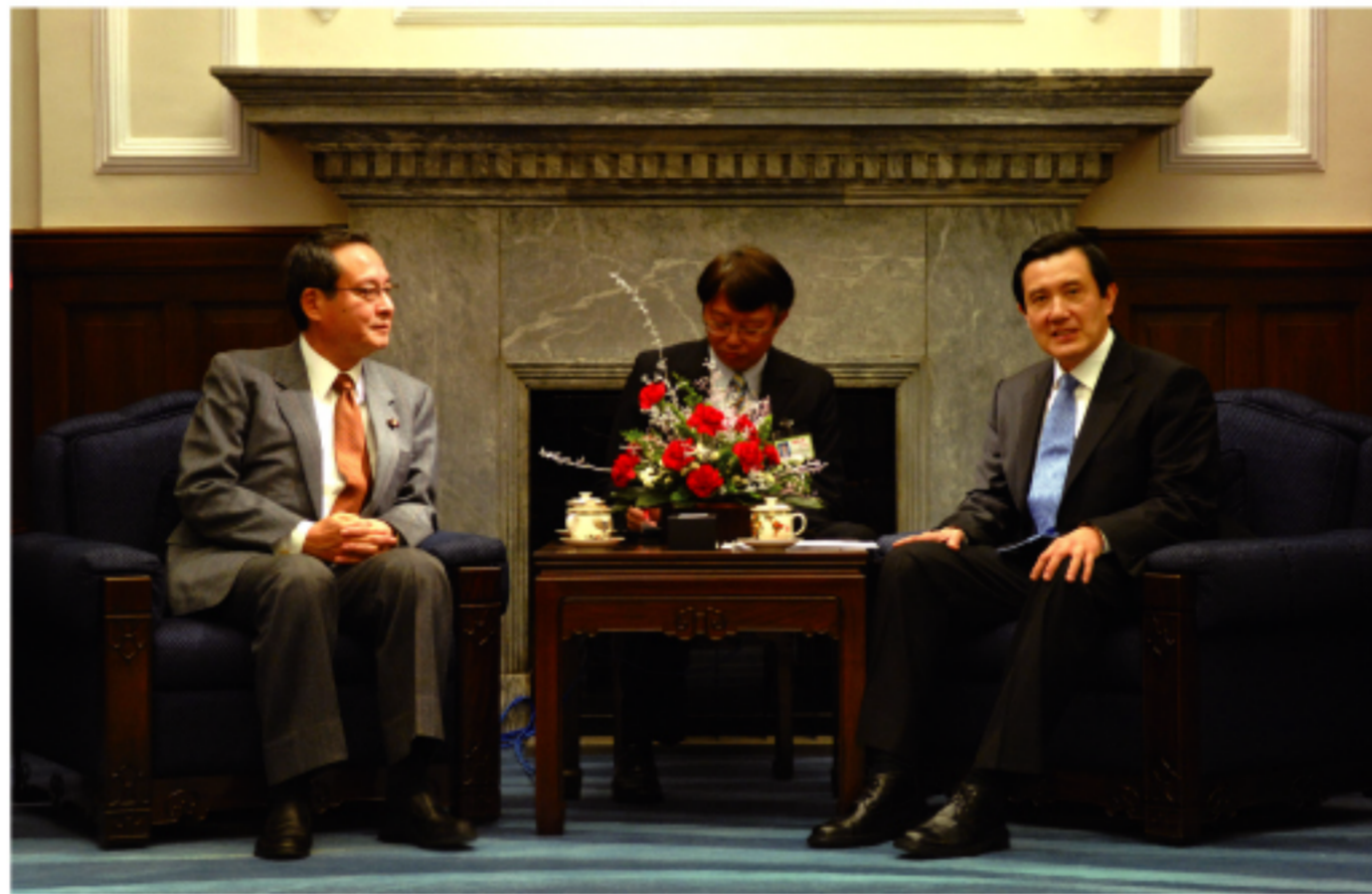
台湾政府は2009年が「台日特別パートナー関係促進年」を宣言した。写真は去年12月28日、總統府で日華懇話会理事長の藤井孝男参議員と面会した時のもの。

観光交流の方面について欧部長は、羽田空港の第4滑走路が完成する2010年に新しい航路を開通したいとして、今後台北松山空港と東京羽田空港を結ぶ