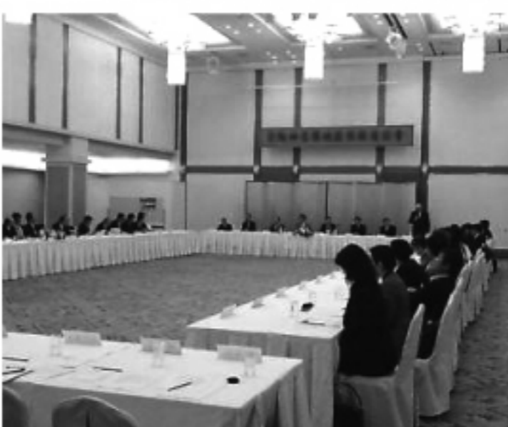
ロイヤルオークホテル&ガーデンズに80人以上が参加

当日は、地元の婦人会の人員も駆けつけ、会議に華を添えた。また、懇親会の席では、他地域から駆けつけた会員も挨拶。「大変勉強になった。他地域にも京阪神名地域のような活発な活