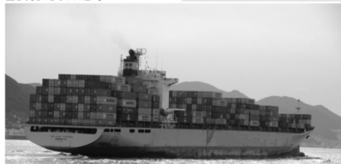
大型コンテナ船による、活発な交易が進む