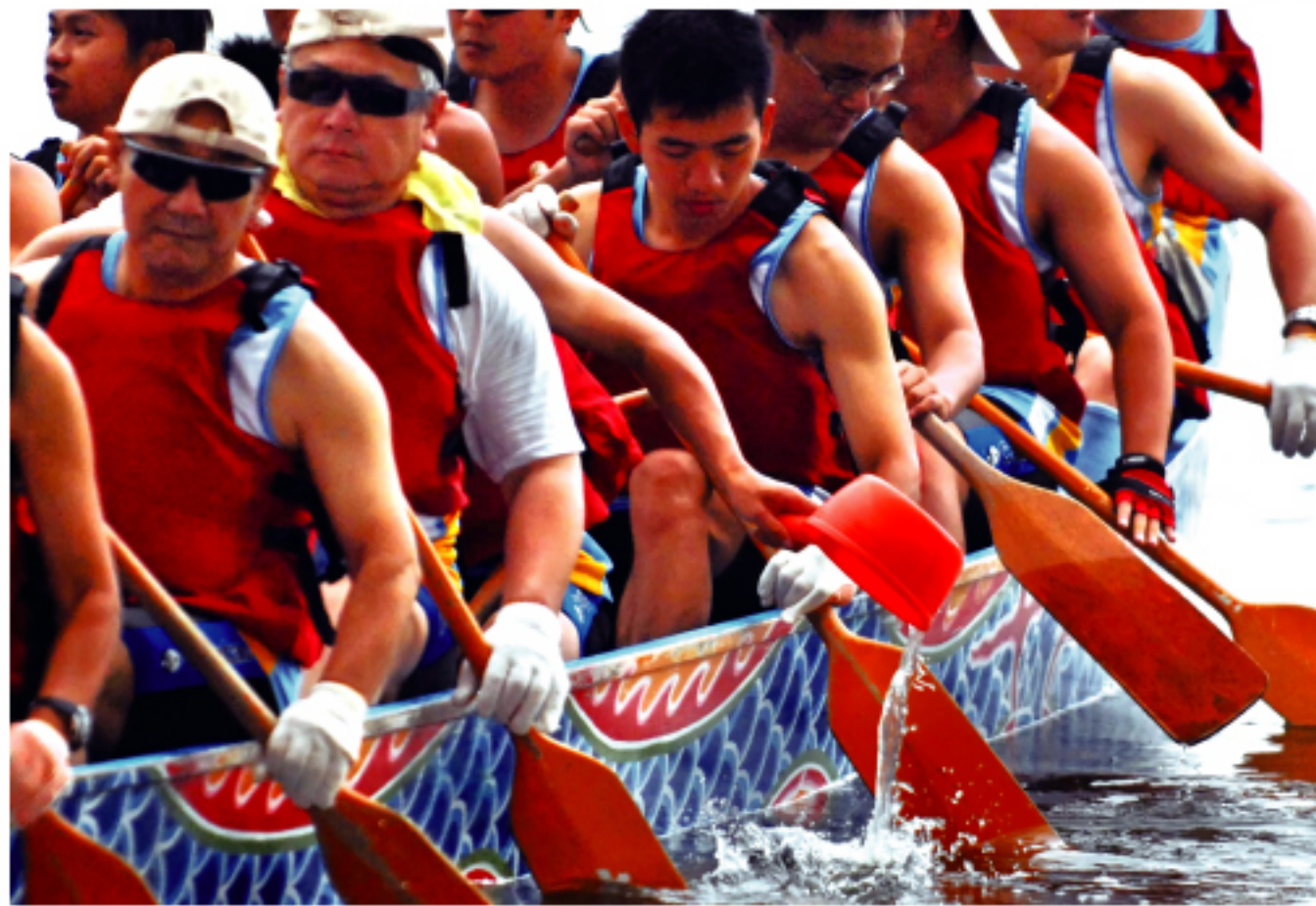
台湾の旧暦5月5日は今年6月28日にあたる。台湾では龍型の船で競走する伝統がある。台湾の夏の風物詩だ。話(3G)に移り、4億人を超える携帯電話契約者を抱え、世界最大の移動体通信事

基幹産業育成を最大の課題とする中国は昨年、移動体通信事業を再編し、中国移動および中国電信(チャイナテレコム)、中国聯通(チャイナユニコム)3社で競わせることにした。中国電信は、中国移動と同じく中国郵電電信総局(チャイナテレコム)をルーツとする国家直轄企業で、分割時には中国電信は固定電話、中国移動は移動体通信と分かれてい