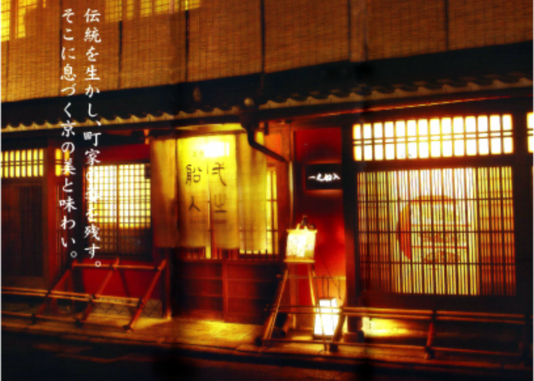
伝統を生かし、町家の趣を残す。そこに息づく京の美と味わい。