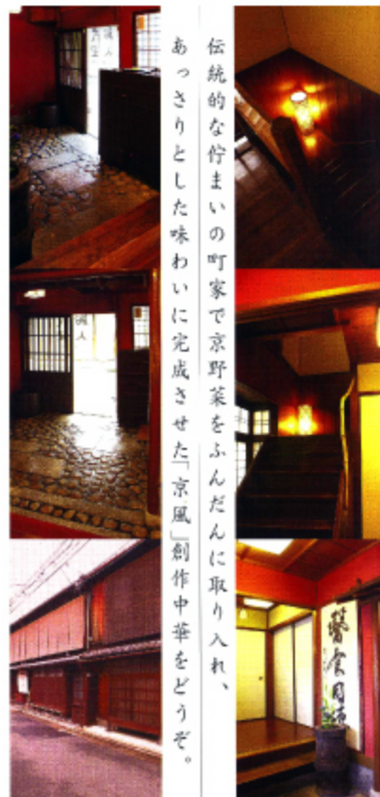
伝統的な佇まいの町家で京野菜をふんだんに取り入れ、あっさりとした味わいに完成させた「京風」創作中華をどうぞ。 食材が使われ、吟味された彩りに目を楽しませてもらった。 また、取材に訪れたのは、五月でも小雨降る肌寒い一日。添えられたトマトペース

祖父の代から横浜中華街に居を構え、早くから料理の世界にいました。四川から入り、広東や上海、湖南の料理を学びましたが、台湾料理ももちろん大好きで、大切にしています。横浜から沖縄に移った後、創作料理店「一之船入」を高瀬川沿いにオープンするため、京都に移りました。 ——京都を選んだ理由は何ですか。 井戸から、軟水が豊富に湧き出る点でしょうか。軟水はご存知のとおり、料理の素材を引き立てます。また、ここでは有機栽培を行っている農家と提携し、吟味された食材を調達できるのも利点ですね。有機野菜といっても、排ガスに晒された産地から出荷されているばい意味がありません。実際に、その土地まで足を運んでみることは大切です。幸い、京都は誇りを持った農家に出会えます。また料理人として、世界へ出ていくチャンスが京都にはあります。他の文化とともに、食文化も世界に誇れるもの。ここで創作を続けていくことは、なによりの喜びとなっています。 ——今年八月に台北である「世界廚芸コンテスト」で、日本代表として出場されるそうですが、 シンガポールやマレーシア等から、レベルの高い料理人が集うコンテストですから、選ばれたのは光栄です。日本代表として和のテイストをミックスし、ペニコウジなど台湾にある旬の素材をふんだんに活用し、中華の枠を超えた「ヌーベルシノワ(現代の中華)」を作ってみせます。独創的過ぎれば、創作を理解してもらえないかもしれませんが、世界を相手にするので、未知なることにどんどんチャレンジしていきます。 ——今回、出された八宝菜には一四品もの