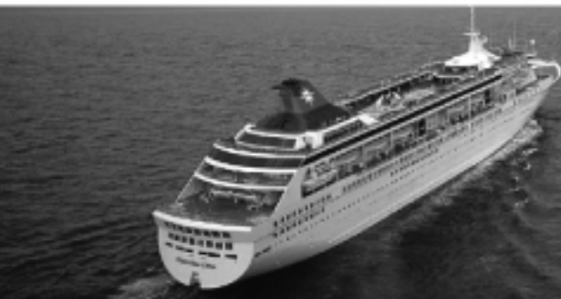
大型客船スーパースターリブラ、石垣にも周航する

現在、沖縄に来る外国人は毎年約一五万人。その六〇%以上は台湾人で、一日二往復しているチャイナエアを使って半分の約五万人が訪れ、さらにその半数はスタークルーズ社(本社・マレーシア)の大型客船スーパースターリブラ(乗客一五二〇名、乗員九〇九名)でやってくる。同船は海が安定する夏季に、三日または五日間で基隆と那覇・石垣を結ぶ。「三万円前後からある豪華クルーズは、安価でお得」(南沖縄観光コンベンションビューロー主事・城間氏)として学生等にも人気のツアーで、終日自由行動となる沖縄寄港時には、中国語版のマップや観光資料が配布され、観光資源やお土産の紹介がされ、周辺の経済効果は大きい。今後、沖縄では中国の観光客にも