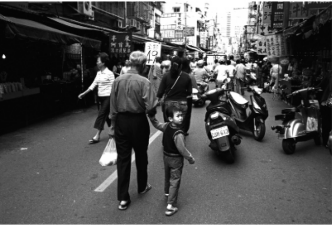
写真展「台湾街角」、横浜市内に開催する。

東京都で来年、開催される第20回世界少年野球のプレ大会「フレンドシップ東京大会」が7月29日、大田区の大田スタジアムで開幕し、始球式で打席に立つ石原慎太郎知事に、世界少年野球推進財団の王貞治理事長が打撃指導をした。 王氏は「ボールをしっかり見て」と身ぶりを交え石原知事にアドバイス。石原知事は「必ずホームランを打つ」と真剣勝負で臨んだ。 始球式のマウンドに登ったのは、かつてロッテのエースだった村田兆治同財団専務理事(59)。王氏のアドバイスを受け、やる気満々の石原知事を知って知らずか、村田専務理事は始球式前のインタビューで「全力投球で挑む」と宣言。 そして現役ながら左足を高く上げる「マサカリ投法」から容赦ない高めの剛速球を繰り出すと、石原知事はあえなく空振り終わった。 今大会は東京の2016年夏季五輪招致の支援も目的としており、キャッチャーを務めたのは招致大使で元ヤクルト監督の古田敦也氏。ときならぬ豪華メンバーの競演となった。