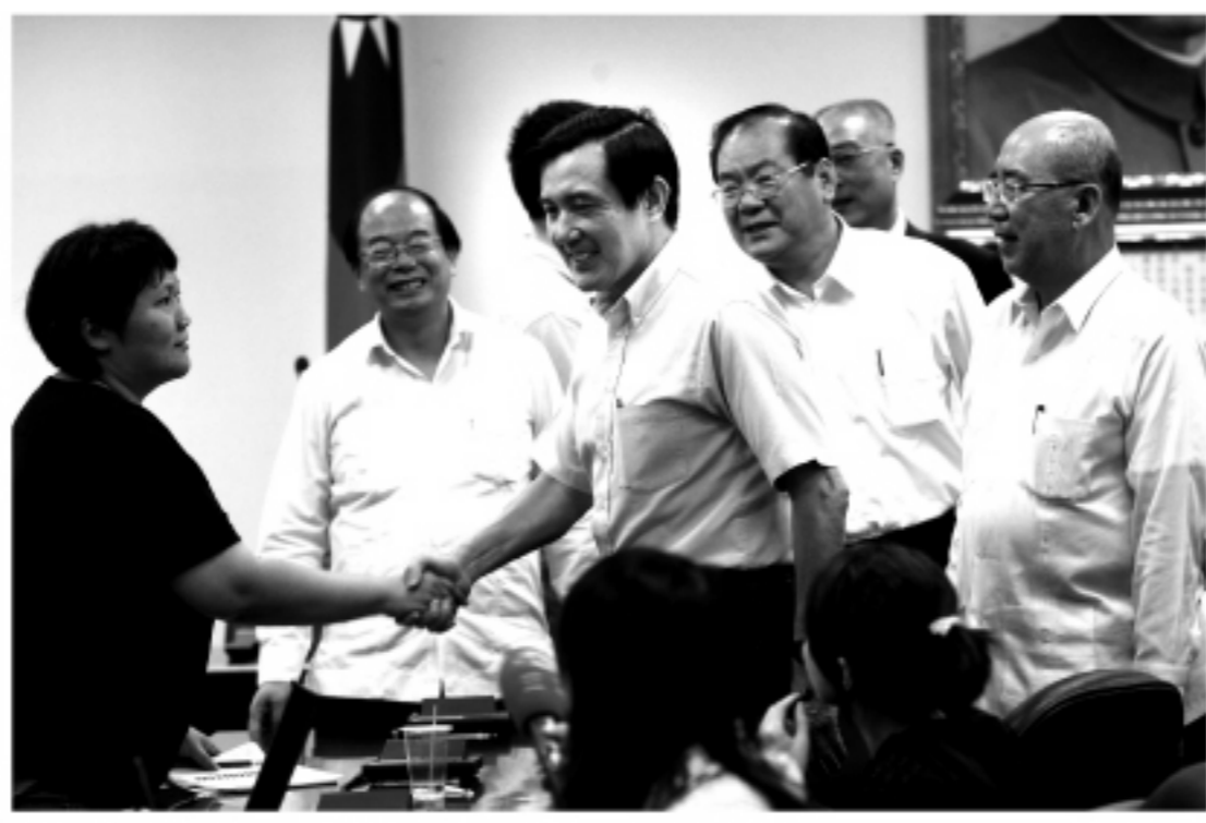
馬英九總統が国民党主席と党代表選挙に当選

7月26日、中国国民党(以下、国民党)は、党主席と党代表選挙を全国519カ所に投票所を設け、午前8時から午後4時に実施し、即日開票の結果、馬英九總統が28万5,354票で、93.87%の得票率を獲得し、国民党主席と党代表に当選した。 同選挙の結果については呉敦義・国民党秘書長が発表し、同選挙の有権者総数は53万3,739人、投票者数は30万8,462人で、投票率は57.79%、無効票数は1万7,619票だった。 同選挙で当選した馬英九總統は、同日8時20分より党選挙事務所において記者会見を開き、「国民党が全面的に執政するからには全面的に責任を負わなければならない。このたびは總統ならびに国民党主席になり、この獲得した資源で台湾の将来を十分に計画し、少なくとも台湾海峡のために数十年間の平和をもたらすようにし、台湾を転換の好機にして、変動する国際情勢に適応させていかなければならない」と述べた。 さらに「党務改革強化は一刻も猶予できるものではないが、これには自分から行う必要がある。そのため、今後指名する党役員は品行方正で清廉であり、尚且つ政務に熱心であり国民を愛し、さらに理想を持ち道義を重視するなどの原則に合致した人物でなければならない。これらはスローガンのみに終わらせるものではなく、党役員指名の基準とするものである」と説明した。 また、馬總統は「連戦・名譽主席が4年前に胡錦濤・中国共産党主席と平和発展5項目の合意を達成させ、国民党第17回全国代表大会において、それを国民党政治綱領に盛り込んだ。私は今年9月12日に召集する第18回全国代表大会の中でも、この平和発展5項目を政治綱領に入れることを建議し、これは重要な歴史的な公約であり、我々はこれを忘れてはならず、必ず実行すると述べた。 続けて、「『現実を直視し、相互信頼を確立し、争議を棚上げし、ウィンウィンの関係を創出していく』の原則の中で、兩岸の平和と繁栄を引き続き追求し、台湾を主体とし、国民にプラスとなるようにしていく」と強調した。