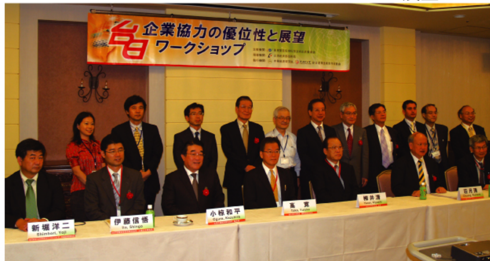
台日の有識者たち、ここからアライアンスの芽が芽吹いていく

特にこの経済状況下でも成長中であり、多くの物資、資本、そしてその国々からの発展のための多くのビジネスを