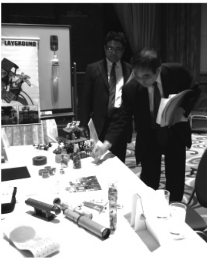
台灣生活用品展吸引不少日本廠商前往

而日本少子化的風潮，也讓寵物變得跟家人一樣重要。針對小狗散步時所量身設計的項圈，繩子有自動收放功能，還有發光裝置，連晚上也可以自在散步。而且符合環保風，這個裝置不需要裝電池，而是利用手把的轉動發電，相當有趣。