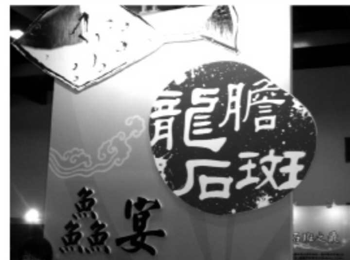
各位讀者在享受美食之餘，別忘了尊重大自然與其它的動植物，不要過份破壞大自然的生物「地球村」。

以饗國內外觀光客。 根據這一次自己與友人參觀後感覺到或許是經濟不景氣的影響，現場的試吃活動並沒有以往的多，也許今天是非假日的緣故，人潮也沒有很多，不過現場有許多從外地來的學生前來參觀學習，很多的作品都是平常不容易看見的。 「吃」對於中國人來說也說也是很重要的文化，料理是要帶給人幸福的感覺，在台灣有多元的美食文化，有客家料理、原住民料理和閩南料理等，但個人也希望在這裡希望