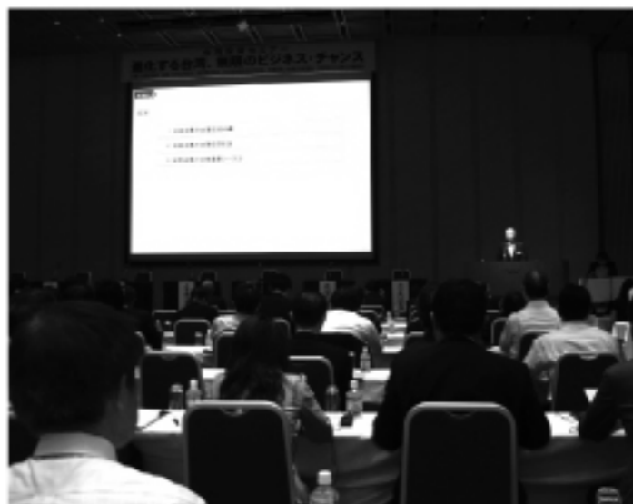
經濟部到東京招商

第41個復邊政府採購協定（GPA）締約國，每年將開放約新台幣2000億元（約60億美元）規模的政府採購市場，目前正規劃12項建設，歡迎日本企業投資參與，跨國企業可運