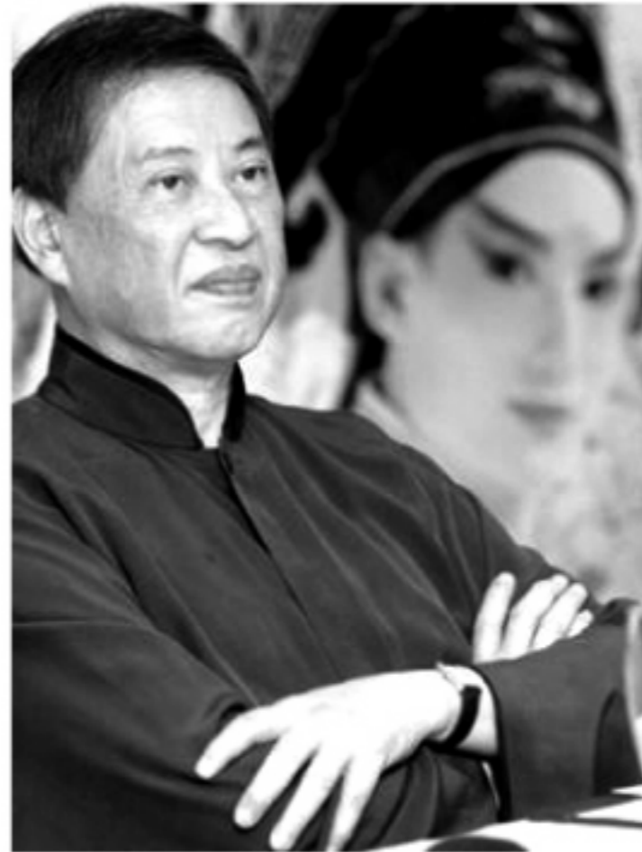
化中，長子具有繼承之權，在父親死後，長子及代表「父權」，老鼠和烏鴉即是如此，雖然烏鴉對老鼠不好，而老鼠也只能承受，被自己的兄弟痛扁也視為理所當然。

在《孽子》中提到的親人之愛，除了父子之愛外，最重要的莫過於手足之愛了。在書中，阿青至始至終都念念不忘他的弟娃，本來不太喜歡備受母親疼愛的弟娃的阿青，自從母親與男人私奔後，卻和弟娃有很深厚的感情，很不幸的，弟娃在一次肺病中去世了。在阿青逃出家的三個月，他過了一段對家庭沒有感覺沒有記憶的生活，再三個月後的一天，他才赫然發現自己竟是這麼樣地想念弟娃，在他離家時，什麼都沒帶，只帶了一把弟娃留下的蝴蝶牌口琴。而書中所提及的另一段手足之情，即是老鼠和烏鴉了。在父權文