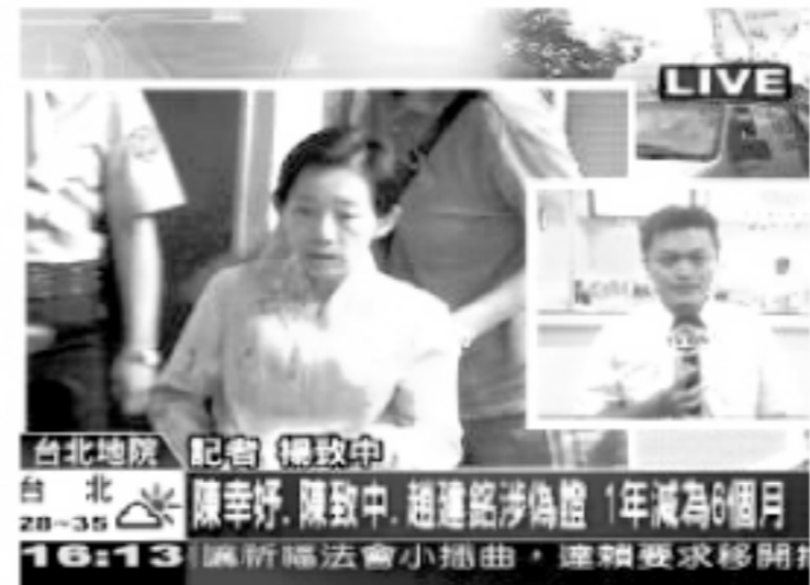
台北地院 記者 楊致中 台北 16:13 吳淑珍等5人涉偽證 1年減為6個月

扁家偽證案，地院的一審結果出爐，5名涉案人都沒有現身到場聆聽判決，僅有陳敏薰的律師到場，是否會再提出上訴，外界相當關注。