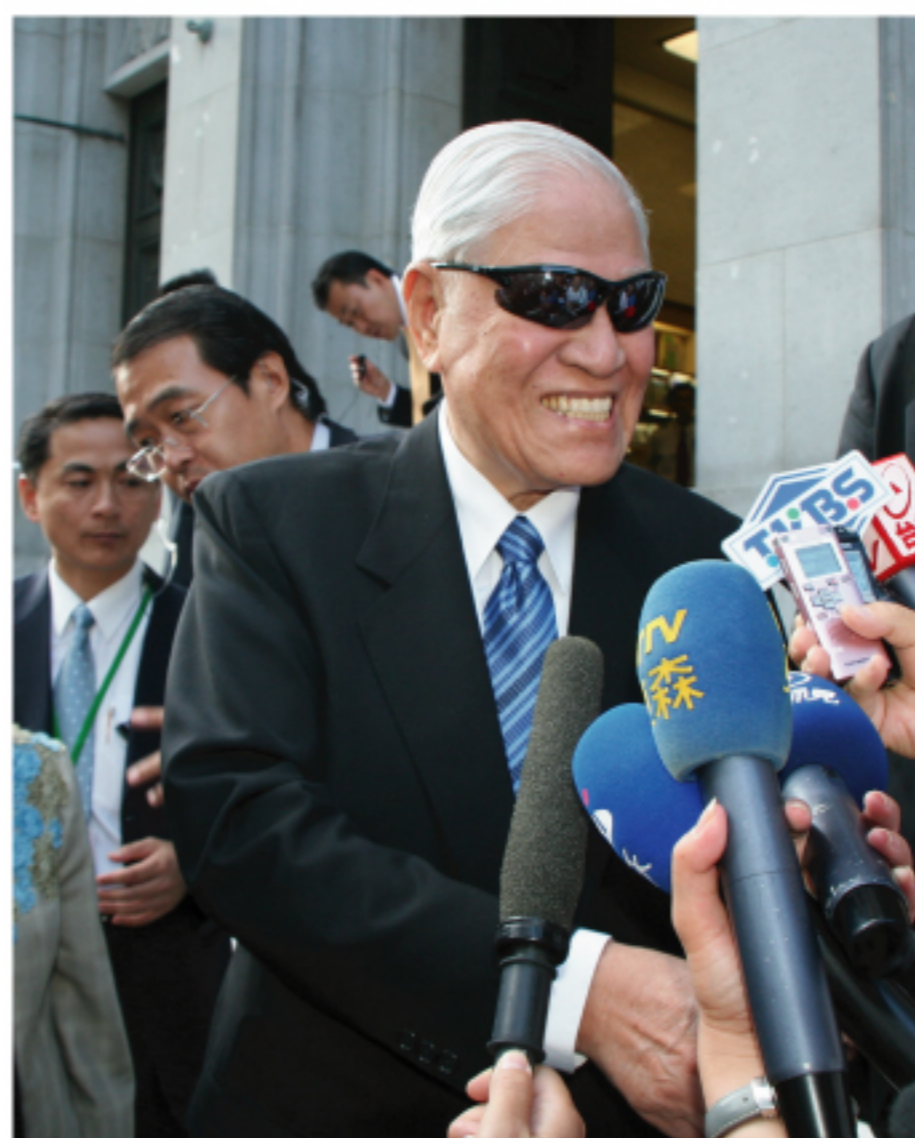
前總統李登輝前往日本訪問

「產經新聞」報導，李登輝指出，日本有必要進行明治維新以來最大的政治改革，他呼籲新政權，在日美協調路線的主軸上進行與中國有節度的交流，並和獨