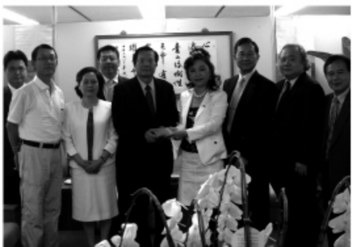
關西台商募款捐贈台灣

告該會緊急發動賑災募款，募得日幣5,702,044圓；隨後在辦事處人員陪同下赴日本紅十字社大阪府支部交付該筆捐款，請該社轉中華民國紅十字總會救災專戶。