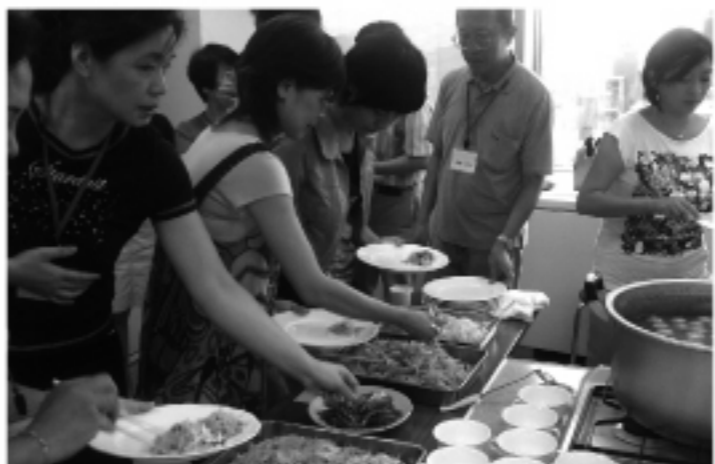
福岡華僑米粉大會

除了米粉之外，婦人部也準備了空心菜、蕃薯葉等具有台灣特色的蔬菜分送各組加菜，也有華僑拿自家摘種的大瓢瓜貢獻大家的思鄉味醬。在大家競相拼命的同時，婦人部準備的魯肉飯、菜脯蛋、丸子湯跟綠豆湯也紛紛上桌待命。終於大家歡喜集合，開動品嚐各家精製的彰化米粉、新竹米粉、埔里米粉、屏東滿州米粉跟南瓜米粉等多種米粉。(福岡 宣靜雯)