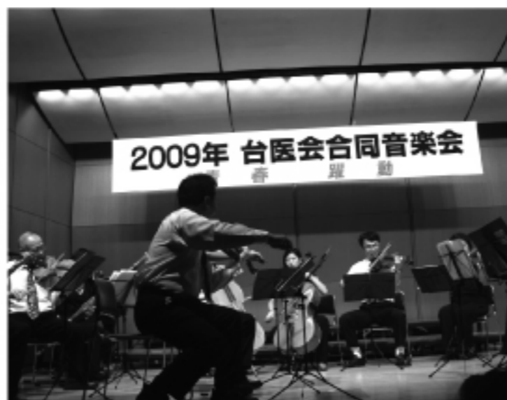
台醫會合同音樂會

由於台灣受颱風創傷嚴重，近千人死傷，主辦單位除設立募款箱外，音樂會前更全體起立默禱，祈求台灣風災死者安息，場面感人。