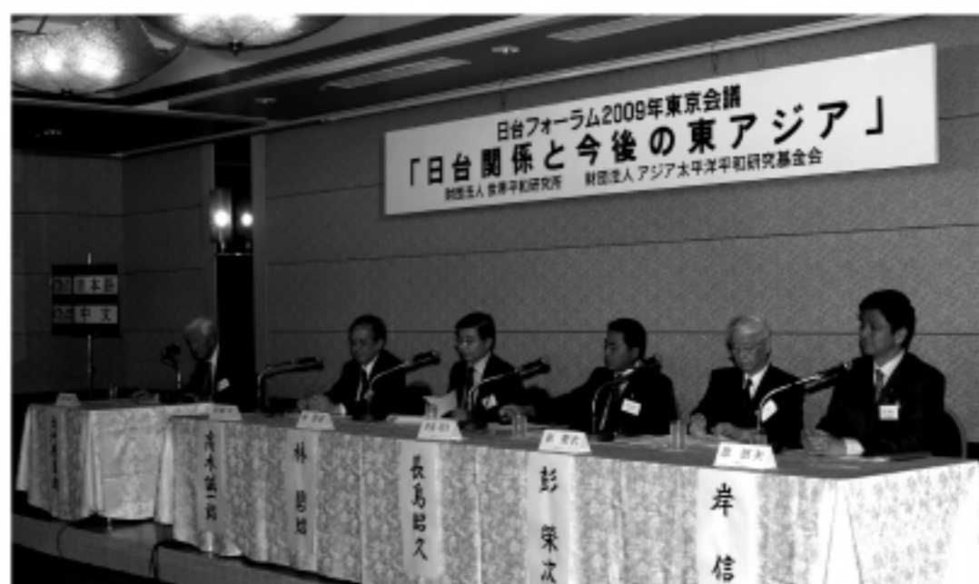
台日論壇中民主黨議員重申日本台海關係不變

日本學者高木誠一郎指出，東亞的區域合作對日本和台灣都是挑戰，區域合作若排除台灣將是毫無道理的事，日美和東協都有必要合力協助確保台灣有一席之地。