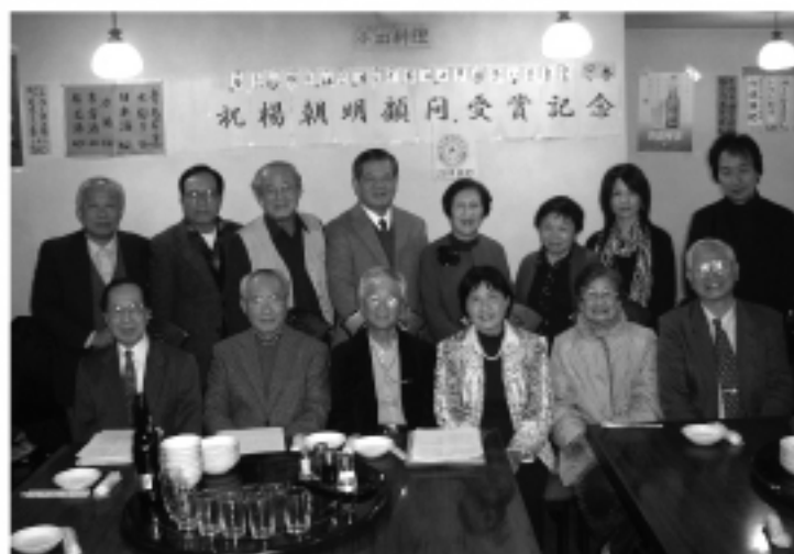
楊朝明博士夫婦(中)