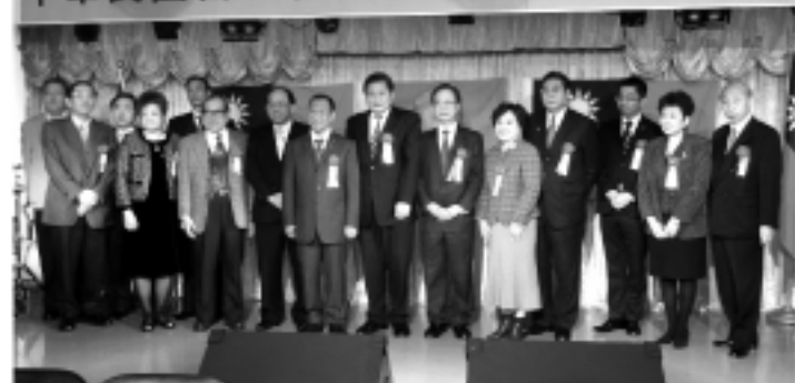
懇親大會要人合照