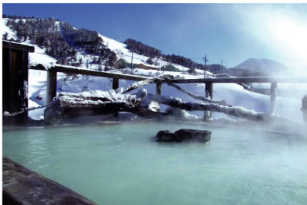
日進館專用露天溫泉

此外,每天晚上都有表演,館主自己也是歌手之外,也會有薩克斯風等其他音樂演出。房間多達150間,因為整個館是長條形的,所以隨著住的房間位置不同景色也跟著變化。旁邊是滑雪場,他們有針對沒滑過雪的人設計課程,以及森林散步等行程,只要跟櫃檯做詢問就會有詳細的解說。而且館內員工會說英文及中國的員工,所以訂位時沒有語言上的困擾。只要冬天一來,東南亞,澳洲等外國觀光客就大增。特別是過年期間,短短幾天就湧進500多人非常有人氣。