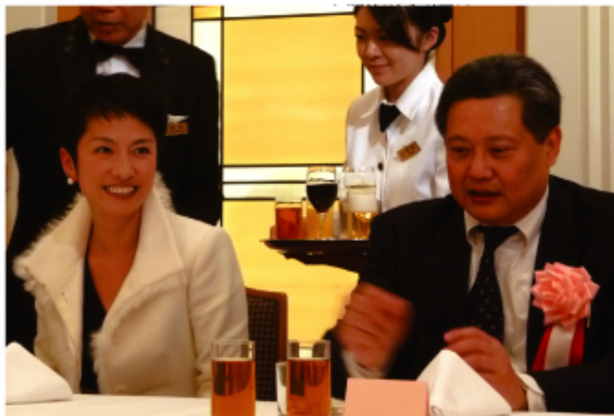
日本參議院議員董舫(左)日本中華聯合總會會長劉東光(右)

會後的懇親會,台北駐日經濟文化代表處代表馮寄台,日本參議院議員董舫,日本參議院議員神取忍,日本參議院議員魚住裕一郎特地前來出席。由於董舫議員具有台灣血統,在席間