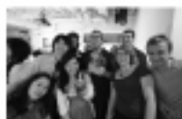
Guest-Houseの仲間たちが集まるInternational Party