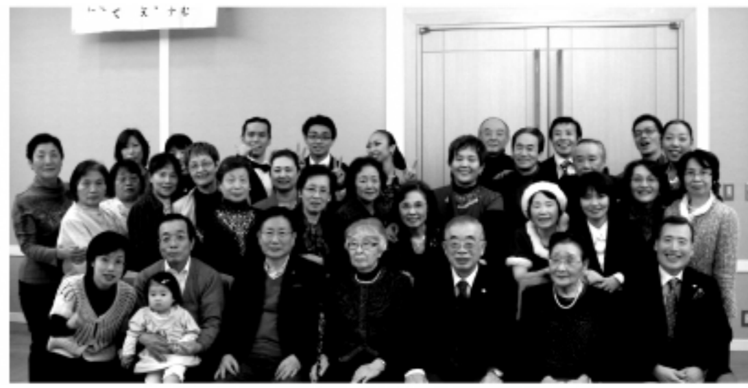
東京神宮前ライオンズクラブ クリスマスパティー

日本統治下の1920年から10年の歳月をかけて最初に台湾に創った当時東洋一のダム「烏山頭(うさんとう)ダム」なども見学し、日本と台湾の深いつながりを実感できる旅としている。なお、烏山頭ダムは、世界初の自然と融合した「環境型ダム」として有名で、現在世界遺産への登録を目指し申請中だ。このダムではダムそのものの建設だけではなく、網の目のような水路を作り、不毛の地であった嘉南平原を 穀倉地帯に変えた。八田技師の命日である5月8日には、毎年現地では法要が行われている。