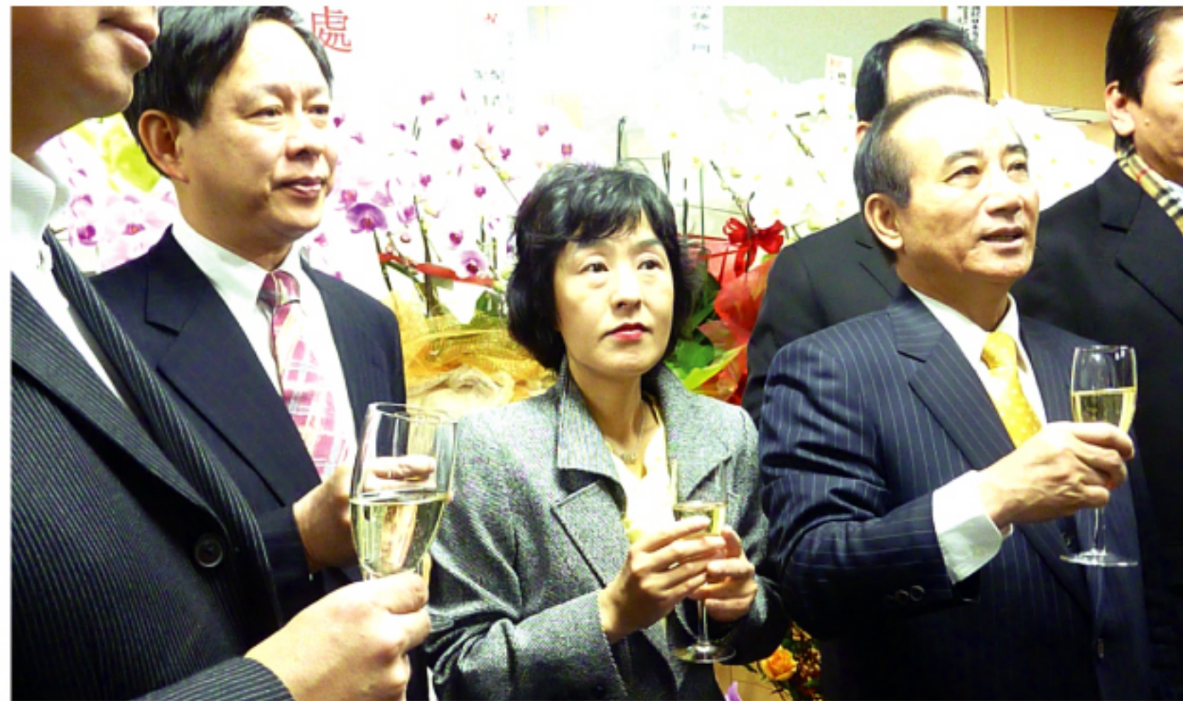
立法院長・王金平氏(右)、北海道知事・高橋はるみ氏(中) 台北駐日経済文化代表処札幌分処処長は徐瑞湖氏(左)

続いて開かれた茶話会では、台北駐日経済文化代表処代表・馮寄台氏が「日本各界の支持の下で順調に札幌分処開設に至ったことに感謝する」意を表し、重東