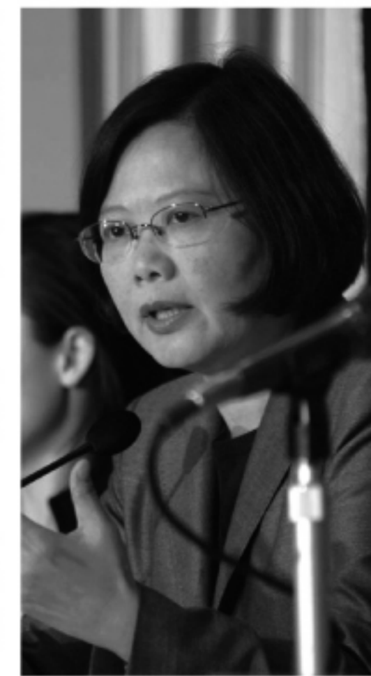
台湾民進党主席蔡英文氏

しかし国民党が政権をとった2008年の総統選挙から1年がたった現在、台湾経済の低迷や台風8号の甚大な災害への対応の不備などが批判され、馬政権のほころびも少しずつ目立つようになった。そのため最近では地方選挙では国民党よりも民進党の躍進が目立っている。そのため、最近では民進党の政策に日本でも多くの注目が集まっていた。