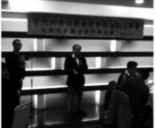
大東洋で京阪神中華總會青年部合同忘年会を開催

計70人に近く2009年の京阪神合同忘年会はすく賑やかな雰囲気の中で幕を開いた。