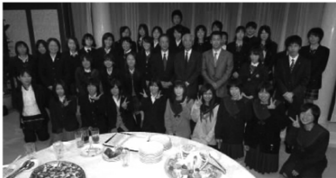
日本高中生訪華団壮行会

日本統治下の1920年から10年の歳月をかけて最初に台湾に創った当時東洋一のダム「烏山頭(うさんとう)ダム」なども見学し、日本と台湾の深いつながりを実感できる旅としている。なお、烏山頭ダムは、世界初の自然と融合した「環境型ダム」として有名で、現在世界遺産への登録を目指し申請中だ。このダムではダムそのものの建設だけではなく、網の目のような水路を作り、不毛の地であった嘉南平原を 穀倉地帯に変えた。八田技師の命日である5月8日には、毎年現地では法要が行われている。