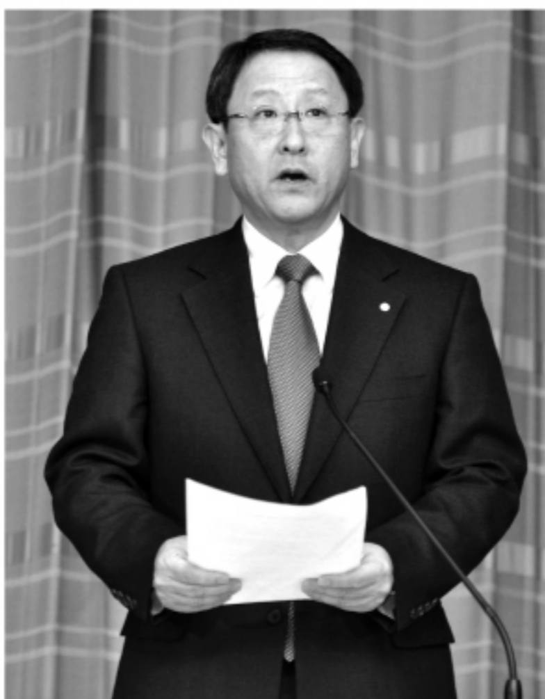
リコール問題で、東京本社で、3度目の記者会見に臨む豊田章男トヨタ自動車社長

半面、プリウスのユーザー層が、高齢者や主婦層を中心に見込められ、構造的な問題はなくても商品としては欠陥だ。高齢者や女性のドライバーで、思いっきりブレー