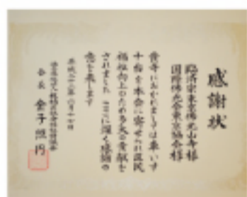
輪椅捐贈儀式-感謝狀