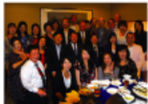
埼玉台灣總會送別迎新會