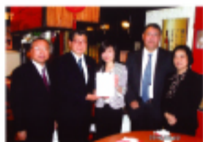
在日台灣同鄉會送別迎新會