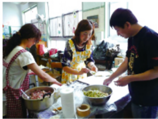
包餃子的家長會成員

中華學校。不少華僑表示，每年6月的這項校慶園遊會是最叫人期待的。來訪的日本教師邊吃炒米粉邊興奮地說，第一次來訪校內的氣氛讓她留下很深刻的印象。各班園遊會義賣所得將歸為各班班費。一年一度的校慶園遊會下午3點學生們依依不捨中熱烈閉幕。