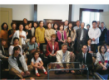
神戶華僑總會會員團體照

這天神戶華僑總會同時安排了氣功教室、二胡演奏、台語研習、紅龜粿草粿等傳統台灣糕點教室、「保存華僑口述紀錄的意義」講座及「成人病」健康講座等節目，與會會員人人大呼過癮。最後親睦大會在摸彩的歡聲中圓滿落幕。