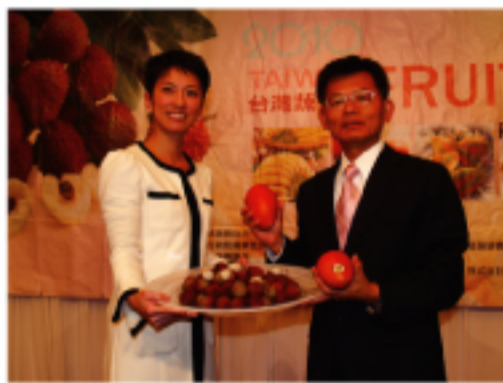
高雄縣縣長楊秋興(右)參議院議員蓮舫女士(左)