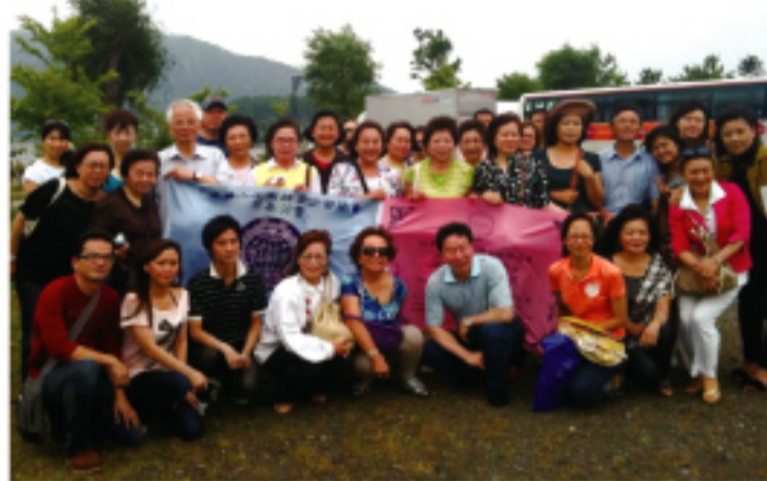
採櫻桃一日遊參加成員

全員在山中湖照了紀念的相片, 接著到甲府市的塩山享受豐富的午餐。中午的料理也是山梨有名的烏龍麵, 大家吃的不意樂乎。下午到目的地「菊島農園」採櫻桃, 一顆顆紅透的櫻桃讓人忍不住伸手去採取食用, 大家可以說是吃的樂不台口。在車上事務局將世華企管內容及上一屆華冠獎的錄影帶撥放給大家參賞, 讓會員更理解世華, 也讓尚未參加世華之來賓藉由這次的介紹來加入世華。