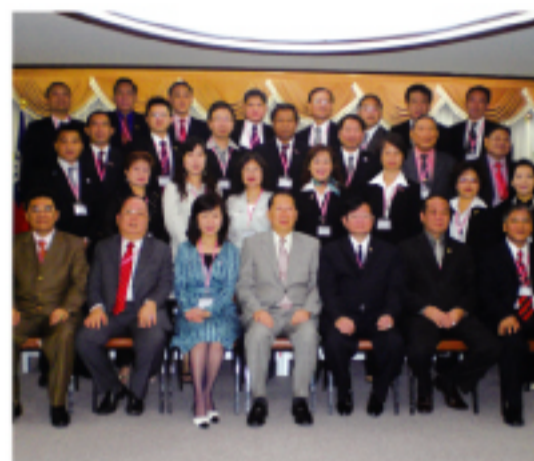
亞州地區僑團負責人回國參訪團

所有的團員在台北醫學做健康檢查體驗完成程為4日5夜訪台之旅。團中、日本代表埼玉台灣總會會長擔任副團長之職，負責公關、翻譯等事務，七個國家成員大家融成一體非常愉快，並約束繼續保持國際交流。