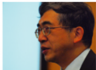
駐日代表處科技部蔡明達先生