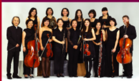
台湾独奏家室内楽団