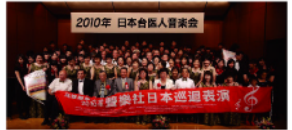
2010年 日本台醫人音樂會