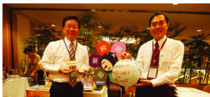
台日旅遊業者商談會的台灣業者

本次台灣代表團除了參加一年一度的東京旅展之外，並將前往名古屋及東京舉辦台灣觀光推廣會，並首次特別安排台日旅遊業者商談會，增加雙方業者商機。