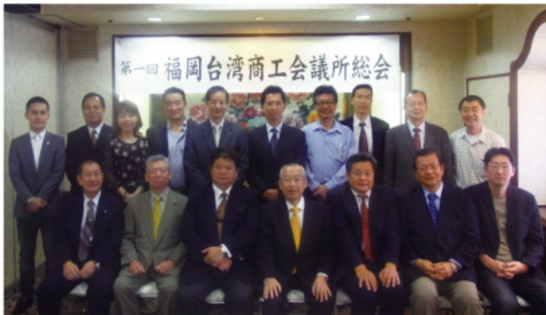
與會人員合影留念

支店長也都出席會後懇親會，除了肯定台商會在九州山口地區的重要性之外，也期望該會日後的多方面網絡拓展以及商業交流為當地的華僑帶來更多的機會。目前福岡台商會成員共有 14