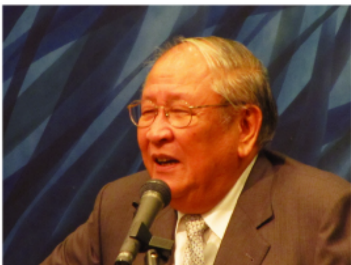
台灣獨立建國連盟主席黃昭堂

是出席在東京目黑區雅敘園餐廳由東京、橫濱僑界所舉行的5都選舉造勢餐會，僑界出席踴躍場面盛大，約有400人參加。日本民主黨眾議員中津川博輝也受邀出席。為了中國國民黨贏得五都選舉，會場中當選聲不斷與高喊金秘書長加油聲，不時還搖舞著中華民國國旗與黨旗。