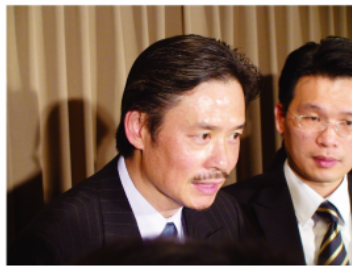
國民黨秘書長金溥聰

接任秘書長時，就曾明白表示會負起5都選舉成敗的責任，「這個承諾到今天並沒有改變」。至於何謂成敗、輸贏？這是很簡單的數學問題，「5個裡面，3是多數3就是贏，少於3就是輸」，「我不會逃避」。對力拚南2都翻盤，他也展現信心。金溥聰以京都市長選舉為例，當時現任市長也不被看好，提出了「龜兔賽跑」比喻，專注自己的目標，向前邁進，最後贏得勝利。 此外台日關係發展，金溥聰說，民主黨經過這次重整出發，台灣方面也寄予厚望，希望彼此盡最大力量，讓台日良好的關係能不斷地增強聯繫。 金溥聰秘書長一行入晚間則