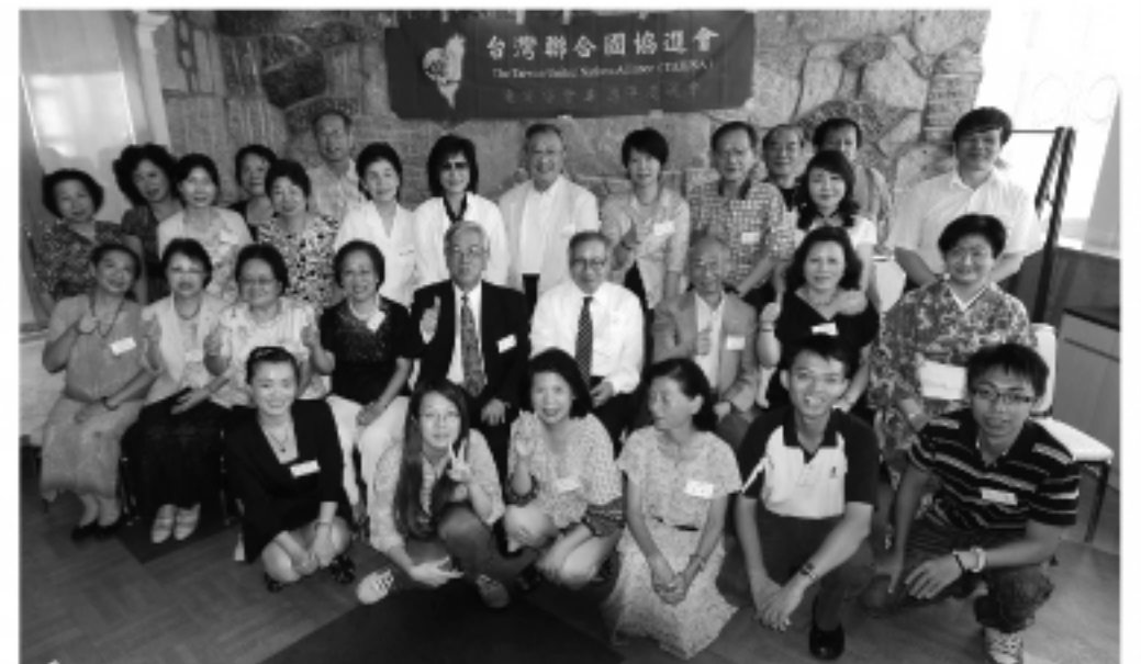
台湾聯合國協進会東京分会のメンバー一同で記念撮影

今年で4年目を迎える「台湾聯合國協進会東京分会(台湾の国連加入を求める会)」。その記念講演会とパーティが東京、池袋の東明大飯店で行われ、約40名の台湾人同胞、そして活動を支える日本人の友人たちが集った。