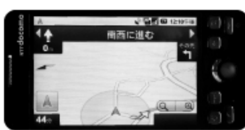
Google が展開する無料でスマートフォンで利用できるカーナビ「Google ナビ」の画面

日本のカーナビゲーションシステムが存続の危機に陥ろうとしている。世界は台湾メーカーが圧倒的なシェアを誇るPND(パーソナル・ナビゲーション・デバイス)が主流となっている。自動車の中に留まり、CD-ROMからDVD-ROM、HDと本体メモリを強化して高性能・高機