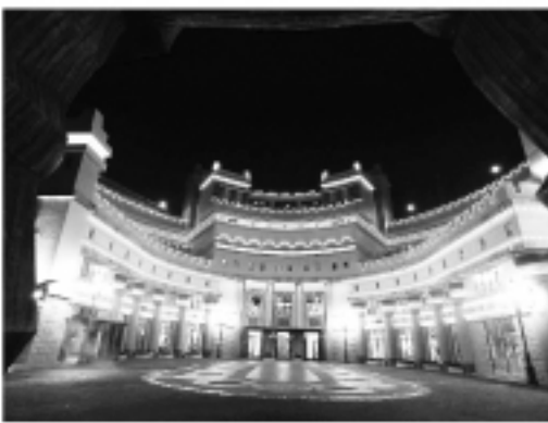
義大ワールドのアミューズメント施設の外観

からバスで20分ほど。台北から行くのも簡単だ。また、10月31日から、チャイナエアラインの成田-高雄の定期便が就航する。これに乗れば、東京から高雄に直行し、義大世界ですぐに遊ぶことができる。また、同エアラインでは、同じ10月31日に、羽田-台北便も始まる。東京からますま