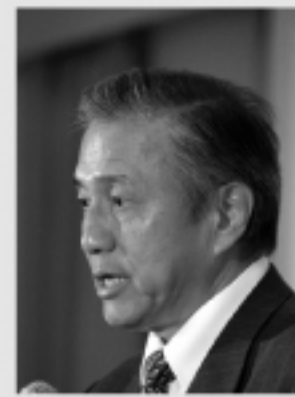
▲挨拶に立つ台北駐日経済文化代表処・馮寄台代表

9月18日、午後6時より、東京・新宿の京王プラザホテルで、APEC女性ネットワーク会議台湾代表団歓迎パーティが開かれ、80名以上の参加があった。