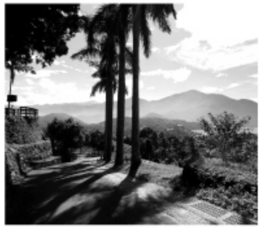
イベント会場から一望できるすばらしい茶畑の眺望

ツアーは、特にこの地域のお茶の開発、紅茶の開発に縁が深い日本の観光客に向けて企画された。今後は多くの日本のツアー会社がこの企画を扱うというから、楽しみだ。