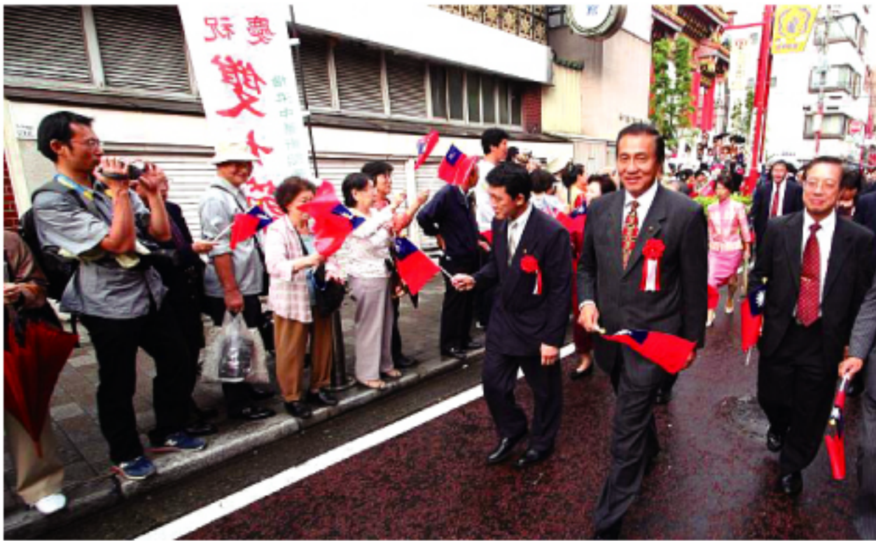
横浜中華街の雙十節パレードに参加した就任直後の台北駐日経済文化代表処の馮寄台代表(2008年10月10日撮影)

台日間の観光交流も緊密であり、昨年は日本から100万人あまりが台湾を訪れ、台湾からは113万人あまりが日本を訪れました。台湾にとっ