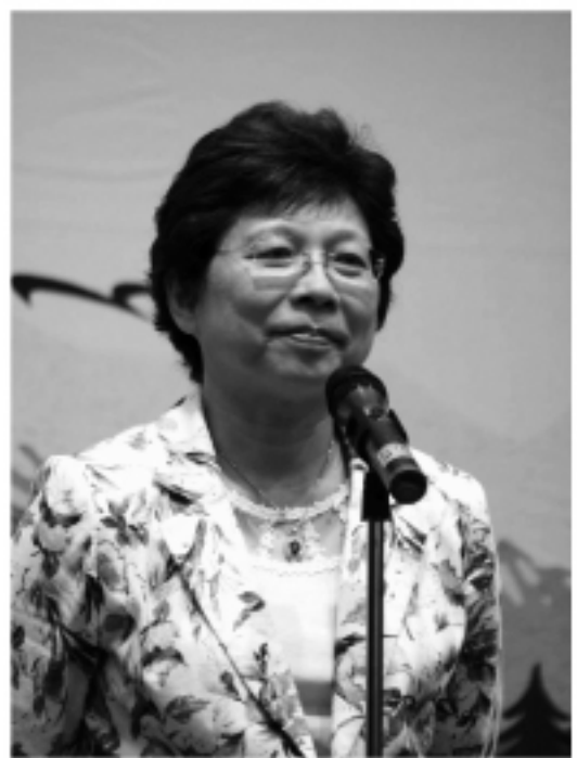
イベント前日に行われた観光局主催のパーティで挨拶する観光局長

イベントの行われた日月潭は台湾のほぼ中央に位置する台湾最大の湖だ。周囲には蒋介石の母親の墓、少数民族の村など見どころも多い。そのため、最近では中国からの観光客にも人気の観光地の1つとなっている。朝夕の湖面に映る景色の美しさはつとに有名だ。日本人にとってはどこか懐かしさを感じる風景も多く、最近はずいぶん日本人観光客も増えつつある。そのため、この地で「紅茶体験」の