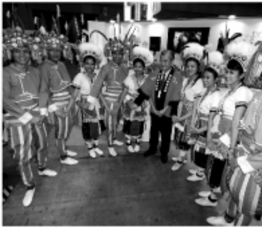
毛治国・交通相と記念撮影

台湾を訪れる観光客は豊かになった中国大陸からの観光客を中心に近年は増加傾向にある。今年1月から8月までの台湾の政府交通部の統計によれば、日本から台湾へ訪問する客数はすでに69万538人。昨年同月比で8.2%の増加となっている。日台観光促進協会とともに掲げた目標である「訪台日本人100万人突破」は昨年の時点で既にクリアされているが、今年は