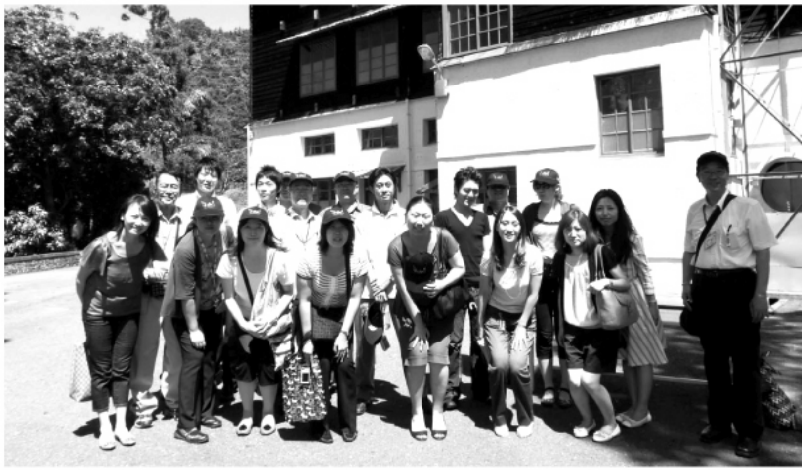
製茶工場の前で記念撮影

晴れた茶畑の向こうに広がる湖の景色は、異国の景色なのに、なぜか美しく、懐かしい。