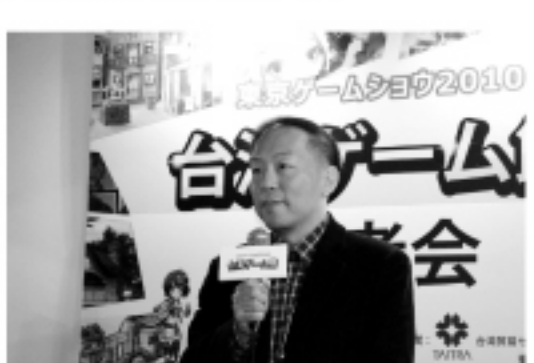
ガマニア・何代表

ゲームというふたつのエンターテインメントを同時に体験し楽しんでもらう新たな試みという。【本紙 青田信吾記者】