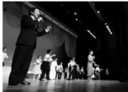
「おへそのまわりはなんセンチ」の歌と踊り