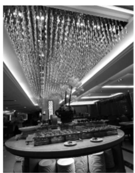
義大にあるホテルのビュッフェの夕食もすばらしい。

義大世界(義大ワールド)は、巨大なショッピングモール、巨大な屋内と屋外の遊園地、それらを結ぶモノレール、あわせて一千部屋というキャパシティを持つ2つの巨大ホテル、そしてそこに住みたい人のためのレジデンスなどが集まった、畑ばかりの平地の中に突然現れる、夢を紡ぐ商業都市だ。ギャンブルはないが、米国の砂漠の真ん中に忽然と現れる都市、ラスベガスを彷彿とさせる。広さはおよそ90ha。縦横とも1kmの土地に、これらの施設があ