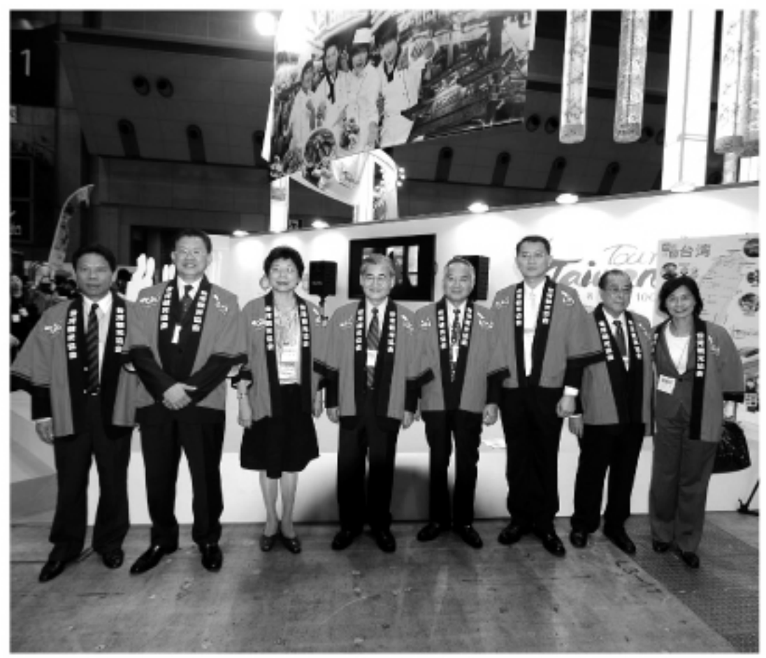
台湾の展示の前で毛大臣を囲んで

海外の中では日本人が行きやすい環境でもある。加えて、この10月31日には、国際線の路線減少の傾向の中、台湾と日本を結ぶ路線が増便される。台北の松山空港-東京の羽田空港も定期便が始まるうえ、成田からは高雄便も予定されている。台北-羽田便によって、東京と台北の日帰りさえできる環境が整う。加えて、11月6日からは台北の市内をそのまま使った博覧