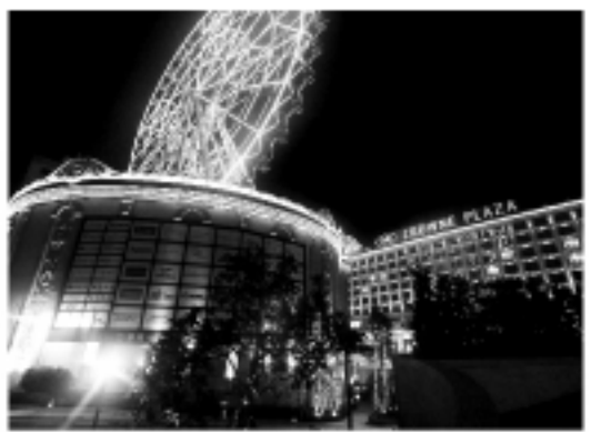
義大ワールドには2つのホテルがある。その部屋数はあわせて1千あまり