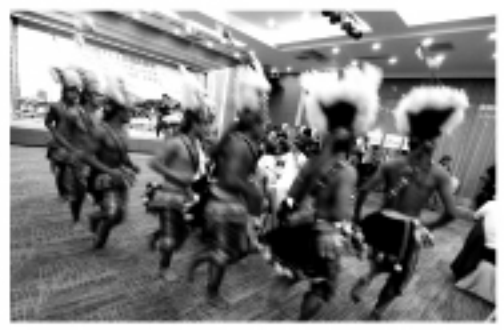
イベント前日のパーティでは台湾少数民族の踊りも披露された

本パーティでは日本から多数の台湾新聞を含むマスコミと旅行業者が集い「日月潭の紅茶」などを中心とした「茶」を中心とした旅行について、そし