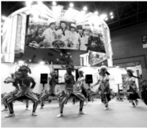
台湾少数民族の舞踊も披露された

「110万人以上」を、と観光局は期待しているとのこと。また、日本以外からの訪台者数も増加しており、8月までに360万2370人となっている。これは昨年同月比で約27%の増加。今年は480万人をめざすという。