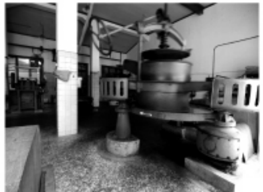
紅茶の製茶工場見学