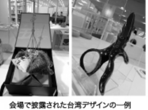
会場で披露された台湾デザインの一例

製品が受賞していることを語った。台湾、中国にあっても、今後は工業デザインが製品を価格競争から脱却させ、製品のデザインによる競争を生み出し、企業により多くの利益をもたらす、ということが語られた。そのため、今後は工業デザインの重要性がより増すことが語られた。 台湾のデザインの力は日本の製品を作る力と一緒に、より大きなパワーを発揮すると思われる。