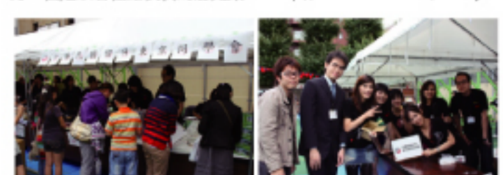
10月的國慶日園遊會在東京中華學校