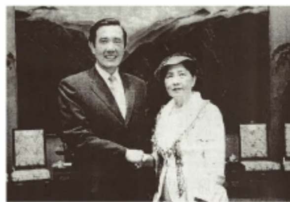
總統馬英九與黃壽美女士合影

此外，黃女士亦於演講中感念夫婿楊朝明先生的長期支持，讓她得於實現夢想。楊朝明先生是位醫學博士，兩人旅居日本多年並育有三名子女。