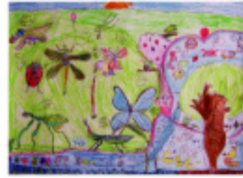
小3 オビ マリア