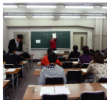
大阪地區華語測驗試場

目前在日本一年有兩次報考機會，分別是 3 月的東京地區及 11 月的大阪地區，今年大阪地區的報考人數比去年增加十多名。考生多為學生與社會人士。談到報考動機，有人以中文學習為興趣，想要了解自己的學習程度，也有人夢想到台灣工作，希望取得證書創造工作機會。(華語測試推動工作委員會網站 http://www.sc-top.org.tw/)