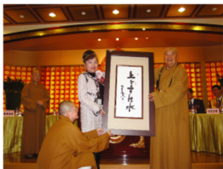
日本關西台商協會 謝美香會長與星雲法師

得近億元基金。但星雲大師再發大願心，希望能籌募十億元為目標，讓社會公益活動可以永久持續。因此再度發揮驚人毅力，日夜揮毫，發心為這次書法義賣執筆揮毫，寫就了「我是佛」、「吉祥如意」、「度一切苦厄」、「不忘初心」、「以眾為我」、「百福吉祥」