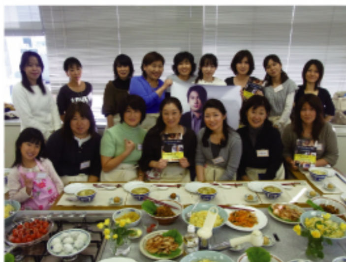
台灣料理同歡會會員用餐前的團體合照

(本報訊)福岡縣華流粉絲團於11月20日籍婦人會館舉辦第二次台灣料理同歡會。同歡會的主辦單位為前F4朱孝天迷團Team 福岡的七位幹部，他們邀請其他F4歌迷同聚，並以朱孝天所出版的料理書「ケン・チュウ おいしい関係」為參考藍本，設計料理製作的學習題目。豐富的菜單中包括耳熟能詳的黃金炒飯、酸辣洋芋、紅燒雞肉、川丸子湯以及椰香丸子等十道中華菜餚點心。