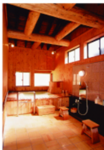
租用浴池 圓滿的湯

我患有長達八年之久的風濕症,有關節痛手腳變形特有的症狀,在夜晚寒冷的季節時,手腳變冷時特別感到刺痛,有時會認真地想,為何非活的如此辛苦。