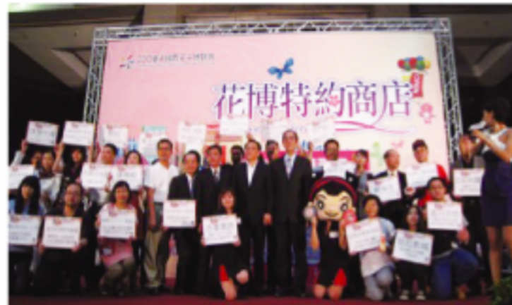
臺北國際花卉博覽會特約商店活動

店家,有法蘭瓷、DK、千琪運動廣場、煙斗服飾等65家服飾精品。特約商店的消費優惠百百款,最低折扣5折起,也有買一送一。臺北國際花卉博覽會不只是台北市所舉辦的活動,是整個台灣一起舉辦的活動,不分南北與縣市,所以是臺灣第一次舉辦此類型的博覽會,更是台北的驕傲,能夠舉辦這一次的活動,歡迎各位讀者前來。