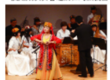
音樂交流活動現場

天翔樂團成立於 2003 年,是由一群愛好中國民族樂器的日本友人所組成的市民樂團。一年一度定期演奏會邀請台灣旅義留