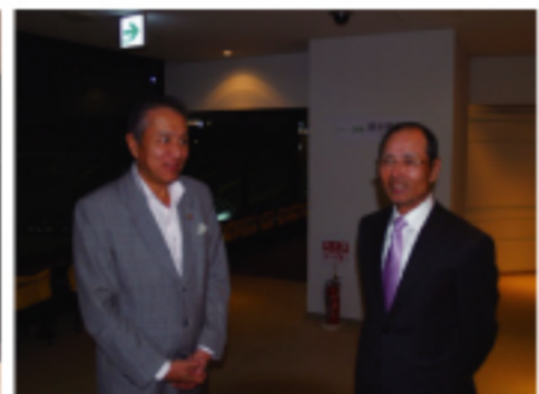
台北駐日代表馮壽台與日本前職棒教練王貞治相會於棒球博物館