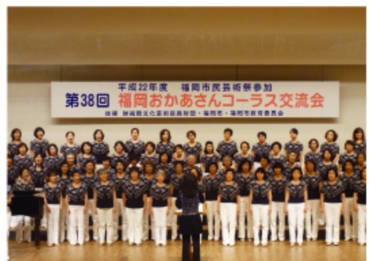
交流會尾聲由創始團員—紫旗野女聲合唱團及春日合唱團共同演繹情景

台日語歌曲，有「河邊春夢」和「滿山春色」兩首台語歌，以及由台灣音樂家郭芝苑作曲、張錦濤作詞的「港の女」的日語歌。日本民眾表示，「港の女」讓人聽來心有戚戚，而儘管不懂台語，但「滿山春色」音調最能傳達台灣風情的意象，讓人聽來相當歡喜。