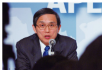
經濟部部長施顏祥

此外施顏祥部長談到APEC是多邊會議的場合，ECFA談的很少，但是對台灣而言，經濟體越多越有利，關於ASEAN+N跟TPP，哪一個對台灣較有利還在評估。