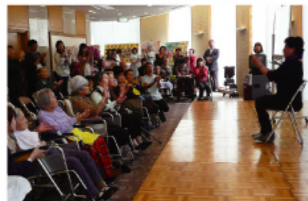
活動人員與安養中心老人們互動

自創會起本著在異鄉相互扶持關懷的精神，積極從事慈善人道活動的欣華會。近年來不定期到安養中心進行二胡演奏會及按摩等活動。李會長表示，會員們的力量雖微薄，能對日本社會做出回饋心中十分歡喜。