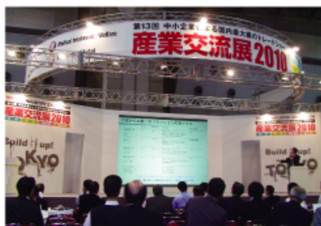
企業產業交流展中的亞洲商業講座