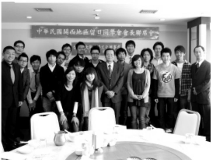
關西地區同學會幹部合影

(本報訊)駐大阪辦事處為加強服務轄區留學生，並增進與同學會溝通交流，於3月5日舉辦留日同學會會長聯席會暨領務說明會，計有關西地區同學會計20名幹部出席，並由黃處長主持懇親會。