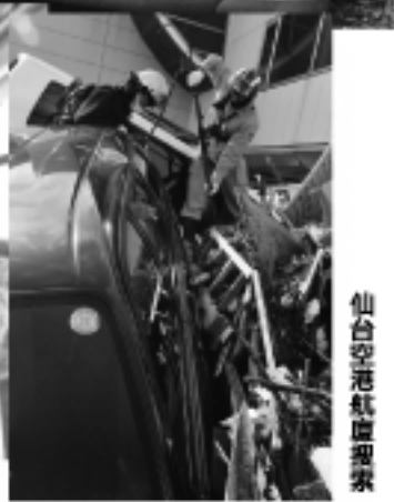
仙台空港航廈搜索