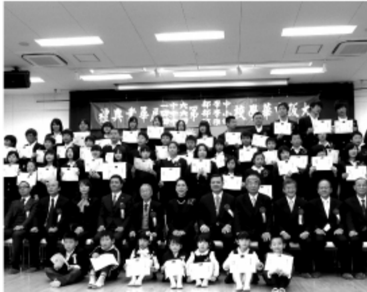
99學年畢業典禮紀念攝影

界。陳校長勉勵畢業生，離開校門不要忘記在校所學及師長的教誨，將來為社會服務也替母校爭光，學校將永遠是同學們最溫暖的家。目睹災情頻發，校長再次呼籲同學們要愛護地球、注重環保，最後祝福所有同學前程萬里、前途光明。