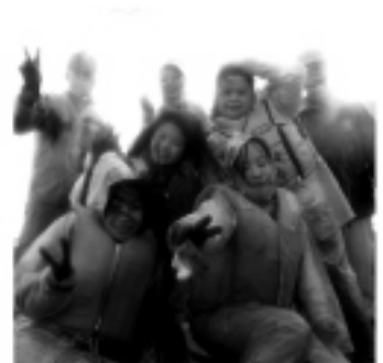
平戶市的清晨漁船體驗

(本報訊)日本九州北部五個都市，包括長崎縣平戶市和雲仙市、佐賀縣武雄市和嬉野市、以及福岡縣福岡市，於去年2010年12月成立「東亞誘客三縣五都連攜會議」，在拜會駐福岡台北經濟文化辦事處後，於今年三月邀請台灣留學生參與視察旅行。旅行過程中，留學生除了需要針對每個都市的觀光設施及正體漢字宣傳廣告提供建議與糾正，也和每個城市的市役所相關負責人分享討論體驗參觀以及住宿飲食的感受和意見。