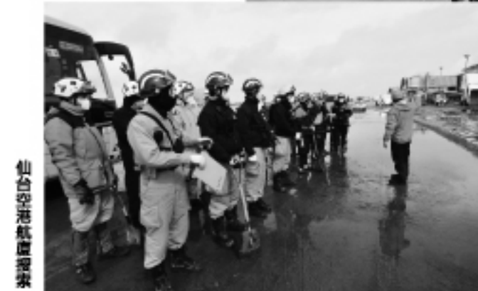
仙台空港航廈搜索