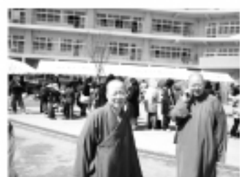
佛光山師父親臨災區

(本報訊)由台灣外交部和佛光山等單位合作所募集的物資於3月22日一早抵達日本羽田機場。