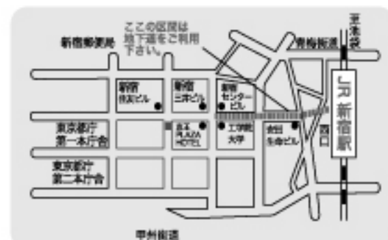
新宿 JR・小田急線新宿駅徒歩 5 分 京王 PLAZA の旁邊