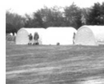
我搜救隊紮營完畢