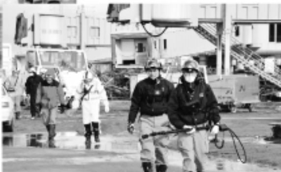
仙台空港航廈搜索