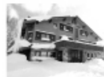
日進館イン 素泊まりプラン ¥4,500- から