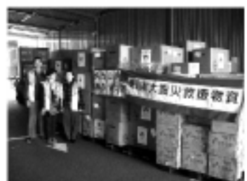
震災物資到達情景