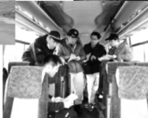
與當地警察單位開會情形