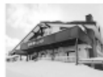
日進館ヒュッテ 素泊まりプラン ¥2,500- から

鄰近就有最適合滑雪活動的萬座滑雪場、在本館有出租用的滑雪用具與服裝、以最便宜的價格來提供、讓遊客能在這輕鬆地享受愉快的冬季運動！！