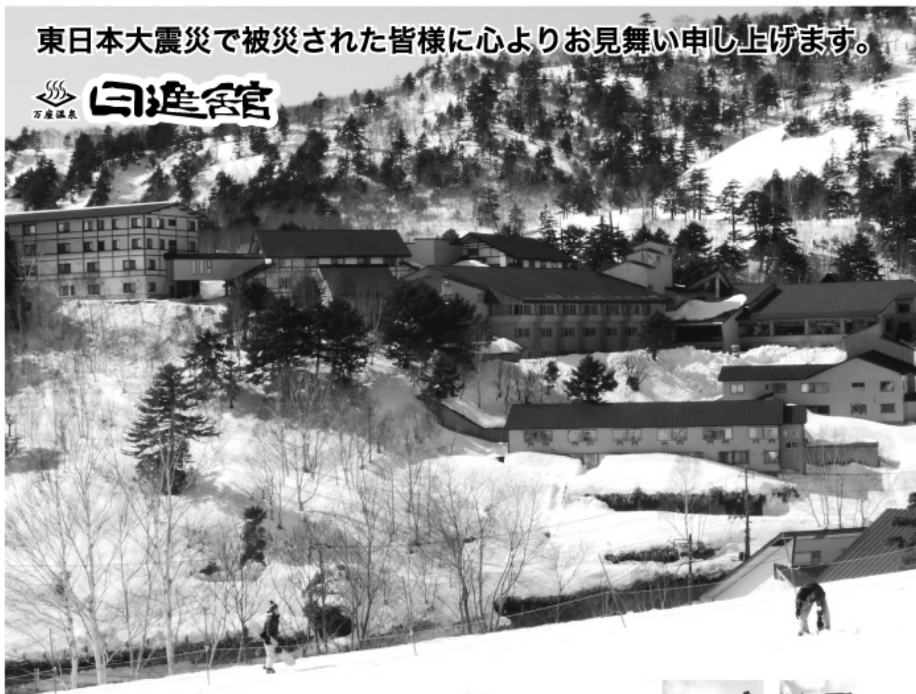
(万座温泉スキー場)