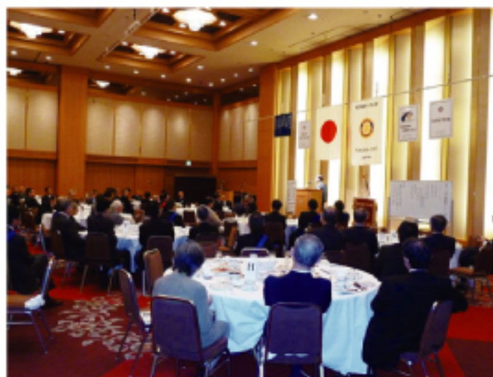
扶輪社會員聆聽演講情形

往來交流(三)、雙方經濟交流(四)、雙方民間交流等四大項目，曾處長呼籲加強雙方觀光、經貿、青少年等各方面交流，增進彼此友好關係。「福岡城西扶輪社」與我「員