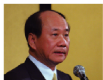
華航張家祝董事長

地的距離更為接近。剪綵儀式後，張董事長在接受日本記者訪問中提起首航有八成以上成績，不排除將來會有增班的可能。慶祝晚會 華航大阪-紐約飛航正式啟航前一晚，27日在大阪麗佳皇帝酒