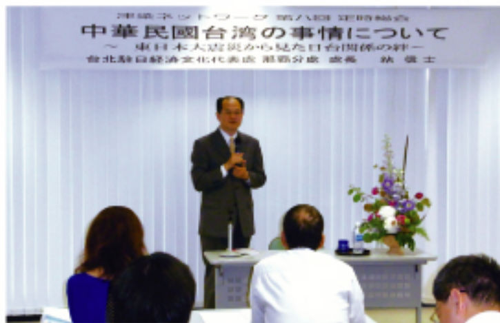
粘處長出席津梁商網協會專題演講情形

演講中粘處長舉例表示臺灣人民對日方的情誼，如臺灣觀光客船「麗星郵輪」照原定日期於4月份啟航至那霸，為沖繩觀光業加油；旅沖旅行社業者踴躍為東日本賑災進行樂捐，及沖繩僑界於5月16日舉行慶祝中華民國100年高爾夫球慈善活動，為震災募款等具體行動，最後期待該會能在日本青年赴