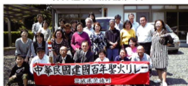
5月8日 於公民館合影