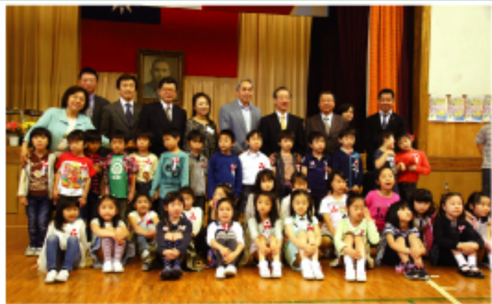
小一新與當日來賓合影

現場販賣黑芝麻湯圓、台灣香腸、鹽水花生、大腸麵線、仙草、蛋餅等，下午的抽獎活動中，贈品包括電籐、迪士尼遊樂園入場券、中華航空公司及長榮航空提供的台北及東京來回機票、商品券等。