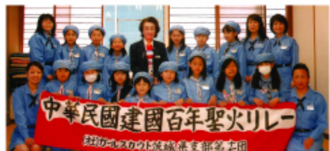
日本女童軍茨城縣支部第17團