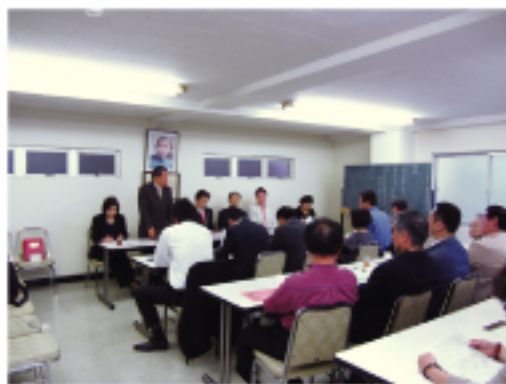
開會狀況選考員選出

這次會議最重要的內容之一是選出下屆選舉的選考委員會。因東京華僑總會較為特別，是由外省10個僑團及代表台灣的台灣同鄉會所組成，委員會委員分別由各省僑團推舉