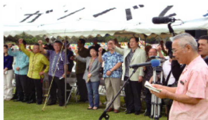
粘處長出席和平紀念公園祈求和平鯉魚旗升旗典禮，大會為東日本震災加油

【本報訊】由財團法人沖繩縣和平祈念財團主辦之「祈求和平鯉魚旗升旗典禮」於4月29日在和平紀念公園舉行。