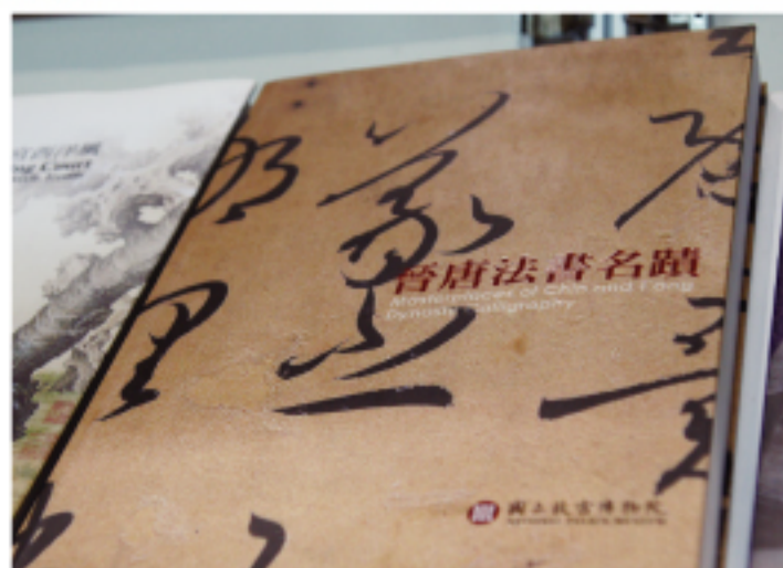
故宮博物院展出之一書

第一次參展的「台灣留學支援中心」則提供到台灣就讀大學的留學資訊，幫助代辦入學申請手續、簡單中文教學等。事務局