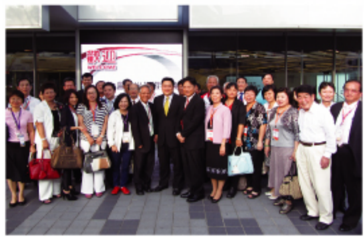
日本商工會議所成員

透過立法院通過後，台商的兒女回台灣兩天後就可以擁有台灣身份証。不過，外貿協會王志剛董事長同時強調，希望別忽略了台灣的傳統產業。第三天閉幕典禮時，行政院吳敦義及海基會董事長江炳坤亦蒞臨參加。