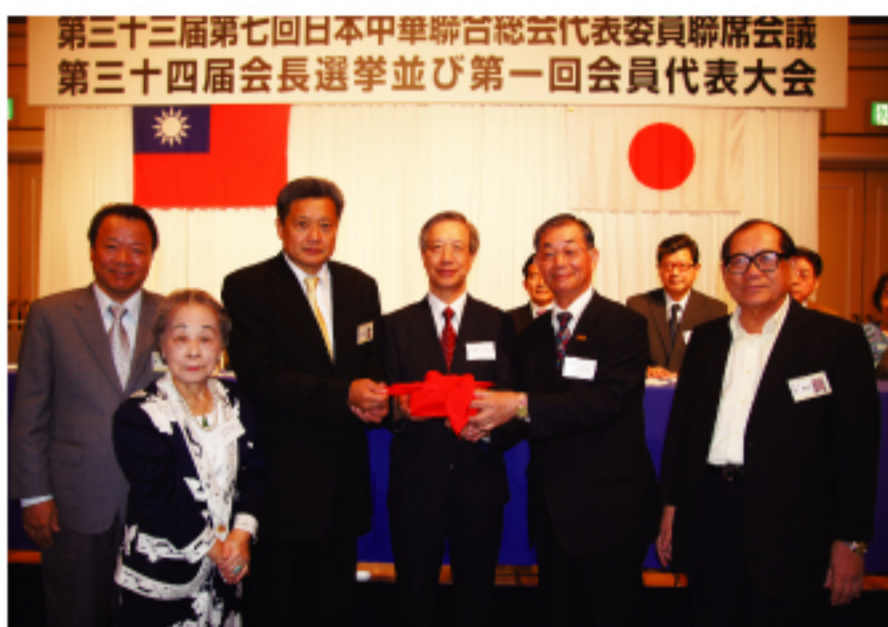
新舊會長會印交接

另外，日本全國華僑子弟募集的建國百年繪畫比賽共集得30項作品參賽，大阪有22張，沖繩有8張，會議當天，兩地的優勝作