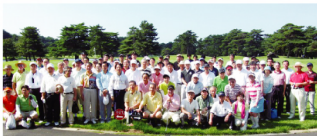
駐日大使馮寄台代表(右6著黃衣者)及華僑團體、工商、醫學人士100人參加

【本報訊】為慶祝中華民國建國百年，埼玉臺灣總會會長周東寬7月13日在千葉，浦土與熱愛高爾夫之僑領、在日企業、醫生、友人舉辦了一場百年高爾夫友誼賽，駐日代表馮寄台、副代表陳調和、羅坤燦及中華聯合總會名譽會長詹德薰亦應邀出席此賽。