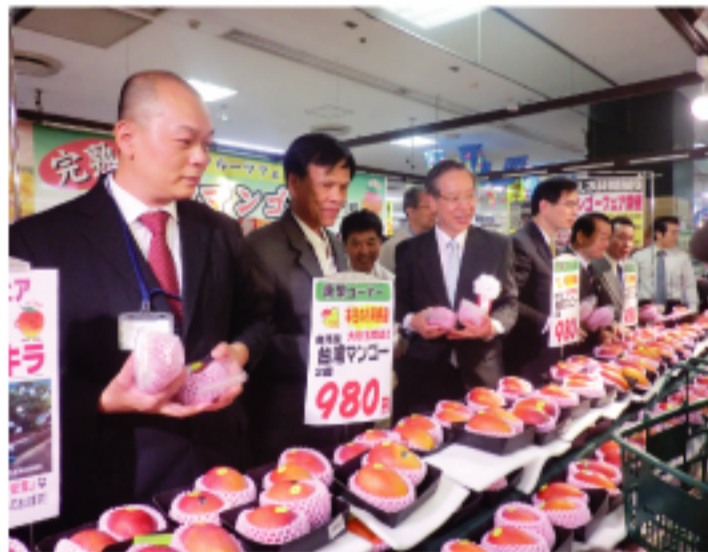
台灣芒果銷路年年成長

【本報訊】東京多摩市聖蹟櫻之丘車站前的京王超市於7月6日~8日的3天期間舉辦「芒果展」，在直通車站的該超市門口和店內，不僅低價販賣打著「芒果阿明」名號的芒果，同時也進行芒果試吃，宣傳台灣芒果的美味。