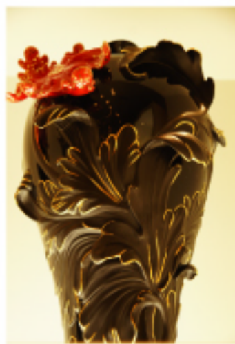
法蘭瓷 惠比壽店內的作品

日本經濟在亞洲舉足輕重，日本人的心思細膩，法藍瓷日本的棋子走的大膽也走得謹慎。如何成功的貼近日本消費者的心是許多企業的課題，期待法藍瓷能夠將台灣的品牌推測到另一個高峰。