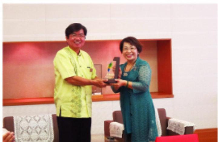
高嶺議長(左)將於8月訪日

至5日訪臺，屆時將拜會臺南市議會。高嶺議長另表示，臺灣訪沖繩之觀光客人數由巔峰期之每年20萬人降至目前之12萬人，盼臺南市協助宣傳沖繩之觀光地，促進臺灣觀光客訪沖繩意願。此外，臺南市氣候與沖繩相似，亦盛產芒果，今後將致力強化兩地之農業及經貿領域之合作交流。