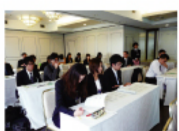
當日專題講座之一景

【本報訊】由一群喜愛台灣的日本學生所組成的日本台灣學生會議關西支部，7月2日起在大阪辦事處的協助下舉辦兩天一夜的日本青年認識台灣研討會，共有30位關西地區日本大學生與台灣留學生參加。日台學生透過專題講座、分組討論、合宿生活進行交流，深入理解彼此間文化差異。