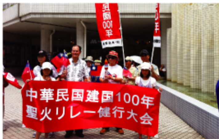
沖繩建國百年聖火健走

繼大阪、福岡之後,百年聖火來到沖繩。沖繩的華僑團體「琉球華僑總會」與日本華僑會共同主辦中華民國一百周年慶祝會。