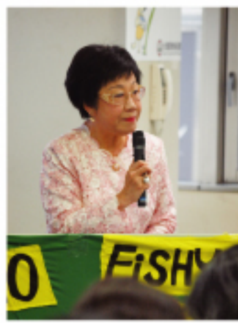
呂前副總統於「反核亞洲論壇 2011」強調反核立場

第14屆「反核亞洲論壇2011」於8月6日結束，出席成員來自印尼、泰國、中國、日本等8個亞洲國家。呂前副總統一行此行來日即是參加部分行程。