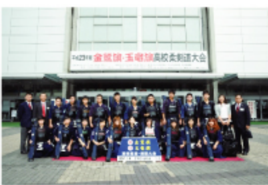
高中劍士們獲獎於「玉龍旗」劍道大會會場前

福岡市舉行訪團報告會暨交流懇談會。為感謝日本交流協會本次之邀請及西日本新聞社等之協助，2名學員以日文報告訪日心得感想及代表致謝詞。