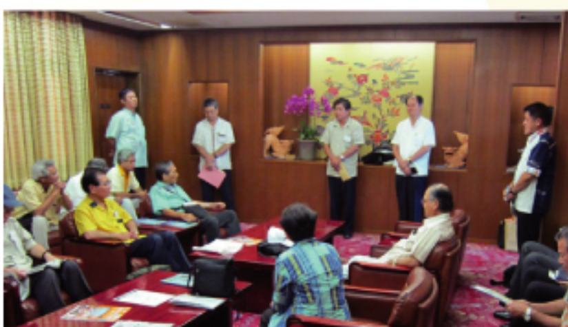
高嶺善伸（議長）及該連盟議員一行共27人訪台

【本報訊】「琉中親善沖繩縣議會議員連盟」會長高嶺善伸（現任議長）率該連盟議員，於100年8月2日至5日造訪台灣。該團除造訪相關政府機關及地方自治體，並擬參訪新竹科學園區，瞭解IT產業軟體發展現況；另為瞭解捷運與公車轉乘系統之通聯及票價整合機