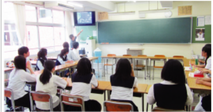
日本高中生聆聽臺灣留學生說明臺灣的地理位置

由日本扶輪社主辦的インターアクト年次大會,本年度於八月二十日在埼玉縣榮高等學校盛大舉行,吸引兩百多名青年學子踴躍參與,可說是熱鬧非凡。所謂インターアクト年次大會,是為了增進日本學生對國際文化的認知與瞭解,以及表揚對國際交流有幫助的志願工作者們,每年由扶輪社與主辦學校所舉辦的大型典禮,出席者除了扶輪社的來賓、受獎志工之外,還包括了參與活動的二十多所高中學生。而本年度大會最特別的地方,在