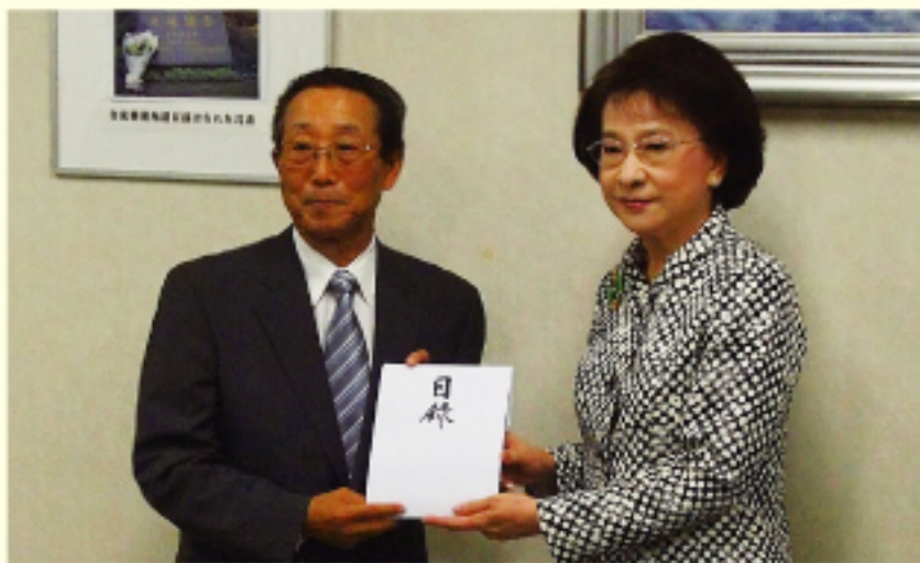
前中國國民黨副主席林澄枝(右)

【本報訊】總統府資政林澄枝抵日，代替中華民國婦女聯合會主任委員捐贈1000萬台幣，善款於8月26日轉交給位於東京六本木的交流協會，做為311大地震的重建資金，由交流協會理事長田中篤代為收下，林資政對於日本人的災後復興之認真態度表敬佩，田中篤理事長則代替日本國民表達謝意。