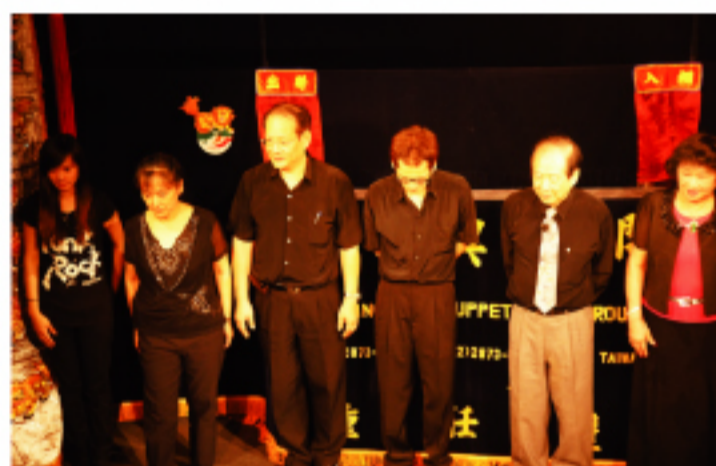
此次來日公演之家族團員，左三及左四為鍾師父的公子

「孫悟空大戰紅孩兒」整場表演，登場人物重點雖然在孫悟空和紅孩兒，但是其分身的出現、變身的過程，紅獅和老虎的出現，背景音樂的變換，白馬登場時的馬蹄聲，加上由於舞台背景全黑，天空七彩的點綴等，不論視覺和聽覺處處讓人感受其用心，先人智慧展露無疑。