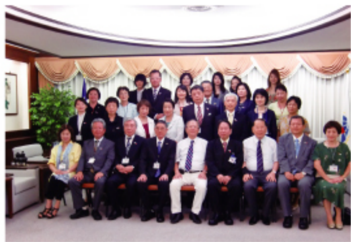
吳僑務委員長英毅(右五)與回國致敬團團員合影

【本報訊】九州、山口各地華僑總會為慶祝中華民國建國百年，在駐福岡辦事處的協助，福岡縣中華總會會長吳坤忠奔走籌劃下組回國致敬團。一行30人於8月8日由福岡出發，返國期間拜會僑務委員會、外交部亞東關係協會及參觀總統府等。 致敬團抵達台灣當天下午即拜會僑務委員會，獲吳英毅委員長等僑委會官員熱烈歡迎，雙方並進行懇談。席間，僑務委員會吳委員長特頒感謝狀予福岡縣