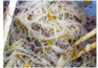
由本會活動組組長製作的炒米粉,並帶領高中生認識臺灣美食

報名成功前48名,贈送台灣啤酒一罐! 請在匯款截止日9月2日(星期六)前將費用匯至以下的帳戶 銀行名:みずほ銀行 支店名:広尾支店 店番:057 普通口座:1864363 口座名:中華民國留日東京同學會 (チュウカミンコクリュウニチトウキョウドウガクカイ) 請參加者自行負擔匯款手續費。